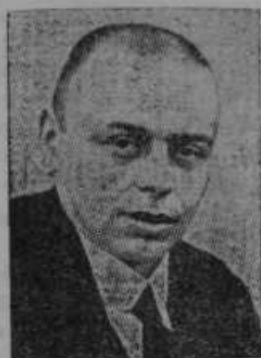
Bela Kun, madjarski žid in eden najhujših komunističnih krvolokov, je bil v Moskvi ustreljen.