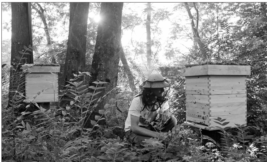
Kolektiv Trajna, Simbiocen, 2017.

Na tej podlagi je – z novimi sodelovanji v letu 2017 – nastala nadgradnja pridobljenih znanj. Nastala je razvijajoča se platforma Simbiocen, ki raziskuje možnosti za sodelovanje med različnimi živimi bitji in išče načine za oblikovanje simbiotičnih ekosistemov v različnih kontekstih. Hkrati se nova platforma še vedno ukvarja tudi s problemom tujerodnih invazivnih rastlin. Zaradi posledic človekovih radikalnih posegov v naravne ekosisteme – kot so vzpostavitev globalnih trgovskih poti, intenzivnega kmetijstva in hitrega širjenja urbaniziranih habitatov – se namreč v novih domovanjih tujerodne invazivne rastline nesorazmerno razraščajo. Premislek o čezmerni razširjenosti in neprepoznani vrednosti tujerodnega invazivnega pajsena ( Ailanthus altissima ) je oblikovalski kolektiv Trajna spremenil v priložnost za oblikovanje lesenih čebelnjakov in začasnega delovnega studia, opremljenega z unikatnim pohištvom, izdelanim iz biomase invazivnih rastlin (slika 7).