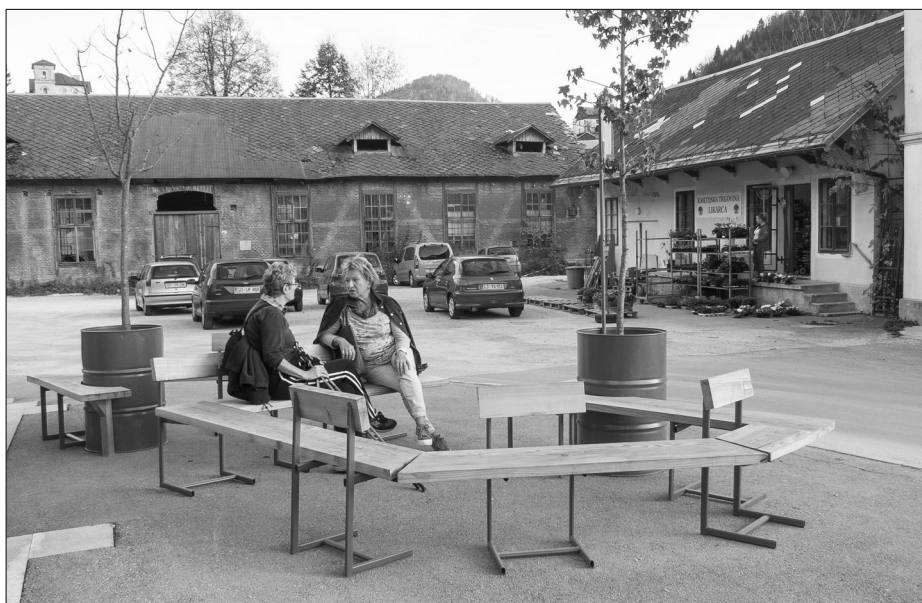
ProstoRož, IPoP in prebivalci Idrije, projekt Trajnostna urbana regeneracija: primer Idrije, 2017.

Vzpostavljanje možnosti za opisana skupnostna srečevanja je skupni imevalec delovanja skupine ProstoRož. Medtem ko so sprva arhitektke projekte