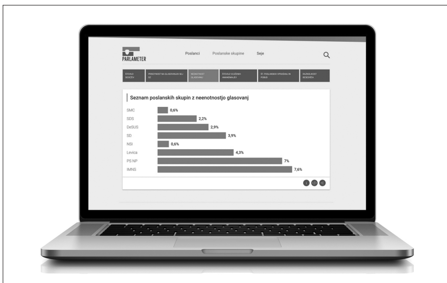
Danes je nov dan, Parlameter, 2016.

Eden od odgovorov, ki zajemajo zgornje postavke, je projekt Parlameter (slika 8). Z njim so se na inštitutu odločili prikazati delovanje državnega zbora na uporabniku prijazen in razumljiv način in s tem izboljšati prepoznavnost parlamenta. Zagovarjajo namreč tezo, da boljši dostop do informacij nujno vodi do boljšega razumevanja delovanja in posledično do večjega zanimanja za demokratične procese. Zato razvoj celotnega projekta temelji na informacijskem oblikovanju, na tako imenovanem smiselnem prevajanju podatkov v informacije. 4 Pri projektu Parlameter je (bila) torej najpomembnejša naloga ta, kako podatke s parlamentarnih zasedanj, glasovanj in transkriptov oblikovati v informacije. Rezultat je spletno orodje, ki analizirane podatke vizualizira in predstavlja v obliki samostojnih informacijskih kartic ter uporabnikom na preprost način omogoča, da jih delijo na družabnih omrežjih, jih vgrajujejo v druge spletne strani, prispevke in analize. Gre torej za eno od oblik oblikovalskega aktivizma, kjer z orodjem (kot je Parlameter) splošni in strokovni javnosti ponudijo možnost drugačnega pogleda na obstoječe z željo spodbuditi razpravo in po možnosti dolgoročno gledano spodbuditi tudi (spremenjen) odziv.