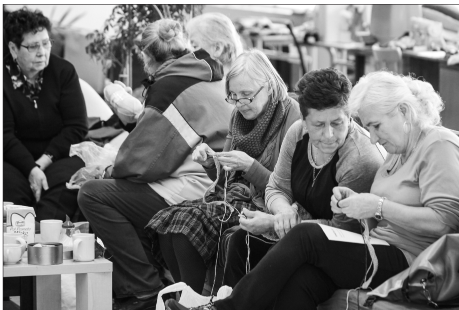
Oloop in Up, Razkrite roke, proces soustvarjanja, 2017.

Opisana intervencija je s prvo akcijo spodbudila proces premisleka o revitalizaciji javnega prostora ter začetek nadaljnjih pogovorov in dogovorov z Občino Idrija. Skupaj s skupino ProstoRož pripravljajo tudi dolgoročno trajnostno ureditev mesta v obliki akcijskega načrta v tesnem sodelovanju s prebivalci, saj je občinska uprava pokazala veliko zanimanje za nove pristope k prenovi in načine vključevanja prebivalcev. Kot enega od rezultatov pripravljajo tudi priročnik, ki bo predstavil dober idrijski primer drugim občinam. Poseben poudarek je namenjen vprašanju, kako s prebivalci in oblikovalci vzpostaviti dialog s ciljem skupnega preoblikovanja mesta. Gre namreč za proces, ki ne temelji zgolj na vzpostavljanju participiranja občanov z občino. Sploh danes, ob inflaciji uporabe besede participacija, se vključevanje mnenj v postopku načrtovanja prepogosto posplošuje. Posledično nam lahko skozi prste uidejo podatki o tem, kdo je lahko v resnici participiral in čigava mnenja so bila upoštevana. Zato je vsak tak projekt za ProstoRož praktični primer iskanja in ponazarjanja načinov, kako lahko skozi prakso na konkretnem primeru vključujemo prebivalce. Bistvo testnega projekta v Idriji se bo tako lahko izkazalo šele dolgoročno oz. takrat, ko bosta skupnost in občina vse nadaljnje korake sooblikovali. Takrat, ko bo skupnost rezultate intervencij redno uporabljala, jih preobli-