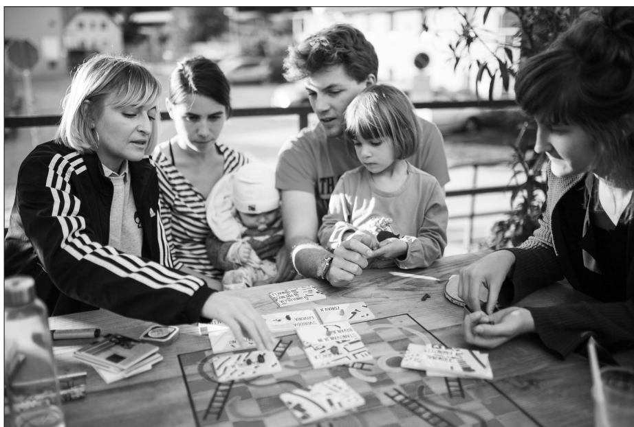
ProstoRož, družabna igra za graditev vizij o javnem prostoru. Mestni vizionar, 2017.

Ali če zastavimo vprašanje drugače: Kakšni so torej nastajajoči projekti oblikovanja, ki v praksi lahko vodijo do alternativnih prostorov solidarnostnih skupnosti? Med najštevilnejšimi projekti oblikovanja najdemo tiste, pri katerih se vzpostavljajo možnosti za skupnostna srečevanja. Srečanja s posamezniki in skupinami so