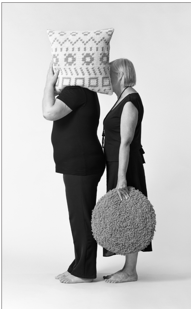
Oloop in Up, izdelki projekta Razkrite roke, 2017.

jo ukvarjati s preoblikovanjem stanj in pogojev, katerih cilj preoblikovanja je polnomočenje posameznikov. Povedano drugače, oblikovalci se prenehajo ukvarjati z oblikovanjem izdelkov za potrošnje in se osredinijo na odpravljanje tistega, kar je posameznike oviralo pri realizaciji obstoječih zmožnosti, pri okrepitvi nadaljnje razvoja. Med takšne projekte spada večletni projekt Razkrite roke oblikovalske skupine Oloop in Človekoljubnega dobrodelnega društva UP Jesenice. Projekt postavlja v središče ranljive skupine ljudi – predvsem priseljenke in invalidne osebe –, živeče na Jesenicah in v azilnih domovih.