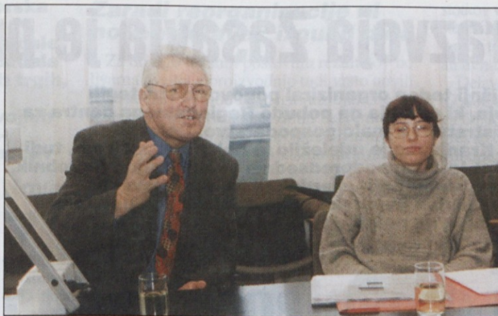
Slovensko javno mnenje 1998

Na vprašanje, v kateri sindikat ste včlanjeni, je 16,9 odstotka ankeriranih odgovorilo, da v Zvezo svobodnih sindikatov Slovenije, v Neodvisnost 1,1 odstotka, Konfederacijo Pergam 0,5 odstotka, v različne samostojne sindikate po ponogah in poklicih pa je sodeč po rezultatih ankete