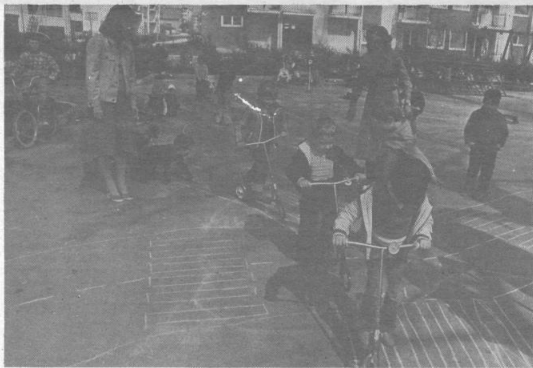
Najmlajši iz VVZ Malči Belič so se že preizkusili v znanju o varnosti v cestnem prometu.