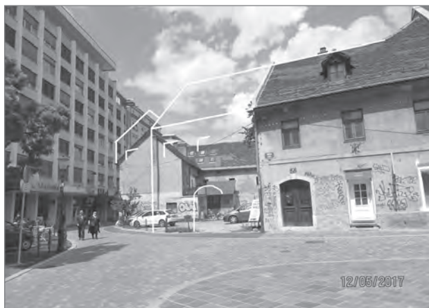
Slika 7: Fotomontaža gabaritov za zaključek Male ulice v Ljubljani

kalne parke. Našteto so prav tako pomembne naloge sodobnega urbanizma oziroma urbanista, kot so bili regulacijski načrti in njihova implementacija v devetnajstem stoletju ali širokopoltezna izgradnja velikih ansamblov sosesk po načelih Corbusierovega sončnega mesta, Bauhausa in prvotne atenske listine.