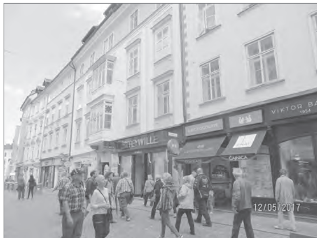
Slika 2: Enaka pročelja, enake trgovine, enaki turisti – ujeti v globaliziranem urbanizmu.

Opisani tokovi izoblikujejo tipične turistične itinerarje, »zero points« turističnega vrveža, najbolj obiskane ulice in trge za tipične aktivnosti: ulice restavracij, ulice kavabarov, ulice umetniških galerij in slikarjev, ki ustvarjajo na prostem, ulice prodaje spominkov, ulice prodaje »kramarije«. Obnašanje multikulturnih množic postaja vse bolj predvidljivo in uniformirano. Kulise prenovljenih stavb – gotskih, renesančnih, baročnih, secesijskih, neoklasičnih – vse bolj postajajo neka povsod enaka scena za neko povsod enako dogajanje.