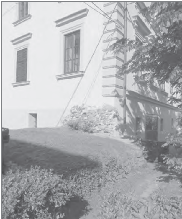
Slika 4: Manj opažene posebnosti lahko pripomorejo k večji razpoznavnosti – ostanki rimskega zidu v Ljubljani.

Moderna znanost in tehnologija omogočata uporabo historičnih središč tudi za najbolj ambiciozne in zahtevne urbane