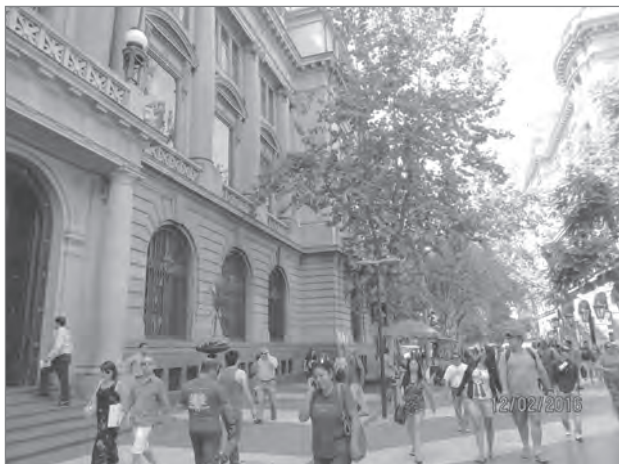
Slika 1: Prizor iz pešcone v Santiagu de Chile bi lahko bil posnet kjerkoli.