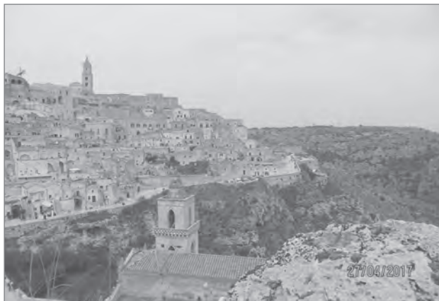
Slika 3: Ohranitev značilne topografske lege je bistvena za pričevalnost mesta – Matera.

sti, velikosti in umetnostni vrednosti niso posebno pomembni, so pa ključni za nastanek, razvoj in obstoj starih mest. Z obnovo tlakov in uličnih fasad mestnih palač, dvorcev ali gradov, z vsemi njihovimi slogovnimi značilnostmi, nismo storili dovolj za identiteto konkretnega mesta. Zgodovinski slogi so bili namreč že v svojem času globalni in svetovni ter jih srečujemo povsod po evropskih in zunajevropskih mestih. Ponavljamo tako rekoč iste stvari. Prenoviti in vsebinsko vključiti v sodobne funkcije je treba tudi manj izrazite, manj razkošne in manj spomeniško vredne gradnje, ki pa so bile za zgodovinski razvoj mesta in njegovo identiteto ključnega pomena. Taki primeri so stari mostovi, mitnice, kašče, mlini in žage, znamenja in kapelice, opuščeni vodnjaki, zaraščeni izviri, kraji za pranje perila ob potokih, ostanki obzidij ali utrdb, sledi prvotnih cest, železnic ali pristanišč, stare vojašnice, skladišča, lazareti, prvi industrijski objekti, rudniške naprave in prva kopaljšča.