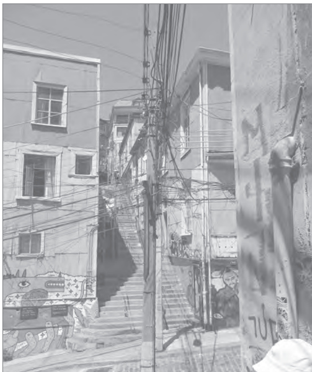
Slika 5: Raznobarvnost stopnic in pročelij daje tej revni četrti v Valparaisu čar unikatnosti.

kitajskega, japonskega ali kakega drugega kulturnega kroga. Moralo bi veljati tudi za žal zamujene priložnosti ohranitve identitete naselij izginulih ali skoraj izginulih civilizacij Majev, Inkov, severnoameriških Indijancev, nasebinske dediščine afriških plemen ali avstralskih črncev. V tem pogledu je prevlada zahodnjaške civilizacije, njene arhitekture in urbanizma napravila starim avtohtonim naseljem izjemno škodo in krivico. Morda cena za to storjeno zgodovinsko zlo plačuje zahodni človek danes.