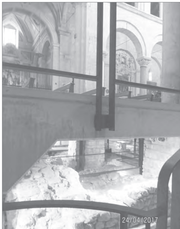
Slika 6: Plastenje arhitektur iz različnih obdobij je bistvena kakovost evropskih mest.

[5] Mesta postajajo globalni talilni lonec različnih civilizacij.