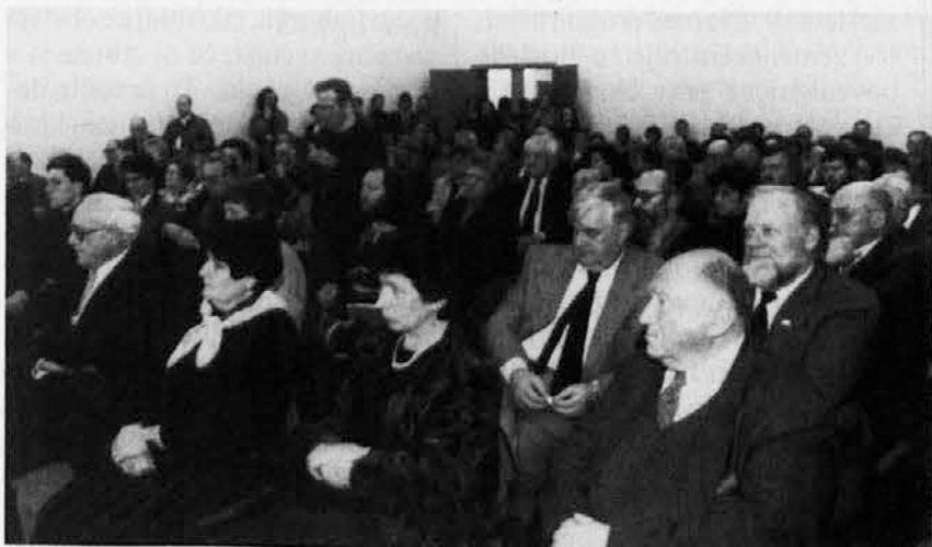
V Zavodu sv. Družine v Gorici so slovesno proslavili 70-letnico GMD

To ni več spretna politika - to je umazana politika!