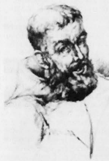
Janez Svetokriški (1647-1714)

V Vipavskem Križu blizu Ajdovščine so v nedeljo popoldne odkrili spomenik svojemu največjemu rojaku Janezu Svetokriškemu. Bil je prvi in doslej tudi največji kapucinski pridigar in prvi slovenski cerkveni pripovednik. Oče kapucin Janez Svetokriški (rojen je bil z imenom Tobija Lionelli, njegovo redovno ime pa je bilo Janez Krstnik) je med najbolj pomembnimi in slavnimi Slovenci zato, ker je prvi začel razvijati cerkveno govornišvo v materinem jeziku, zlasti pa zaradi tega, ker je z obsegom, vsebino in slogom svojega dela prekosil vse slovenske književnike tistega časa in tudi poznejših obdobij.