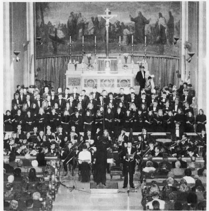
Posnetek s sobotnega koncerta v šentjakobski cerkvi

Po velikem odmevu in uspehu, ki je izvedba Sattnerjeve kantate Oljki doživela v prejšnjih tednih v Gorici in v Štandrežu, se je nekaj podobnega zgodilo tudi v soboto, 10. t.m., v cerkvi sv. Jakoba v Trstu. Tržaški koncert sta omogočili Zveza cerkvenih pevskih zborov in šentjakobsko kulturno društvo.