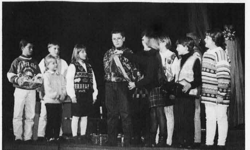
Štandreški otroci med predstavo

Tudi sv. Miklavž je bil z nastopom štandreških otrok zelo vesel in je s seboj prinesel res veliko paketov v splošno zadovoljstvo prisotnih. Največje so seveda dobili otroci, toda tudi nekdanji otroci so bili deležni njegove radodarnosti, posebno še tisti, ki so aktivni v župnijski skupnosti.