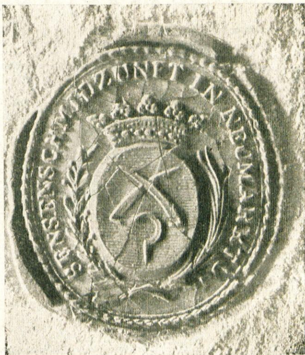
Zgoraj: Pečat kosarskega ceha