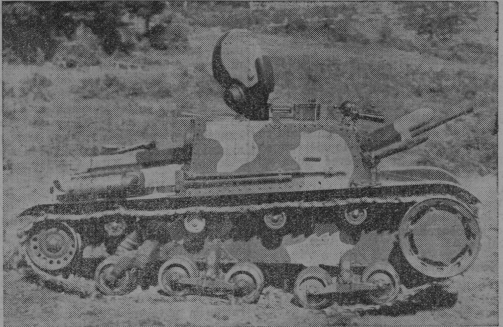
Naš izvidniški tank, kakršnih je bilo več videti ob priliki zadnjih naših velikih vojaških vaj.