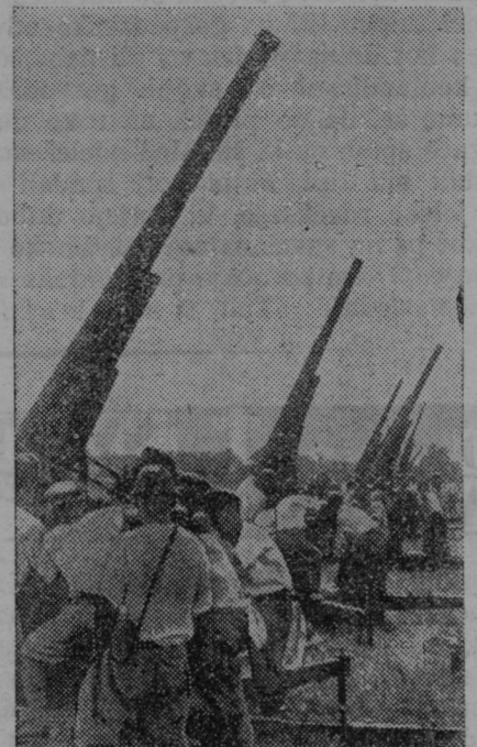
S takimi topovi obstreljujejo Japonci pred Šangajem kitajska letala.

šitvi po nauku katoliške cerkve. Organizacija izdaja »Križarsko Stražo« kot glasilo kmečke križarske mladine, »Socialno delo« kot glasilo delavske mladine, za male križarje in križarice pa »Vrtec«, ki izhaja v Sarajevu. Velik napredek zabeležuje tudi križarsko Sestrinstvo, ki ima v svojih stanovskih organizacijah 120 kmečkih, 72 delavskih organizacij, 7 starešinskih organizacij in 185 organizacij malih križaric, torej 409 društev s 14.974 članicami. Od lanskega leta porast: 58 društev s 4974 članicami. V teh društvih se je vršilo sestankov: cerkvenih 1509, prosvetnih 6124 in odborskih 1963, skupno 9596 sestankov. Organizacija križaric izdaje svoje glasilo pod naslovom »Za vero in dom«. Tekom enega leta je celokupna križarska organizacija (moška in ženska) porasla za 178 društev in 9520 članov in članic. To je zgradba, ki ne gradi na pesek, marveč na trdno podlago katoliške vere in življenja iz Boga. Ko bratom Hrvatom čestitamo k lepim uspehom njihove najjagilnejše organizacije, hkrati prosimo Boga, da bi tudi v bodoče bogato blagoslovil delo in napredek te organizacije.