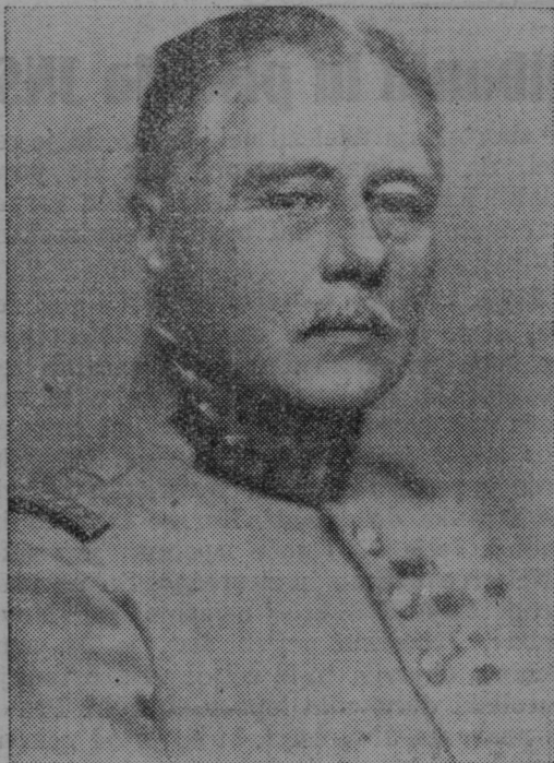
General Gamelin, šef francoskega generalnega štaba, je prisostvoval našim velikim manevrom.