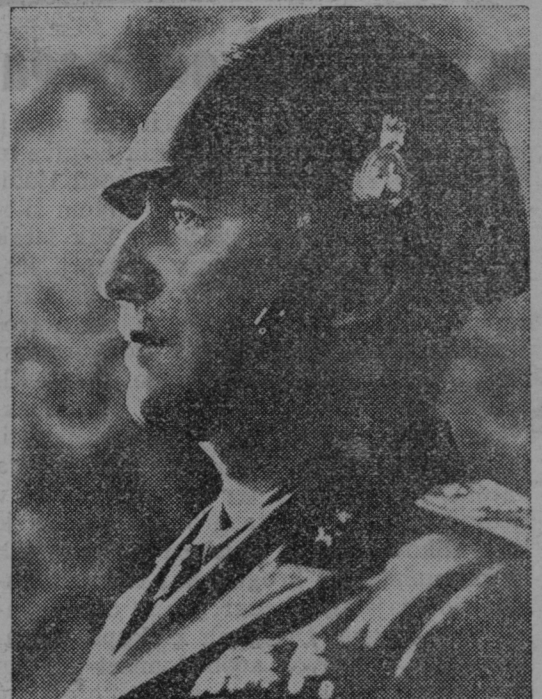
General Alberto Pariani, šef glavnega generalnega štaba italijanske vojske, je bil navzoč na naših manevrih ob Kolpi.

šitvi po nauku katoliške cerkve. Organizacija izdaja »Križarsko Stražo« kot glasilo kmečke križarske mladine, »Socialno delo« kot glasilo delavske mladine, za male križarje in križarice pa »Vrtec«, ki izhaja v Sarajevu. Velik napredek zabeležuje tudi križarsko Sestrinstvo, ki ima v svojih stanovskih organizacijah 120 kmečkih, 72 delavskih organizacij, 7 starešinskih organizacij in 185 organizacij malih križaric, torej 409 društev s 14.974 članicami. Od lanskega leta porast: 58 društev s 4974 članicami. V teh društvih se je vršilo sestankov: cerkvenih 1509, prosvetnih 6124 in odborskih 1963, skupno 9596 sestankov. Organizacija križaric izdaje svoje glasilo pod naslovom »Za vero in dom«. Tekom enega leta je celokupna križarska organizacija (moška in ženska) porasla za 178 društev in 9520 članov in članic. To je zgradba, ki ne gradi na pesek, marveč na trdno podlago katoliške vere in življenja iz Boga. Ko bratom Hrvatom čestitamo k lepim uspehom njihove najjagilnejše organizacije, hkrati prosimo Boga, da bi tudi v bodoče bogato blagoslovil delo in napredek te organizacije.