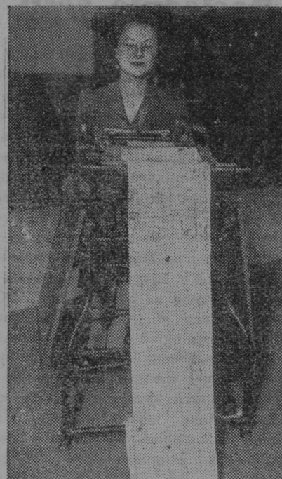
Najnovejši pisalni stroj.

Romunski prestolonaslednik Mihael bo izpolnil dne 16. oktobra 16 let.