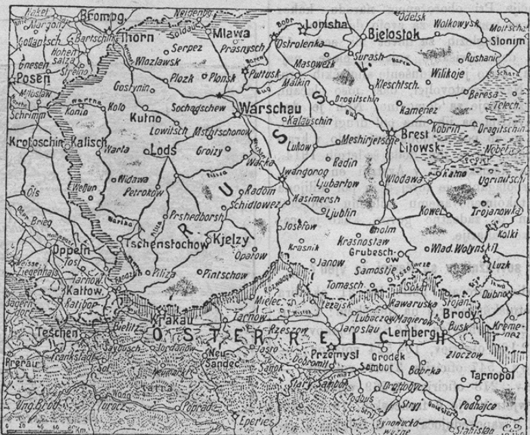
Osterreichische Kriegsschauplatz in Galizien und Polen.

Na ruskem bojišču imajo nemške in avstro-ogrške armade lepe uspehe zaznamovati. Medtem ko se Nemci pod generalom Hindenburgom krepko proti Varšavi pomikajo, kar bode končno doneslo do obleganja te ruske trdnjave, vrgli