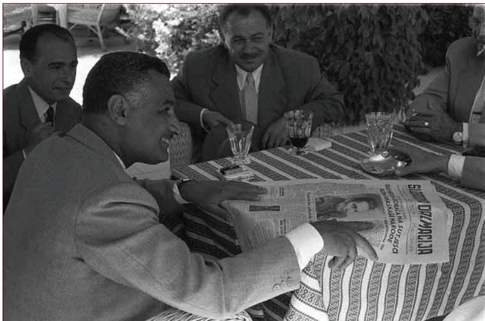
Slika 5: Gamal Abdel Naser lista časopis Slobodna Dalmacija. 192