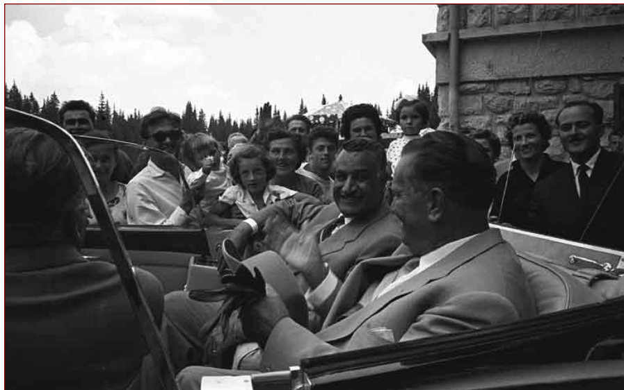
Slika 2: Josip Broz – Tito in Gamal Abdel Nasser tekem enega izmed številnih Naserjevih obiskov v Jugoslaviji. 41

A vendarle jugoslovanska zunanja politika z negacijo socialističnih elementov v samoidentiteti ZAR ni imela težav. Prav tako tudi ni nikoli resno intervenirala v primerih notranjega preganjanja komunistov, pri čemer lahko precedens najdemo že leta 1955, tako rekoč neposredno po Titovem odhodu s prvega srečanja z Gamalom Abdelom Naserjem. Slednji je namreč pred vojaško sodišče postavil 21 komunistov pod obtožbo vojaške zarote, pri čemer Tito ob sprejemu novice ni nastopil kritično do Naserjeve notranje politike in je situacijo komentiral z naslednjimi besedami: »V zunanji politiki ni antikomunizma, v notranji pa je to popolnoma upravičeno. Če komunisti ne razumejo, kaj je interes nacije, ki se šele vlačí iz kolonialnega položaja, potem to niso komunisti, ampak goli agenti nekega političnega šefa.« 40