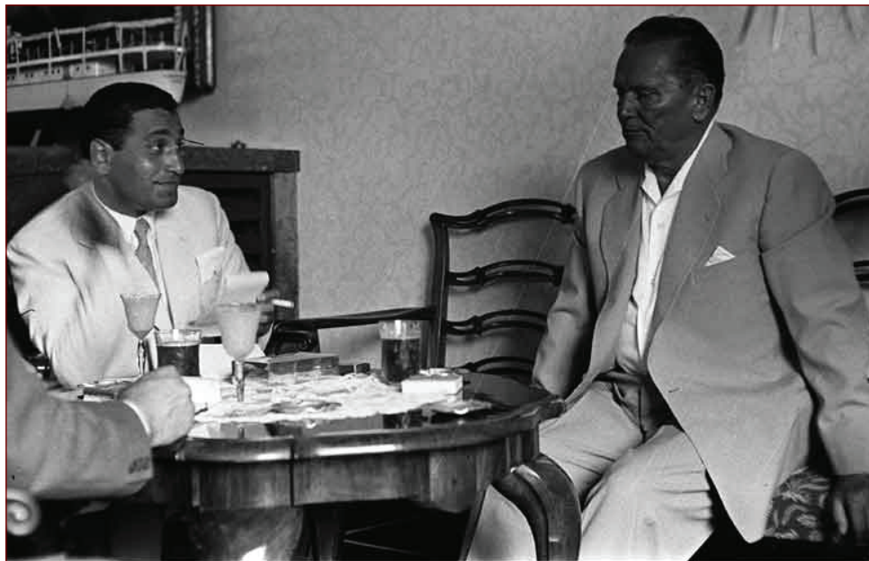
Slika 3: Mohamed Heikal in Josip Broz - Tito. 59

bojijo omejevanja razrednih razlik in to mešajo s komunizmom, morajo pogled usmeriti na družbo v Skandinaviji in Veliki Britaniji, kjer se razredi premikajo v smeri združevanja v en razred, ki združuje celotno družbo v atmosferi izobilja in pravice.» 58