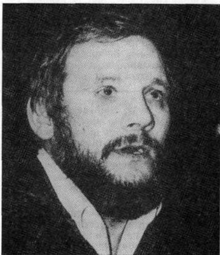
Bil je eden od največjih alpinistov na svetu: Jerzy Kukuczka

Dne 21. oktobra je Kukuczka skupaj s plezalskim kolegom Pawlowskim postavil šesti višinski tabor na višini okoli 8000 metrov. Naslednji dan sta bivakirala na višini 8150 metrov in še dan pozneje spet 150 višinskih metrov višje. Bila sta popolnoma izčrpana in na koncu z močmi, deloma zaradi napornega plezanja in deloma (ali še bolj) zaradi življenja na takšni višini. Dne 24. oktobra se je zgodila nesreča, ki je zelo verjetno posledica dveh zaporednih bivakov na višini nad 8000 metrov. Pawlowski namreč ni znal razložiti, kako je njegov soplezalec padel in kaj se je dogajalo neposredno pred tem, saj je sam prišel v bazni tabor popolnoma izčrpan. Po podatkih, ki so nam doslej na voljo, naj bi bil vzrok za Kukuczkov padec orkanski veter, ki je njega odpihnil iz stene, njegov soplezalec pa se je obdržal.