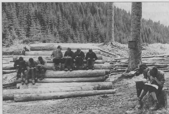
Terenske vaje študentov gozdarjev

Študij gozdarstva se je v preteklosti poučeval v okviru kmetijskega šolstva. Imeli smo gozdarske šole, višješolskih in visokošolskih institucij pa ne. V avstrijskem času so dali gozdarstvu obeležje nemški strokovnjaki. Slovenski študentje so potrebna znanja pridobivali na gozdarski akademiji v Maria-brunu pri Dunaju. Ustanovljena je bila leta 1813 in iz nje se je leta 1875 razvil gozdarski oddelki visoke šole za kulturo tal na Dunaju, ki je bila vse do zloma Avstrije edino visokošolsko gozdarsko učilišče. Tu so študirali slovenski strokovnjaki, saj diploma gozdarske akademije v Zagrebu, ustanovljena 1897. leta, v avstrijskih deželah ni veljala. Položaj se je nekoliko izboljšal z ustanovitvijo prve jugoslovanske države leta 1918, ko se je strokovna moč okrepila na račun absolventov gozdarskih fakultet v Zagrebu in Beogradu. 33 Kot prva je bila leta 1919 z združitvijo višje šole Višjega gospodarskega učilišča v Križevcih in gozdarske akademije v Zagrebu ustanovljena Gospodarsko-gozdarska fakulteta v Zagrebu.