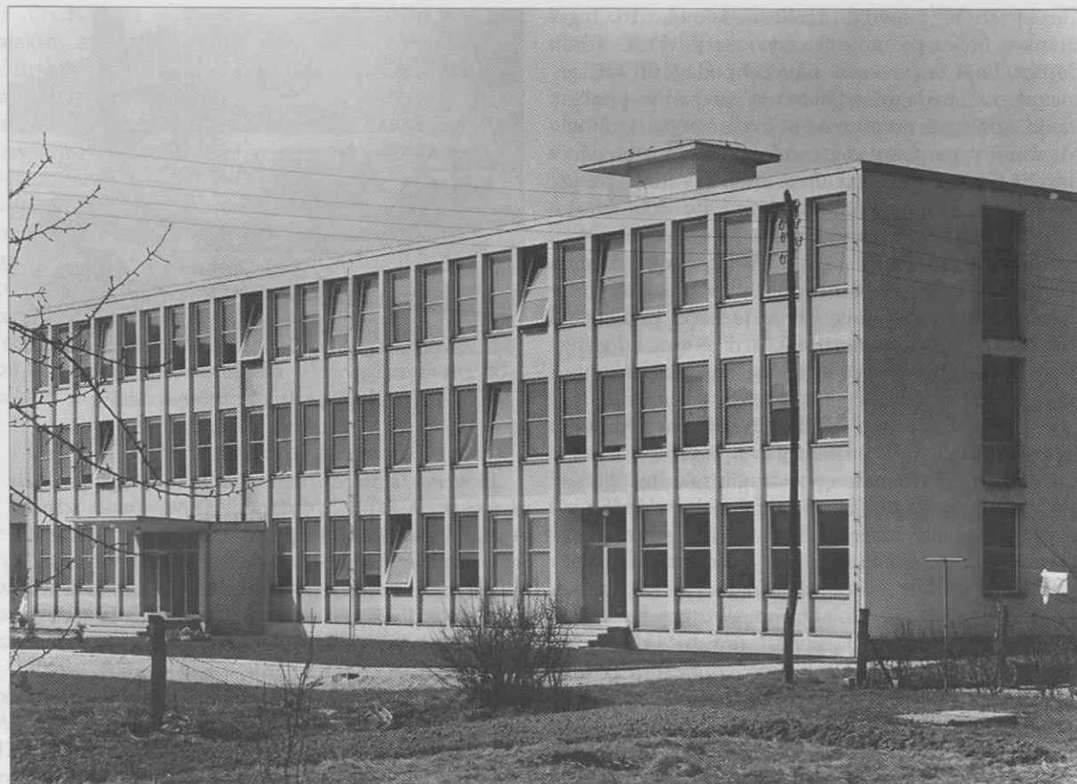
Veterinarski oddelek Biotehniške fakultete

nadaljevati študij na drugi stopnji. Prva oblika študija je omogočala študentu, da je že ob koncu drugega šolskega leta dosegel diplomu prve stopnje, ki je dokazovala pripravo za strokovni poklic. Prvi diplomski izpit je bil predvsem praktičen in ga je kandidat opravljal po predpisanem številu opravljenih izpitov. Za vpis na drugo stopnjo je bila predpisana diploma prve stopnje in dodatni izpit iz matematike, kar je veljalo za agronomski in gozdarski oddelek. Na veterinarskem oddelku je bil možen pogojni vpis tudi brez diplome prve stopnje ob pogoju, da kandidatu manjkata največ dva izpita, ki ju je moral opraviti do konca četrtega semestra. 28 V okviru stopenjskega študija je bilo tako omogočena diplomantom prve stopnje strokovna zaposlitev v gospodarstvu.