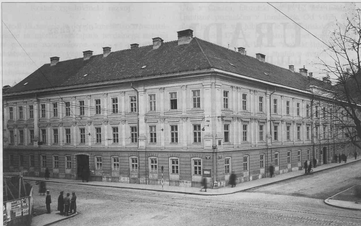
Poslopje matične stavbe fakultete na Krekovem trgu