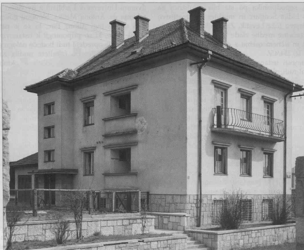
Dekanat Agronomske in gozdarske fakultete na Hacquetovi ulici

Ministrstvo za gozdarstvo je načrtovalo še gradnjo Gozdarske fakultete in v ta namen pridobilo pod Rožnikom ustrezno parcelo. Ko je bila jeseni leta 1949 Agronomska fakulteta razširjena v Agronomsko in gozdarsko fakulteto, se je pojavil nov prostorski problem. Fakultetni svet nove fakultete je soglasno določil, da predlaga za leto 1950 zgraditev skupnega poslopja pod Rožnikom. 16 Leta 1957 je bilo sezidano novo poslopje inštituta za lesno in gozdno gospodarstvo ob Večni poti pod Rožnikom in poznejši paviljon ob tej cesti, šele leta 1960 pa je bil izdelan idejni in investicijski program za graditev objektov pod Rožnikom za agronomski oddelek. Novembra leta 1961 je bila svečana otvoritev nove stavbe gozdarskega oddelka ob Večni poti pod Rožnikom. Poslopje agronomskega in živilsko tehnološkega oddelka si je fakulteta oktobra 1969 pridobila na Jamnikarjevi ulici pod Rožnikom, kjer se je kasneje razvilo moderno biotehniško središče z novimi stavbami za uspešno znanstveno raziskovanje in pedagoško delo.