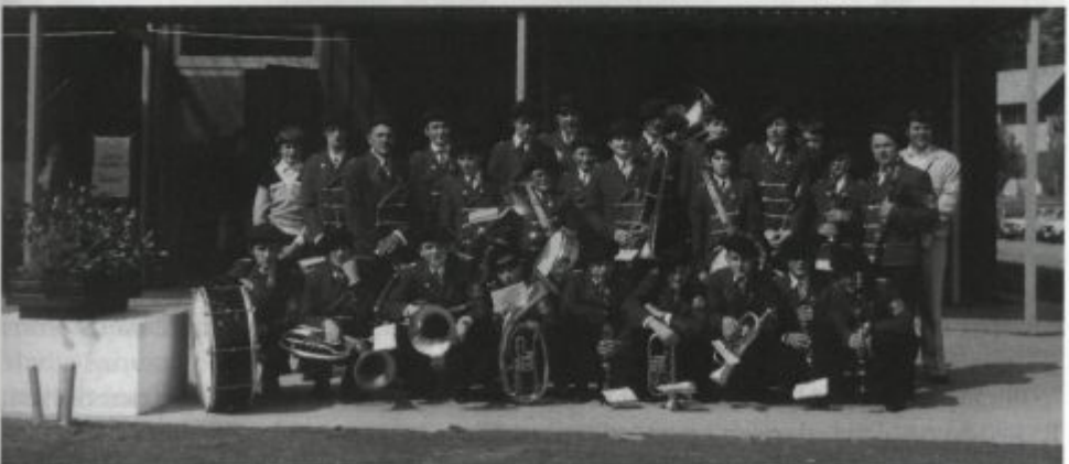
Prvi nastop, 12. julij 1980.