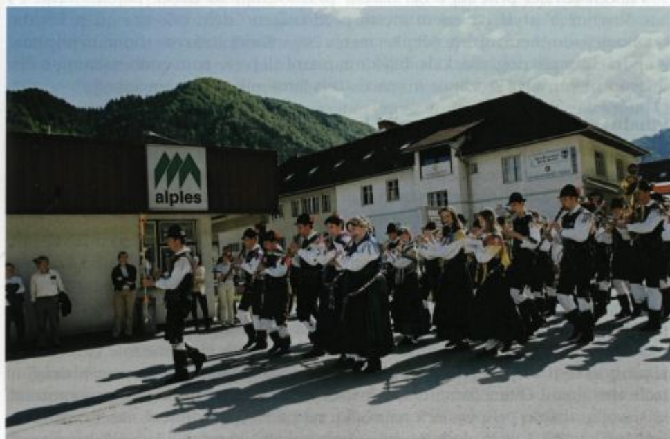
Praznovanje 25-letnice.