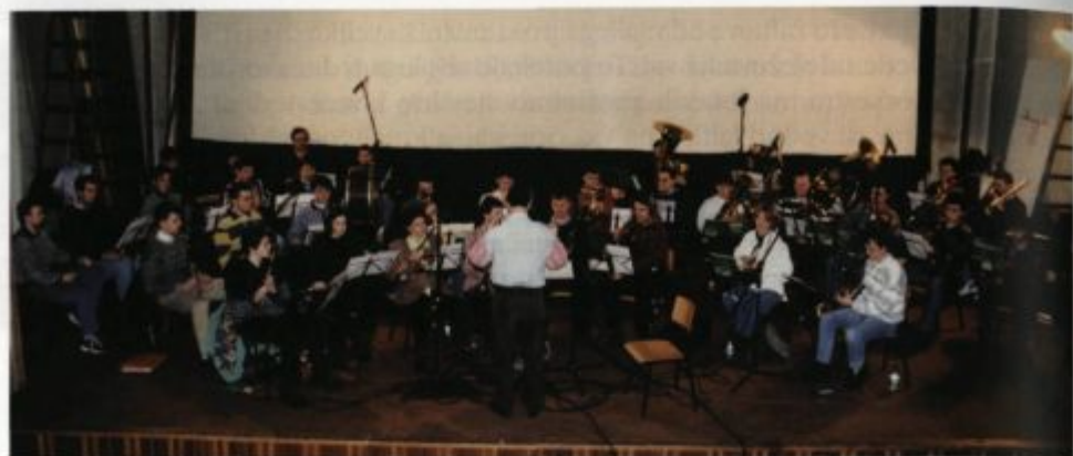
Snemanje kasete in zgoščenke, kinodvorana na Češnjici.