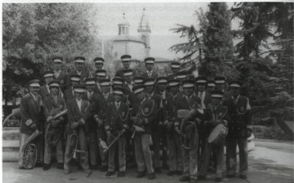
Ob 5. obletnici.

Od ustanovitve pa do 5. obletnice je imel orkester 84 nastopov, kar je približno 17 na leto. »V letu 1984 je bilo opravljenih 1500 ur poučevanja, imeli pa smo 22 nastopov – godbeniki smo ustregli prav vsem, ki so želeli imeti naš orkester na prireditvi,« je v letno poročilo o delu orkestra napisal takratni predsednik Lado Greblo. Pihalni orkester je v prvih petih letih delovanja za svoje delo prejel številna priznanja in to je člane opogumilo za nove naloge in obveznosti v naslednjem petletnem obdobju.