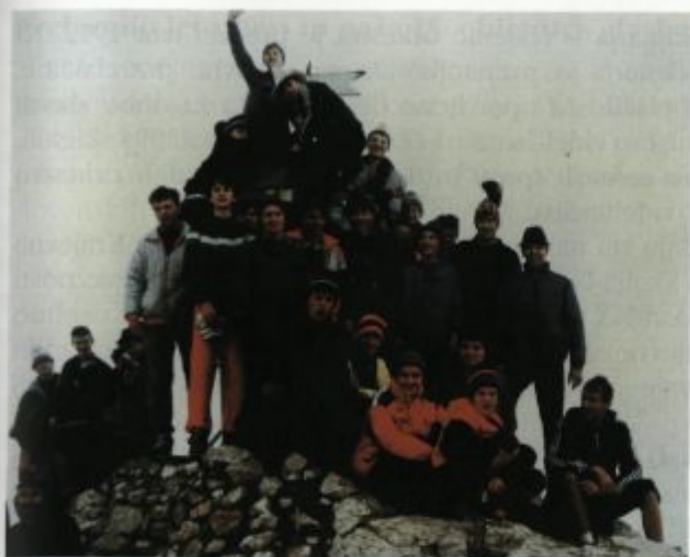
Pihalni orkester na Triglavu

V za Slovenijo prelomnem letu 1990 smo člani orkestra naredili prav poseben podvig - osvojili smo najvišji slovenski vrh. Ideja, da bi z inštrumenti odšli na Triglav, je bila pri nekaterih članih prisotna kar nekaj časa, v letu 1990 pa je dozorela. Žal nas je vse tri dni spremljalo bolj slabo vreme, a je vsem, ki so se pohoda udeležili, ta ostal v nepozabnem spominu. Naš izlet je povsem naključno sovpadal s prireditvijo »Slovenski vrh, na slovenskem vrhu«. Ker se v deževnem septembrskem sobotnem dopoldnevu nismo mogli povzpeti na vrh Triglava, smo v koči na Kredarici sodelovali na tej prireditvi. Z neposrednim radijskim prenosom smo tako igrali poslušalcem Radia Slovenija. Na Triglav smo ponovno odšli leta 1992, a takrat brez inštrumentov.