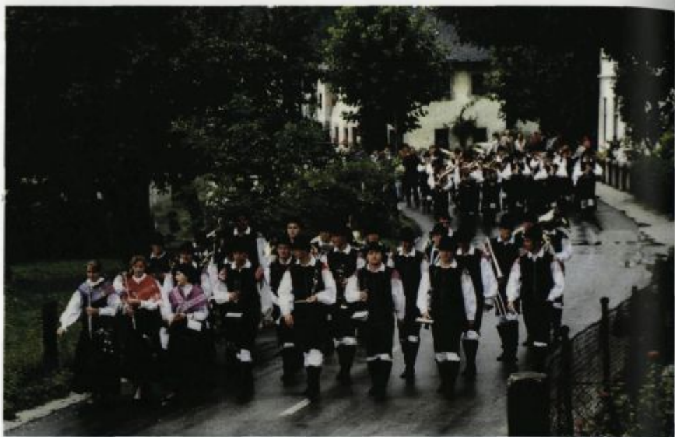
Povorka ob 15-letnici, v ozadju Godba Gorje.