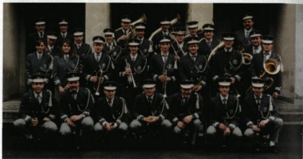
Zadnjič v zelenih uniformah.

Prostori, kjer so bile vaje, so postali last Kmetijsko-gozdarske zadruga Škofja Loka. Pojavilo se je vprašanje, ali bomo v njih še lahko imeli vaje in kako bo z najemnino. Inštrumenti so bili dotrajani, zato je bil nakup novih nujno potreben, denarja pa ni bilo niti za osnovne stvari. Z optimizmom smo zrl naprej in v plan dela zapisali organiziranje praznovanja 15-letnice orkestra in udeležbo na festivalu pihalnih orkestru v Ormožu. Pojavljati so se začele prve želje po lastni kaseti.