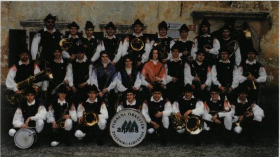
Ob 20. obletnici.

Delo v jubilejnem letu 1999 se je začelo s snemanjem prve kasete in zgoščenke. Nanj smo se pripravljali že v zadnjih mesecih preteklega leta. Snemali smo 13. in 14. marca v kinodvorani na Češnjici in posneli 12 skladb zabavnega ter narodnozabavnega žanra. Predstavitev kasete in zgoščenke smo načrtovali ob praznovanju našega jubileja, a se je žal zataknilo pri tiskanju ovitkov za zgoščenko; do jubilejnega koncerta so bile izdelane le kasete.