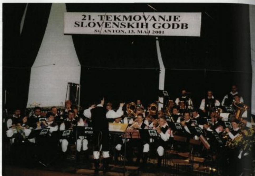
21. tekmovanje slovenskih godb.

V 2. težavnostni skupini sta Pihalni orkester KUD »15. februar« Komen in Pihalni orkester Tržič prejela zlati plaketi s pohvalo, preostala dva pihalna orkestra pa zlati plaketi. Pihalnim orkestrom v 4. težavnostni skupini sta bili prav tako podeljeni dve zlati plaketi s pohvalo; Pihalnemu orkestru mestne občine Kranj, za doseženih 96,3% možnih točk, in Pihalnemu orkestru radeških papirničarjev, za doseženih 95,6% možnih točk. Poleg tega so bile podeljene še tri zlate plakete in eno izmed njih je dobil Pihalni orkester Alples Železniki. Tega uspeha smo bili resnično veseli, saj smo si zanj z mnogimi vajami vsi zelo prizadevali.