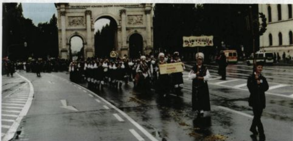
Otvoritvena povorka Oktoberfesta v Münchnu.

Po praznovanju 20-letnice smo se bolj posvetili delu doma. Edino gostovanje orkestra v tujini je bilo septembra 2000, ko smo se udeležili otvoritvene povorke Oktoberfesta v Münchnu. Sodelovali smo na povabilo tamkajšnje slovenske folklorne skupine Lipa. Nastop orkestra v povorki, ki je bila dolga več kot 5 kilometrov, je bil s strani gostiteljev deležen številnih pohval. Gostovanje je godbenikom ostalo v lepem spominu, saj smo po končanem nastopu na prireditvenem prostoru pod šotorom doživeli pravo vzdušje Oktoberfesta.