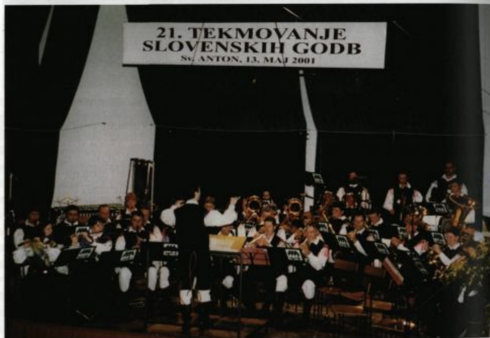
21. tekmovanje slovenskih godb, Sv. Anton pri Kopru.

Do 25. obletnice smo si zadali še en cilj: izboljšanje kakovosti igranja. Razlog za to je bila tudi odločitev, da pričnemo s sodelovanjem na tekmovanjih Zveze slovenskih godb, v katero smo se včlanili leta 2001. Maja istega leta smo se udeležili tekmovanja v 4. težavnostni skupini, ki je bilo v Sv. Antonu pri Kopru. Dosegli smo srebrno plaketo in glede na to, da je bilo to naše prvo tekmovanje, smo bili z uvrstitvijo zadovoljni. Z Zvezo slovenskih godb sodelujemo še na drugih področjih: udeležujemo se seminarjev, izobraževanj in posvetov, ki jih prireja. Poleg tega smo v letu 2001 s trobilno zasedbo orkestra prvič sodelovali na regijskem tekmovanju, kjer smo prav tako dosegli srebrno plaketo.