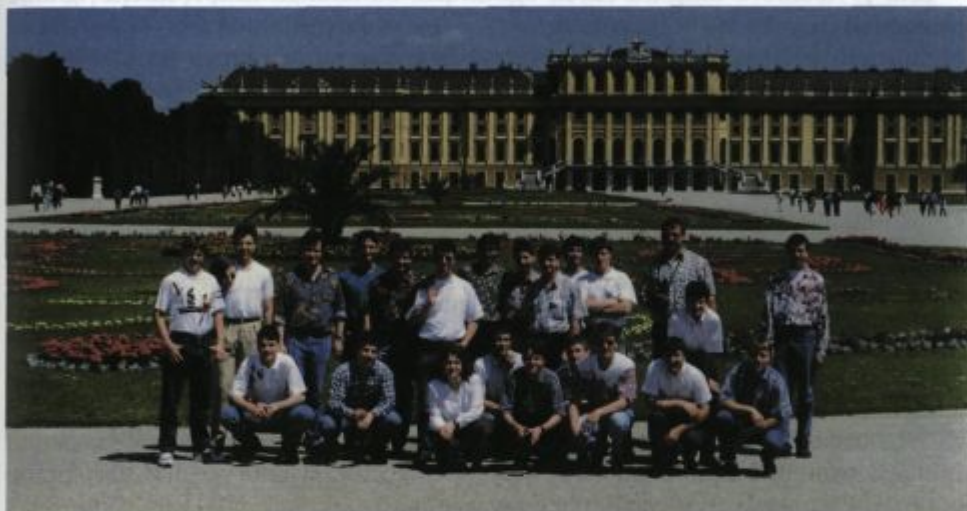
Na Dunaju, v ozadju dvorec Schönbrunn.

Leto 1995 je bilo rekordno z vidika nastopov, saj jih je bilo nad 30. V orkestru je sodelovalo 27 rednih članov; od tega 3 dekleta in 6 novincev. Društvo je skupaj z dirigentom in blagajničarko štelo 35 članov. Leto je bilo izjemno tudi v tem pogledu, da z igranjem ni prenehal niti en član, s čimer se v preteklih letih nismo mogli pohvaliti.