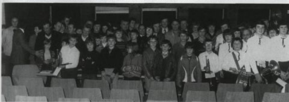
Udeleženci ustanovnega občnega zbora.

Ustanovni občni zbor Pihalnega orkestra Alples Železniki je bil 13. novembra 1982. Od takrat dalje je bil, pod pokroviteljstvom podjetja Alples, orkester organiziran kot samostojno društvo v okviru Zveze kulturnih organizacij Škofja Loka. Samostojno je začel poslovati 1. januarja 1984, pred tem datumom se je vse poslovanje vodilo v okviru sindikata podjetja Alples. Hkrati so s svojim delom pričeli organi društva; izvršilni odbor, nadzorni odbor in disciplinsko razsodišče. Za prvega predsednika orkestra je bil na ustanovnem občnem zboru izvoljen Lado Greblo.