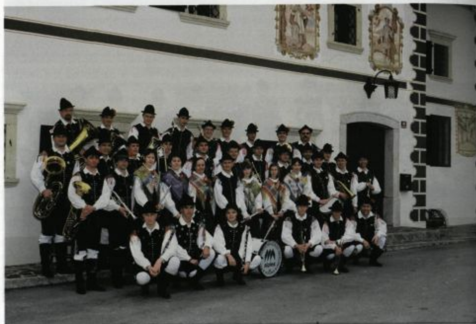
Ob 25. obletnici

Prvič se lahko pohvalimo, da je med nami kar 9 deklet. To je največje število, odkar obstaja orkester, saj so bile običajno med nami le dve ali tri godbenice. Vključno z blagajničarko in dirigentom v Orkestru deluje 49 članic in članov. V zadnjih letih se nam je pridružilo veliko mladih godbenikov, zato po starosti sodelujočih spadamo med mlajše pihalne orkestre v Sloveniji.