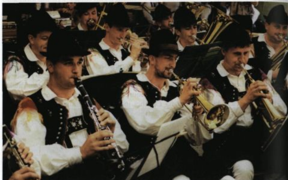
Na koncertu ob 20. obletnici.

Ob praznovanju 20. obletnice delovanja smo v Pihalnem orkestru Alples Železniki izpeljali dve prireditvi: koncert ter srečanje pihalnih orkestrrov. Na jubilejnim koncertu, 25. junija, v kinodvorani na Češnjici je bila tudi podelitev bronastih in srebrnih Gallusovih značk za dolgoletno delo v ljubiteljski glasbeni dejavnosti. Repertoar je bil v glavnem sestavljen iz skladb, ki so bile posnete na kaseti in zgoščenki, saj je bil koncert hkrati promocija našega novega izdelka. Praznovanje smo nadaljevali v nedeljo, 27. junija, s srečanjem pihalnih orkestrrov, ki je bilo pod šotorom pred plavžem v Železnikih. Srečanje, na katero smo povabili Godbo Gorje, Pihalni orkester Alpina Žiri in Pihalni orkester Svea Zagorje, se je začelo s povorko sodelujočih orkestrrov izpred blagovnice v Železnikih.