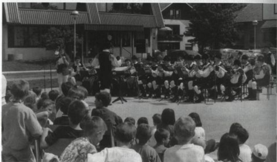
V Selcih za najmlajše.

Z Glasbeno šolo Škofja Loka smo se začeli dogovarjati, da bi v Železnikih pričeli s poučevanjem inštrumentov za potrebe pihalnega orkestra, posebej trobil, ki smo jih v orkestru najbolj potrebovali. V skupnem projektu širitve glasbene šole v Železnikih, bi Pihalni orkester pomagal pri pridobivanju učencev. V Osnovni šoli Železniki bi za učence organizirali koncert, jim predstavili orkester in inštrumente ter jih tako navdušili za vpis v glasbeno šolo in igranje v orkestru. Prvi tak koncert smo izvedli aprila 1997. Na avdicijo se je prijavilo 20 učencev in 5 izmed njih jih je začelo obiskovati glasbeno šolo, kasneje pa pričelo z igranjem v orkestru. S takšnimi predstavitvenimi koncerti še sedaj vsako leto pridobivamo učence dislocirane enote glasbene šole v Železnikih in nove godbenike.