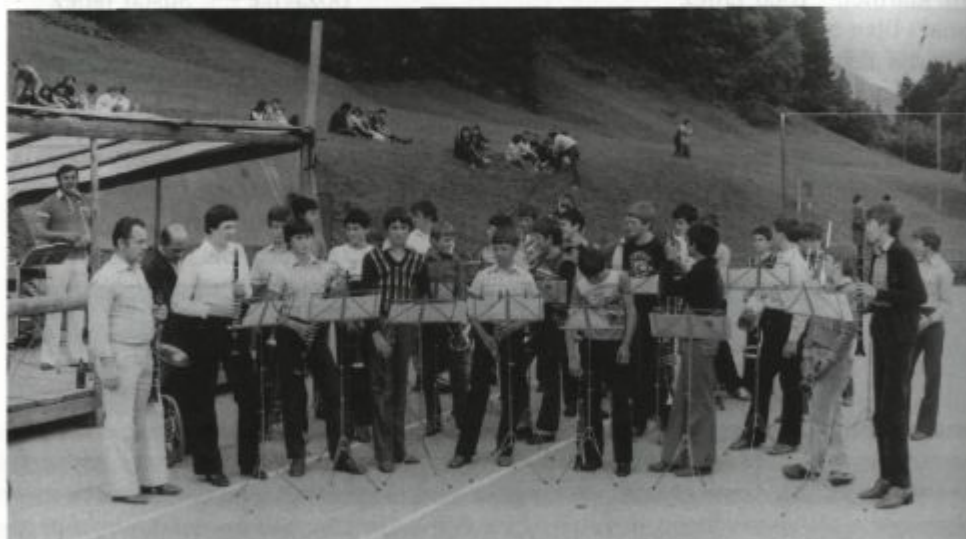
Ob otvoritvi Centra usmerjenega izobraževanja v Šk. Loki.

Ob otvoritvi Centra usmerjenega izobraževanja v Škofji Loki, septembra 1981, je orkester prvič nastopil v svojih uniformah. Nakup so omogočili podjetje Alples in starši godbenikov. Podjetje je kupilo kapo, mašno in jakno, ki je imela na levem rokavu velik znak podjetja Alples, starši pa hlače in srajce, oziroma krila in bluže. Kroj celotne obleke je bil oblikovan tako, da bi otroci hlače in srajce lahko nosili tudi na drugih prireditvah in proslavah. Za take obleke so se odločili, ker so otroci še rasli in bi bil zaradi prevelikega stroška nakup novih uniform vsaki dve leti nesmiseln.