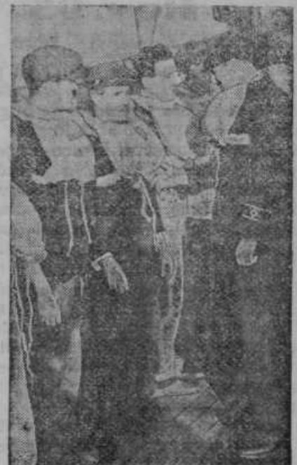
Vožnja po Atlantskem morju je zelo nevarna in igrajo rešilni pasovi najvažnejšo vlogo. Silka nam predočuje posadko parnika, ki se vadi v rabi rešilnih pasov

Vem, kaj je moje prvo opravilo: danes priloženo položnico bom takoj napisal in poslal 32 din za celoletno naročnino!