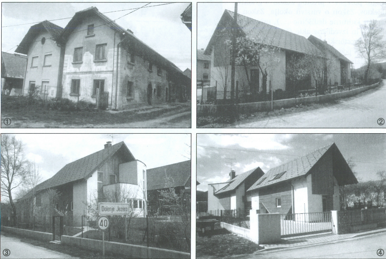
Slika 2: V načrtovan razvoj naselja Dolenje jezero na Notranjskem ① je v skladu z vsemi mednarodnimi usmeritvami vključeno tudi celovito varstvo stavbne dediščine, s katerim se obstoječ gradbeni fond s posegi varstva in prenove ohranja in obnavlja ter se funkcionalno, tehnično in likovno nadgrajuje (ponovno vzpostavljanje pretrgane kontinuitete v urbanem in stavbnem razvoju), novo pa se načrtuje tako, da se ugotovljene kakovostne, trajno uporabne vrednosti obstoječega dopolnjujejo z znanji in zahtevami sedanjosti. V skladu z opisanimi merili je oblikovana nova stanovanjska stavba na robu naselja ② ③ ④ (avtorja arhitekture sta arhitekta Stane Mikuž in Marko Mušič) in je v slovenskem prostoru redek primer kakovostnega arhitekturnega oblikovanja v sodobnem načrtovanju urbane in arhitekturnega razvoja manjših naselij.

Med najpomembnejša vrednostna izhodišča gotovo sodijo mednarodni dokumenti, izdelani na ravni Združenih narodov, Sveta Evro-