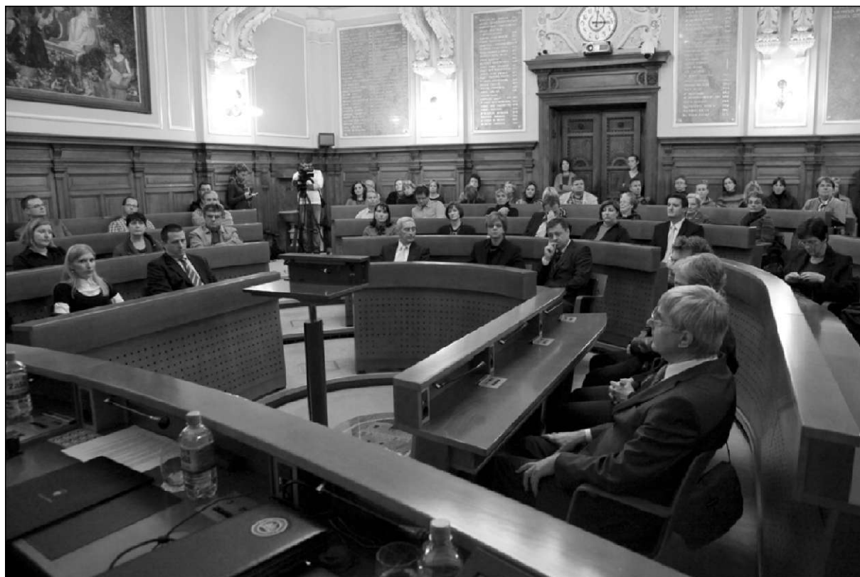
Podelitev Aškerčeve nagrade in Aškerčevih prigtanj