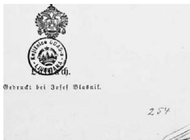
Prva stran Glavnega zdravstvenega poročila •-a leti 1861 in 1862.

t I. fütibije Smittec@bjmal-comutijfon uri Simit