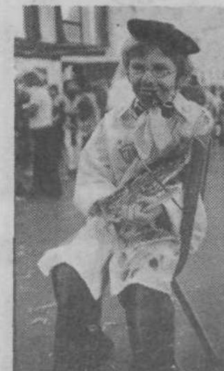
Tiha želja ali pustna burka