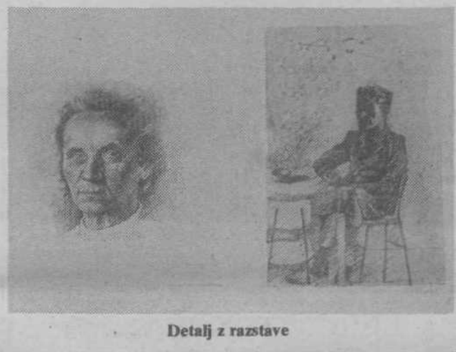
Detail iz razstave