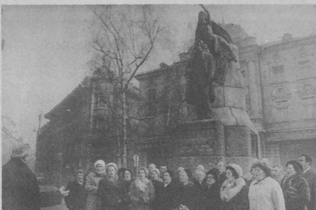
Mešani pevski zbor zveze društev upokojencev naše občine je po mnenju ljubljanskega novinarja letos reševal čast Ljubljane, ko je edini 8. februarja dopoldne zapel pred Prešernovim spomenikom pri Tromostovju v počastitev slovenskega kulturnega praznika in Prešerna samega. (Bila je pač nedelja in bile so počitnice!)