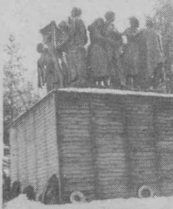
Pomnik na Urhu je dobro zavarovan pred zmrzaljo

Koledar Saturnus 1981, ki je bil izdan v okviru temeljnega samoupravnega sporazuma za svetlobno opremo, je na III. jugoslovanskem natečaju koledarjev Grafoimpex prejel prvo nagrado v skupini petih najboljših jugoslovanskih koledarjev za leto 1981, oziroma drugo mesto v generalni uvrstitvi med 170 koledarji, uvrščenimi v konkurenco. GS