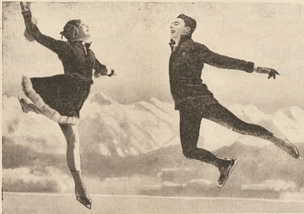
Svetovna prvaka v umetnem drsanju Henie Sonja in Karol Schäfer.