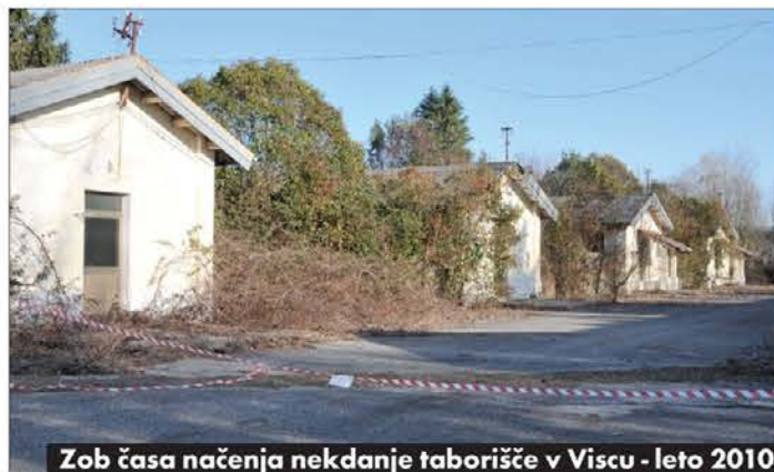
Zob časa načrtjena nekdanje taborišče v Viscu - leto 2010

vsaka sled prvotnega koncentracijskega taborišča, njegova strukturiranost, tipologija in cestni sistem. Skratka, nemogoče bi bilo iz novega območja razpoznati nekdanje taborišče. Žal bi se tako tudi razvednotil spomin na tragedije, ki ga je to območje doživelo.