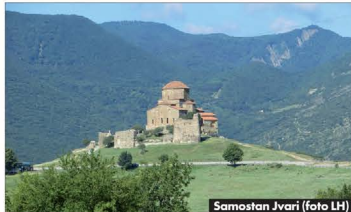
Samostan Jvari

Ob cesti raste veliko orehov. Orehe uporabljajo pri pripravi raznovrstnih jedi. Gruzija je znana tudi po raznovrstnih kakovostnih vinih in pivu. Pri jedi smo se prilagodili njihovi hrani, pri kateri uporabljajo raznovrstne začimbe in aromatične rastline. Imajo veliko paradiznikov, kumaric in buč ter druge zelenjave. Jutranji zajtrk je bil povsod evropski. Srečevali smo se z drugimi tu-