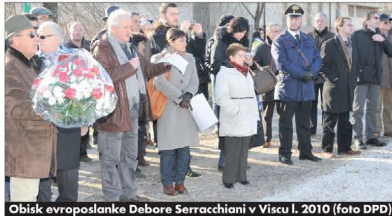
Obisk evropske poslanke Debore Serracchiani v Viscu l. 2010

2010 zavarovala 68 tisoč kvadratnih metrov (od 144 tisoč kvadratov, na katerih se je razprostiralo prvotno območje taborišča). Med razlogi za zavarovanje območja poročilo državne uprave navaja arhitektonske lastnosti zgradbe – upravnega sedeža nekdanjega taborišča in pred tem carine na italijansko-avstro-ogrski meji,