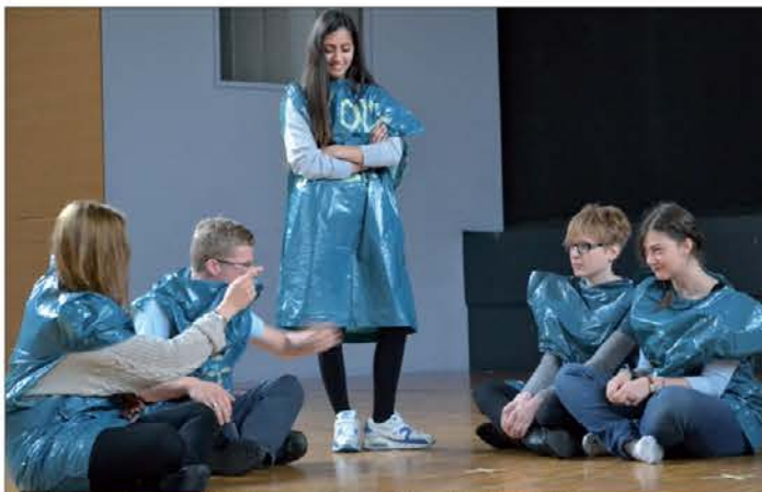
Mladi iz šestih evropskih držav so ustvarjali na gledaliških delavnicah.

Luksemburga, Švice, Finske, s Cipra in iz Češke. Namen tega srečanja je, da mladi različnih narodnosti razmišljajo o Evro-