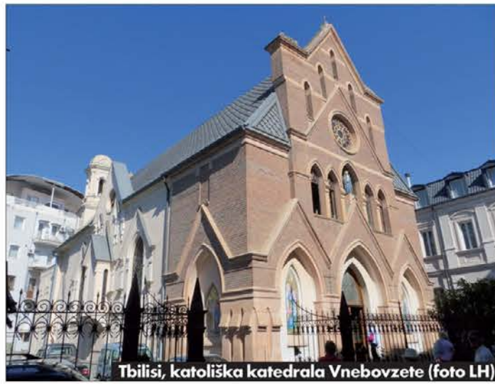
Tbilisi, katoliška katedrala Vnebovzete

stal kip Lenina, so leta 2006 postavili nov steber, na katerem kraljuje sv. Jurij, zavetnik mesta in Georgije. Nikjer nismo opazili znamenj ali obeležij prejšnje komunistične nadvlade, odpravili so vsa znamenja v muzeje. Država je