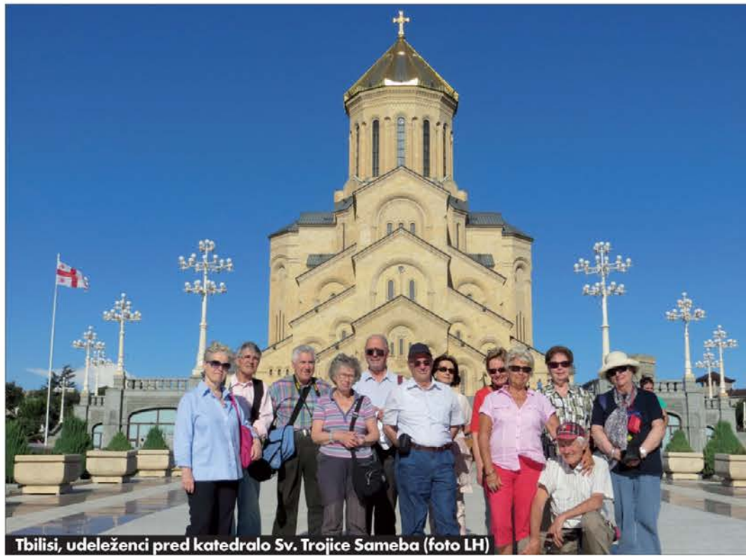
Tbilisi, udeleženci pred katedralo Sv. Trojice Sameba

zvirajo iz Kavkaza, na katerem so tudi večni ledeniki. Gruzinci ali kakor sami sebe imenujejo Sakartvelo, tj. ljudstvo Georgije, so začeli pisati