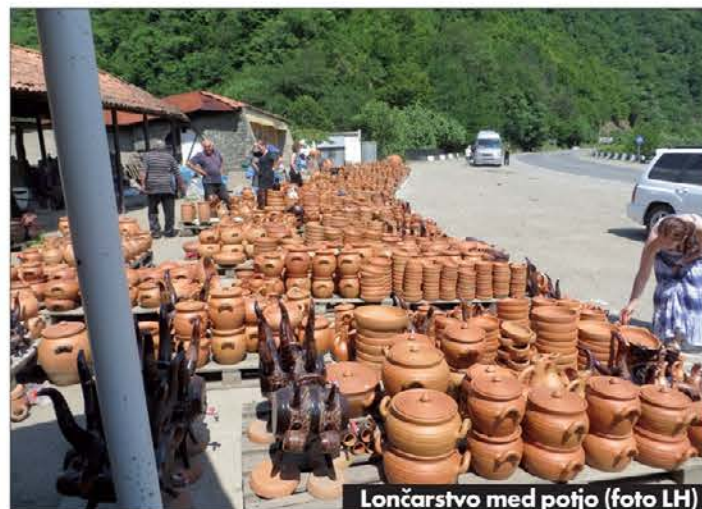
Lončarstvo med pojo

obnovila številne cerkve-samostane in daje vtis novega kulturnega življenja in pripadnosti h krščanski civilizaciji.