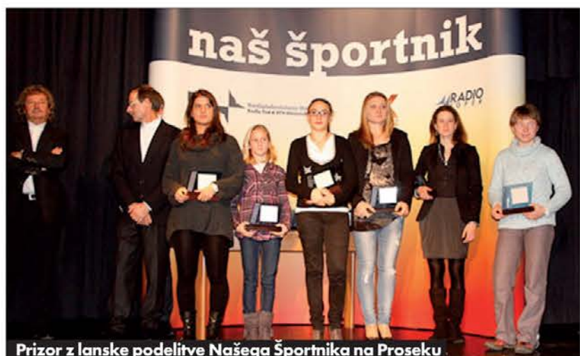
Prizor z lanske podelitve Našega športnika na Proseku

športnika leta na brezmejnem Primorskem. To so skupaj sklenili športni novinarji z obeh strani meje, predstavniki medijev, ki od leta 1983 uresničujemo podelitev z naslovom Naš športnik. To so Primorski dnevnik, novinarski in programski oddelek deželnega sedeža RAI za Furlanijo Juljsko krajino, spletni portal Slosport, Radio in TV Koper. Napredno odločitev je vzpodbudilo tudi Združenje slovenskih športnih društev v Italiji. Zaobjete kategorije bodo še naprej posamezniki, posameznice in ekipe. Za vsako od treh nagrad bo šest nomini-