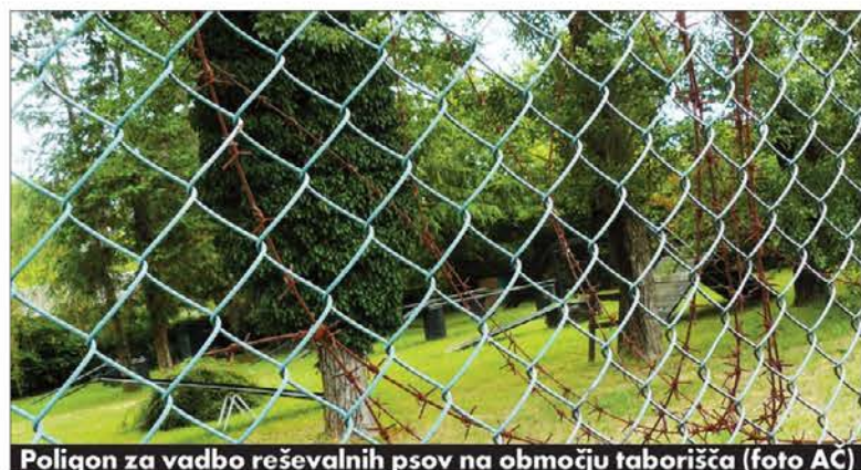
Poligon za vadbo reševalnih psov na območju taborišča

zadevanja za ohranitev fašističnega taborišča v Viscu: na to tematiko se je julija 2010 namreč odzval tudi predsednik italijan-