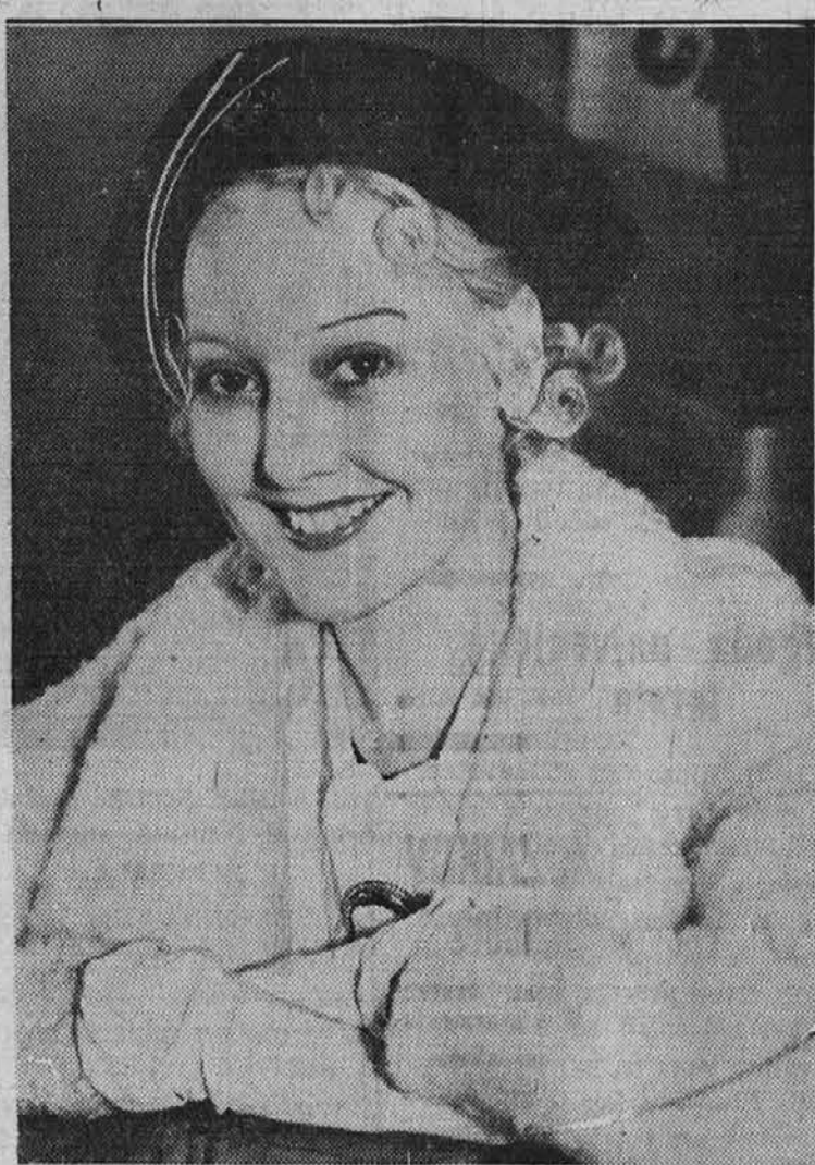
Filmska igralka Thelma Todd, ki so jo našli mrtvo v njenem avtu v ga raži.