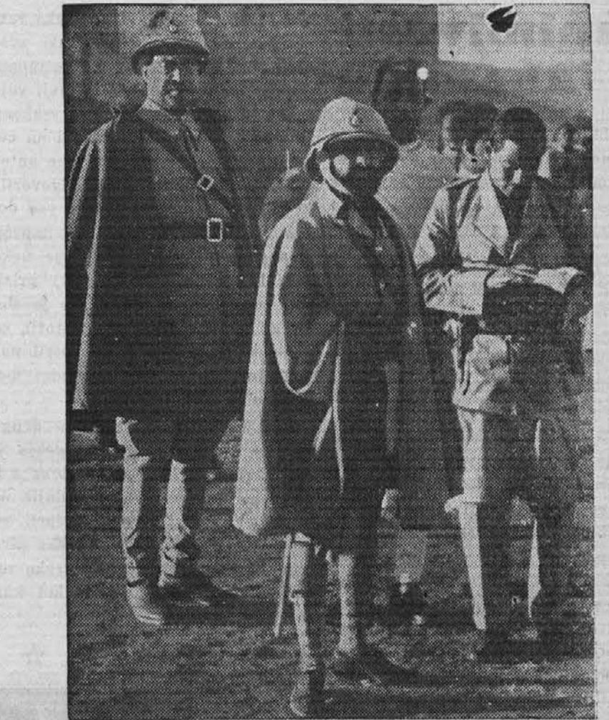
Abesinski cesar z nekaterimi poveljniki na fronti