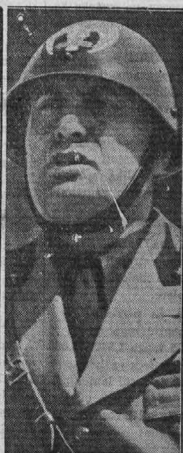
Osebe, o katerih se največ govori in piše v zvezi z italijansko-abesinsko vojno: Mussolini, ki je sprožil klanje — cesar Haile Selassie, ki brani neodvisnost svoje dežele — Eden in Laval, ki imata največ besede v Ženevi.

Radi tega je general Graziani sklenil napasti vojsko rase Deste ter jo prisiliti, da se umakne od mesta Dola, ki se nahaja prav blizu Italijanske Somalije. Preskrbel si je ojačenja ter je z veliko skrbnostjo pripravil ofenzivo, ki se je začela 12 t. m. v ranih jutranjih urah. S