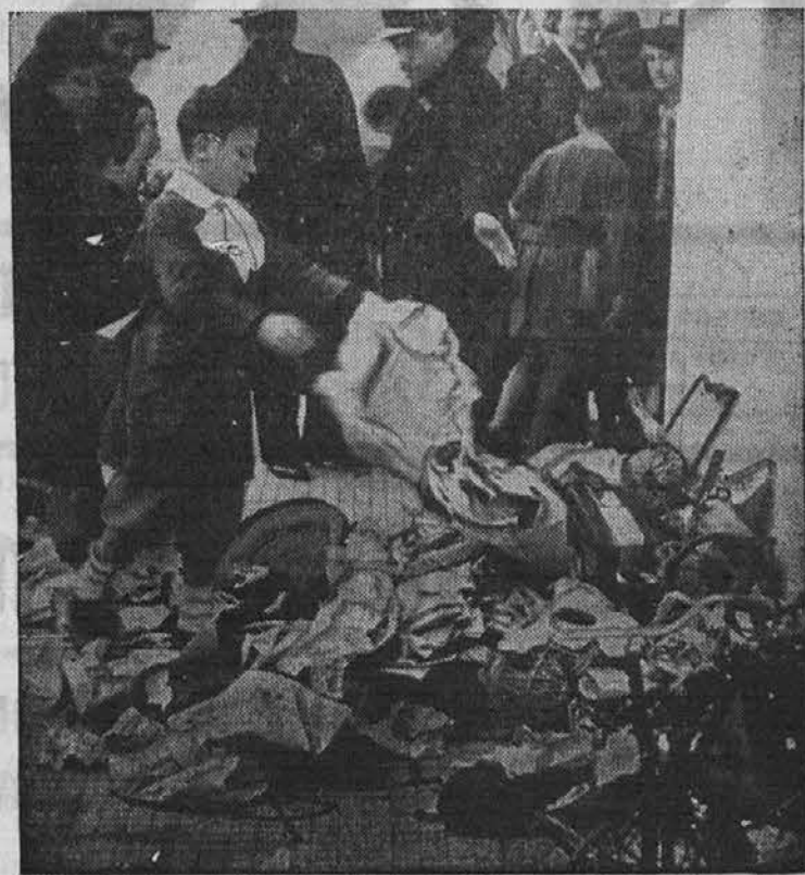
Italijanski otroci morajo s svojimi igračkami prispevati pri zbiranju starega železa