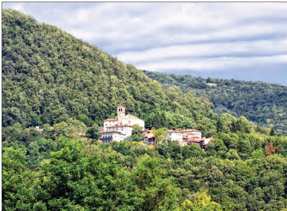
Sl. 1: Landar / Antro. Nadiške doline, Beneška ali Furlanska Slovenija.

običajem sporazume glede njegovih pravic in pravnine oziroma odškodnine ( de iure et guadia suis ), med rodbinama pa zaradi tega primera ne sme prihajati do žalitev, kar pomeni, da naj med njima v prihodnje vlada mir. V kolikor bi katerakoli stran ali njihovi sorodniki v bodoče kršili ta mir, bi bili kaznovani s plačilom kazni v višini 50 zlatih dukatov, polovica kazni bi pripadala Landarskemu gastaldu, polovica pa oglejskemu patriarhu.