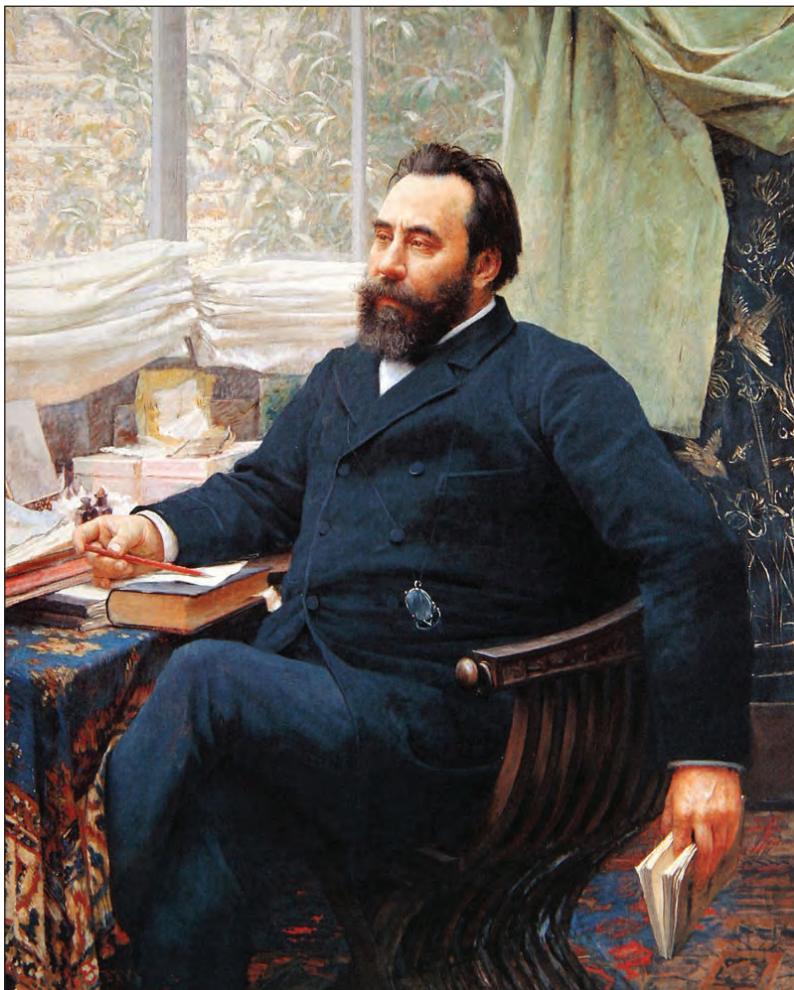
Sl. 14: Valtazar Bogišić (1834–1908) (Vlaho Bukovac, 1892: Wikimedia Commons).

(Sommières, 1820, 342), ki je ugotovil škodo na obeh straneh. Natančnega števila žrtev in ranjenih v tem sporu dokument ne navede, pojasni pa splošne značilnosti, ki smo jih že omenili, ter dodaja podatek, da je bila odškodnina za poglavarja ali duhovnika sedemkratna. Ko so poravnali medsebojne poškodbe in drugo škodo ( prebijanje ), je morala tista stran, ki je povzročila večjo škodo, npr. ubila enega človeka več, zanj plačati odškodnino. Sommières še pojasni, da se je njihov običaj ocenjevanja škode in določanja odškodnine izoblikoval že v zelo davnih časih ( un temps immémorial ) (Sommières, 1820, 344).