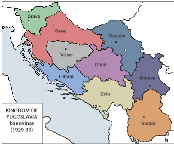
Fig. 1: Map of the subdivision of the Kingdom of Yugoslavia after 1929 and until 1939 47

The official Tourist Bureau of the Kingdom of Yugoslavia estimated that 90 % of the tourists from the Czechoslovak Republic only visited the Adriatic coast, with a number of them using the road through Bosnia on their way back, which they found attractive because of its oriental heritage. 46