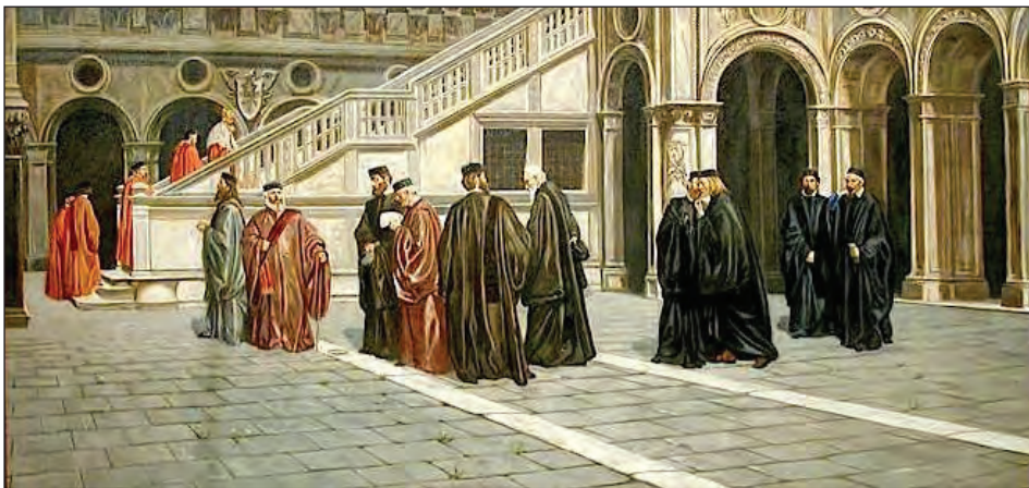
Sl. 9: Beneški Svet deseterice, t. i. Strašnih deset ( http://resetvnezia.it/2014/03/25/10-principi-per-una-buona-politica/ ).

vem prizadevanju po centralizaciji sodne oblasti v Republiki temeljno oviro predstavljala zlasti razvita mesta t. i. Terraferme , ozemlja, ki ga je Serenissima v pridobila leta 1420 po zlomu posvetne moči oglejskih patriarhov. Mesta kot Vicenza, Brescia, Treviso, Verona, Udine idr. so s svojimi statuti vztrajno branila avtonomijo in običaje, med temi predvsem sistem reševanja sporov (prim. Muir, 1998). Beneška republika običajno zakonodajno ni prepovedovala, temveč je svojo taktiko centralizacije pravosodja v državi postopoma uresničevala s prevzemanjem obrednih obrazcev maščevanja. Na prvem mestu je bil to izgon, nato pa tudi sklepanje premirja in miru, ki sta morala biti sklenjena vpricho beneških centralnih pravosodnih organov, zlasti Sveta deseterice, Štirideseterice za kriminal ( Quarantia criminal ) in Komunskih advokatov ( Avvogadori del Comun ) 34 ali njihovih pooblaščenecv, t.j. predvsem prek podestatov posameznih lokalnih skupnosti, ki so jih imenovali v beneškem Velikem svetu izmed svojih članov.