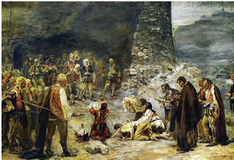
Sl. 12: Paja Jovanović: Umir krvi , 1899. Črna gora.

izluščimo iz virov in literature, je obred običajnega reševanja konfliktov potekal po naslednjih postopkih.