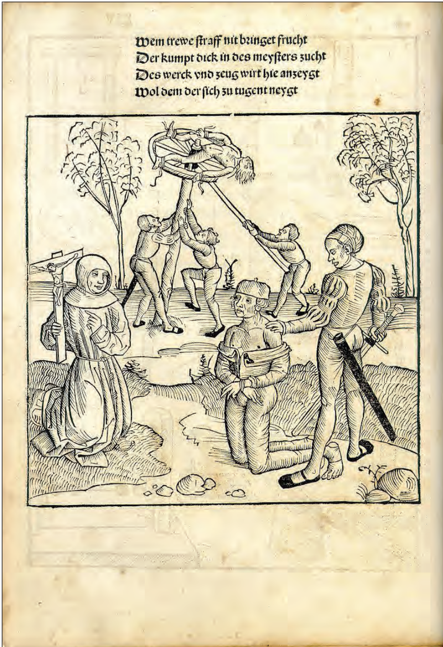
Sl. 4: Izvršitev smrtne kazni z mečem in kolesom ( Constitutio Criminalis Bambergensis , print: 1580)