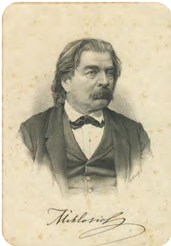
Sl. 13: Portret Franca Miklošiča (1813–1891) ( http://museums.si/sl/collection/object/233236/franc-miklosic ).

izpostavljale v ponižanju, kot kaže Jovanovičeva slika, temveč so tudi aktivno posegale v razreševanje konfliktov. Bogišičevi intervjuvanci nazorno opišejo primere, ko užaljena stran po več poskusih ni želela sprejeti priprošnjikov. Tedaj so se organizirali tako, da je na nek način v hišo užaljenega uspela priti ženska, ki se je nato samovoljno zategnila med verigo okoli ognjišča. Užaljeni bi jo v tem primeru moral iztrgati z verige, kar pomeni, da bi moral delati silo ženski, kar pa ni bilo častno. Zato jo je užaljeni moral sprejeti v hiši, kar je pomenilo, da je pristal na kompromis in začetek pogajanj (Bogišič, 1999, 365).