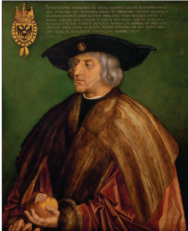
Sl. 1: Albrecht Dürer, Portret Maksimilijana I., 1519 (Umetnostnozgodovinski muzej Dunaj: Google Art Project.jpg)