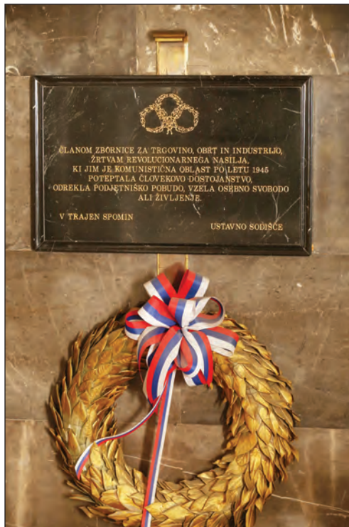
Sl. 1: Spominska plošča v prostorih Ustavnega sodišča

Članom zbornice za trgovino, obrt in industrijo, žrtvam revolucionarnega nasilja, ki jim je komunistična oblast po letu 1945 poteptala človekovo dostojanstvo, odrekla podjetniško pobudo, vzela osebno svobodo ali življenje – v trajen spomin – Ustavno sodišče.