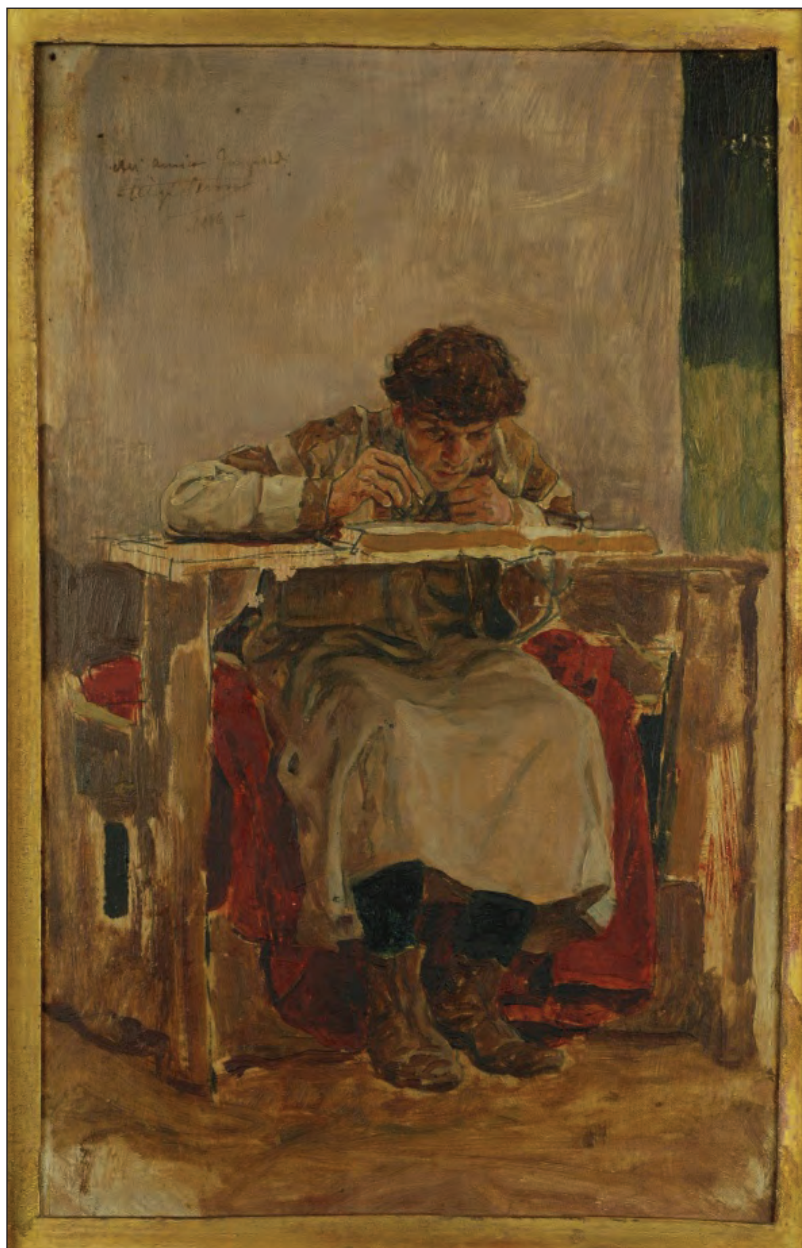
Sl. 6: Irnerij (1060–1130), velja za prvega glosatorja. ( Irnerio che glossa le antiche leggi , bozzetto di Luigi Serra, 1886, Collezione Stefano Pezzoli, Bologna) (Wikimedia Commons).