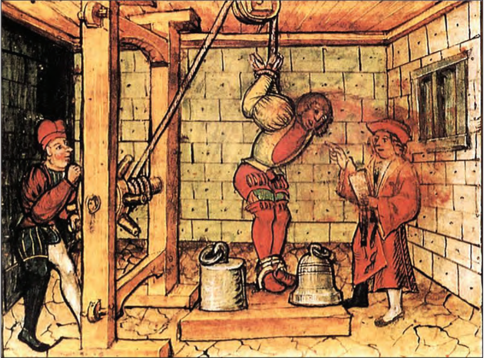
Sl. 3: Natezalnica, Lucernska kronika , Diebold Schilling ml., 1513, f. 216

prijetje. Svet je pretehtal argumente in z večinskim mnenjem odločil ali in kako naj se postopek nadaljuje. Sodniku je bilo izrecno prepovedano, da bi o osumljenčevi usodi odločal sam (MS, f. 2v). Sklepamo lahko, da so v tej fazi postopka razpravljali o pomembnem predhodnem vprašanju, ali naj se določeno dejanje sploh kvalificira kot težko kaznivo dejanje ( Malefiz ), ki se bo obravnavalo v posebnem, »krvosodnem« procesu ( malefizisch, peinlich ). Na to kažejo tudi zapisniki sej mestnega sveta. 12 Celoten postopek se je praviloma odvijal »za zaprtimi vrati«, kar je pomenilo, da je bil proces tajen. Javne obravnave so bili deležni le primeri napada na čast, vendar so tudi tu sodbo sestavili brez prisotnosti javnosti in jo nato objavili (MS, f. 2 in 2v).