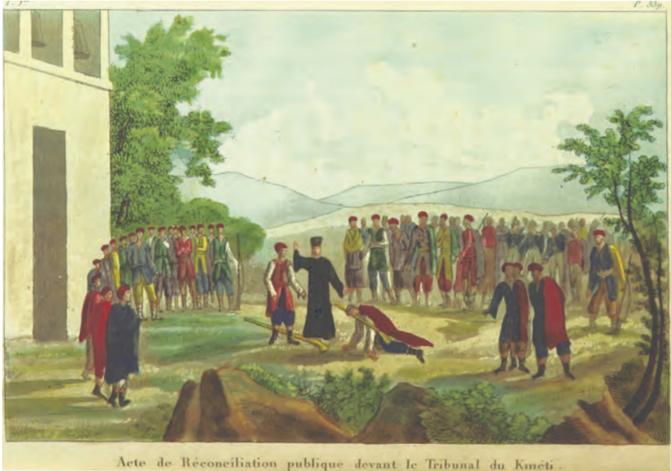
Sl. 15: Zaključna svečanost pomiritve v ritualu krvnega maščevanja v Črni gori (Sommières, 1820, 338).

Po odhodu iz cerkve so se mašniki razporedili v polkrogu v dve skupini, kmeti so stali ločeno od množice. Usmerjal jih je duhovnik (pop), ki je stal sredi prizorišča. Nato se je storilec počasi začel približevati nasprotni skupini, bos in razoglav, plazeč se po vseh štirih. Okoli vratu je imel obešeno dolgo puško. 47 Najprej je nastopila velika tišina, nato je posredoval pop, ki je sodišču pojasnil, da je storilec sprejel njihovo odločitev in se obrnil do užaljenega ter ga vprašal, če se odpove maščevanju in neprijateljstvu. »Užaljeni je bil razburjen, solze so mu polzele po licih, zamislil se je, pogledal v nebo, zavzdihnil, še vedno okleval, njegovo dušo, se zdi, je preplavilo tisoč različnih čustev.« Vsi prisotni so ga začeli nagovarjati in prositi, naj sprejme pomiritev, toda on je odgovoril, da še ni povsem pripravljen. Storilec je bil ves ta čas v poniževalnem klečečem položaju na vseh štirih.