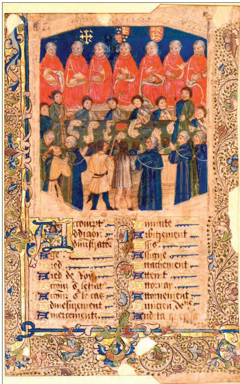
Sl. 4: Angleško Sodišče (Court of Common Pleas, oziroma Common Bench iz konca 12. stoletja) pri delu. Slika iz srede 15. stoletja prikazuje plemiče in stranke, ki stojijo pred sedmimi sodniki, pod njimi so njihovi uradniki.