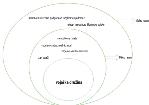
Shema 2: PODPORA VOJAŠKIM DRUŽINAM NA RAZLIČNIH SOCIO-EKOLOŠKIH RAVNEH

vrsti je to zahtevalo nove prilagoditve skrbstvenih razmerij tako znotraj družine kot zunaj nje.