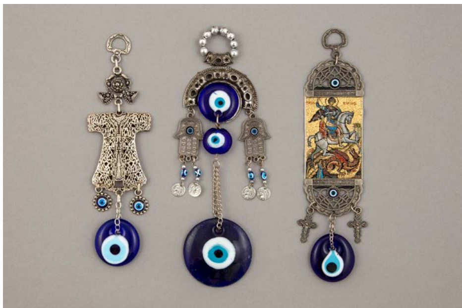
Stekleni amuleti z različnimi simboli: Mohamedov plašč, dlan, polmesec, križ in sv. Jurij; zbirka SEM

Stekleni amuleti predstavljajo moč pogleda in zaščito v obliki očesa pred zlimi silami, kar je tradicija, ki je že tisočletja stalnica v mnogih kulturah, predvsem na področju Sredozemlja. Oči božanstva so absolutna moč nadzora, ki varuje in uničuje, oči človeka pa so pot do njegove duše. Ko dušo dobi v last hudobni duh, se začnejo v očeh odsevati zlobni nameni škodoželjnosti in nevoščljivosti. Pogled, ki ga ustvarja nevidna demonska sila, je za posameznika lahko usoden. Zato je človek že davno spoznal, da se zlo ubija z zlom, in uničujoči učinek hudobnega očesa premagal z magičnim očesom. Najdbe s simboliko očesa so znane že v prazgodovinskih kulturah, kjer so človeške figurice, imenovane idoli, upodabljali z neproporcionalno velikimi očmi – včasih so bile te edini element obraza (Caubet 2018: 22; Koç in Temür 2014: 16). Oko je pogost motiv tudi v mezopotamskih kulturah (Thomsen 1992; Kotansky 2019: 510), mitologija o zdravilnih in magičnih močeh očesa pa se je razvila predvsem v starem Egiptu.