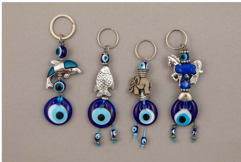
Stekleni amuleti z živalskimi simboli; zbirka SEM

sončno oko je bilo povezano s sončnim božanstvom Rajem, medtem ko je levo ali lunino oko pripadalo bogu v podobi sokola, Horu (Pinch 1994: 109–110). Kar nekaj egipčanskih mitov priča o magičnih močeh oči. Med najbolj znanimi je zgodba o dolgoletnem boju med bogom Horom in njegovim stricem Setom. Hor je želel maščevati smrt svojega očeta Ozirisa, hkrati pa se je proti stricu boril za moč na zemlji in vladavino nad Egiptom. V eni izmed njunih bitk je Set ranil Hora in mu poškodoval levo oko. Na pomoč sokoljemu božanstvu je prišel bog zdravilstva in magije Tot, ki je oskrbel njegovo oko in mu podaril magično moč. Hor je s pomočjo ozdravljenega očesa ponovno obudil in zlil v celoto telo svojega pokojnega očeta. Oziris je ponovno oživel in se odpravil v podzemlje, kjer je postal vladar onostranstva (Pinch 1994: 27).