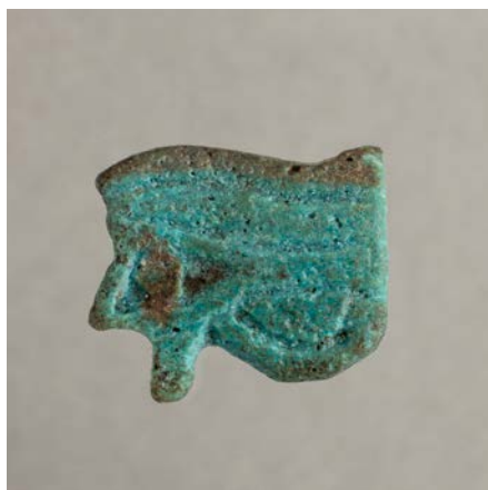
Egipčanski amulet magičnega očesa je izdelan iz fajanse; pozno obdobje, 664–332 pr. Kr.; zbirka SEM