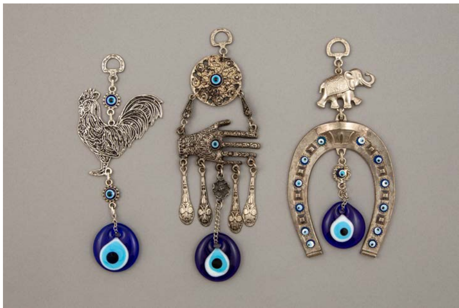
Med različnimi simboli je zelo zanimiva kombinacija slona in konjske podkve; zbirka SEM (foto: Blaž Verbič, 2020)