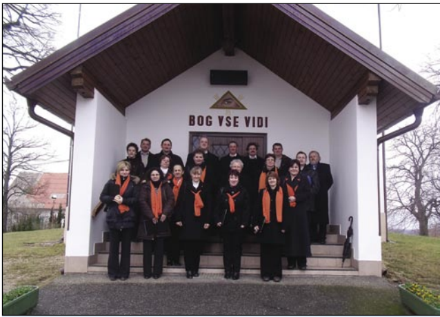
Mešani pevski zbor ZSM Avgust Pavel