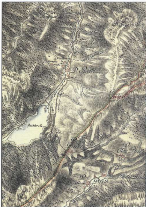
Slika 3: Pomanjšani izsek jožefinskega zemljevida (6), ki prikazuje območje vzhodno od Rabeljskega jezera blizu meje med nekdanjimi deželami Koroško, Kranjsko in Goriško.

jem in Štajersko ter Kranjsko in Štajersko je bila dokaj naravna, saj je potekala po rekah (Mura in Sava) in razvodnicah, podobno tudi meja med Kranjsko in zgornjim delom Goriške, za preostale deželne meje pa je to veljalo le na posameznih odsekih (2). Meje nekdanjih dežel še vedno potekajo večinoma po mejah današnjih katastrskih občin, ker so se te v zadnjem stoletju zelo malo spremenile.