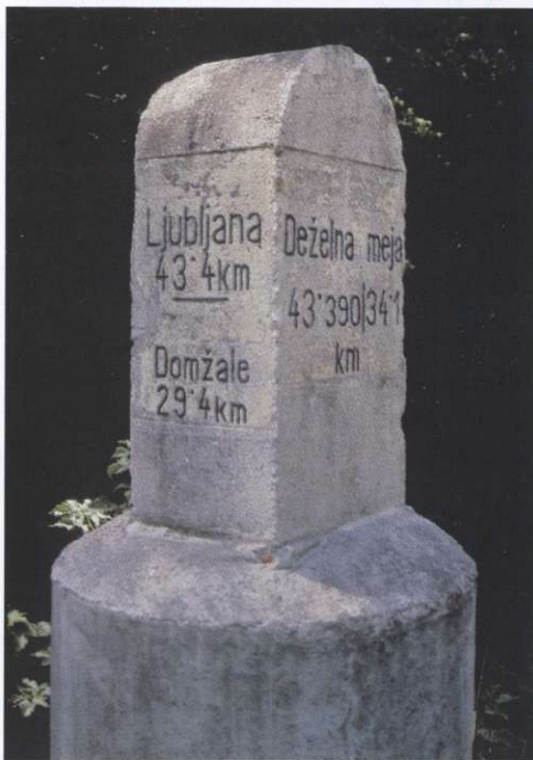
Slika 4: Mejni kamen med nekdanjima deželama Kranjsko in Štajersko pod Trojanami v Zajasovniku ob Bolski.

Na zemljevidu so znotraj Kranjske označene meje med njenimi sestavnimi deli, Gorenjsko, Dolenjsko in Notranjsko, čeprav ta delitev, ki je med ljudmi zelo živa, nima nikakršne zveze z upravo razdelitvijo Kranjske na začetku 20. stoletja, ko se je delila na 11 okrajnih glavarstev in mesto Ljubljana. Pri določitvi meja znotraj Kranjske smo se oprli predvsem na Valvasorjeve zemljevide (8), meje med župnijami (4) in meje med avstrijskimi občinami z začetka stoletja (7).