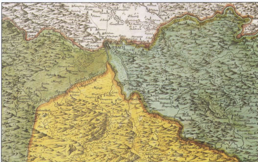
Slika 2: Pomajšani izsek Horografskega zemljevida Vojvodine Kranjske (Janez Dizma Florjančič, 1744), ki prikazuje območje Ljubljane, kjer se stikale Gorenjska, Notranjska, Sredinska in Dolenjska.