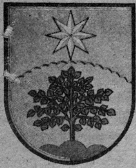
REČICA OB SAVINJI