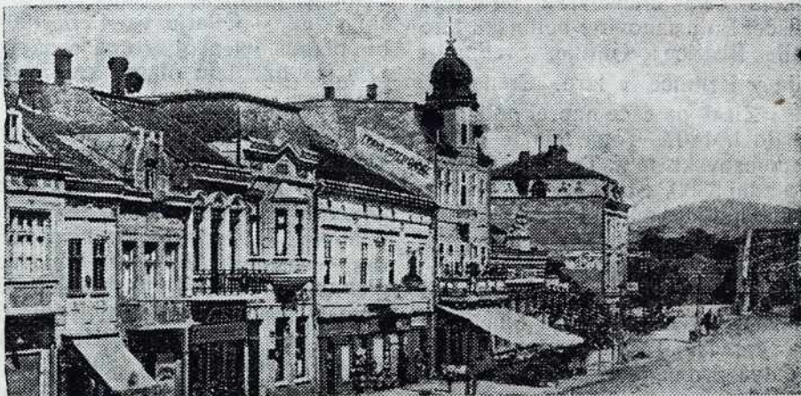
Trg krala Milana v Niši. Mnogi bivši vojaki ga spoznajo.

Kralica Marija se müdi ob Jadranskom morji v kraji Novi. Z njov so tüdi Nj. Vis. prestolonaslednik Peter i králeviča Tomislav i Andrej.