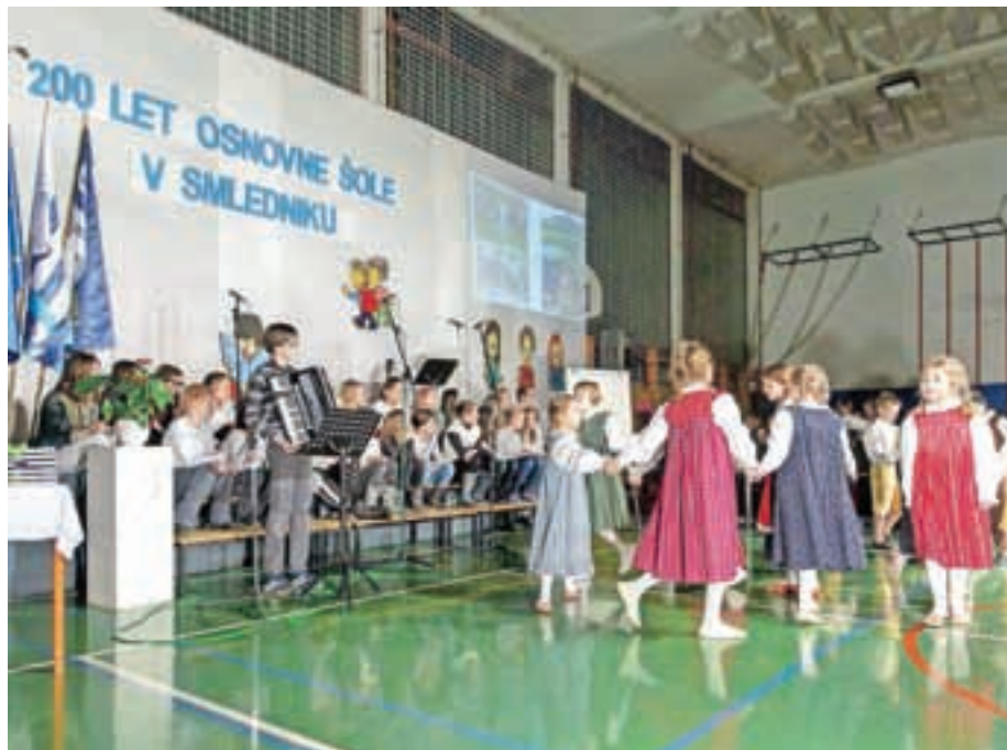
Slovesnost so s kulturnim programom obogatili učenci šole.