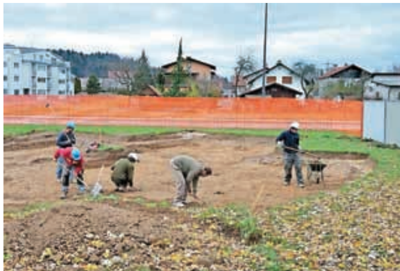
Raziskave so potekale vzhodno in severno ob Vrtcu Medvode.

”V zadnjem desetletju je bila namreč na širokem prostoru Svetja, med krožiščem glavne ceste Medvode-Kranj na vzhodu in Zdravstvenim domom na zahodu odkrita prazgodovinska naselbina iz obdobja srednje in pozne bronaste dobe (1600–1000 pr. n. št.). S testnim pregledom celotnega območja in raziskavami z gradnjo prizadetih lokacij smo pričakovano odkrili sledove prazgodovinske poselitve, ki smo jih po primarni obdelavi odkritih najdb prisodili istemu časovnemu in prostorskemu kontekstu. Odkrili smo kar nekaj zanimivih ostalin. Najbolje ohranjena sta bila dela kamnitega tlakovanja, pri katerem gre za utrjeno dvorišče ali pot. Neposredno ob tlakovani površini smo odkrili jame za vertikalne lesene gradbene elemente – sohe, ki predstavljajo dele nekdanjega lesenega objekta. Naselbinski značaj odkritih ostalin lepo zaokrožita dve večji jami s številnimi odlomki prazgodovinske lončenine, ki so večinoma pripadali velikim shranjevalnim posodam oziroma pitosom. Številne najdbe lončenine in lepo ohranjen vijček (predilno vretence) ter odkrite strukture kažejo na naselbinski značaj najdišča in jih lahko v celoti navežemo na leta 2007 raziskano naselbino na prostoru današnjih večstanovanjskih objektov proti vzhodu. Tudi takrat so arheološke raziskave na mnogo večji površini razkrile več lesenih objektov, grajenih v stojkasti tehniki, s tlakovanji, ognjišči, odpadnimi jamami in številnimi najdbami,” pravijo v Skupini STIK. Raziskave v sklopu predstavitve daljnovo-