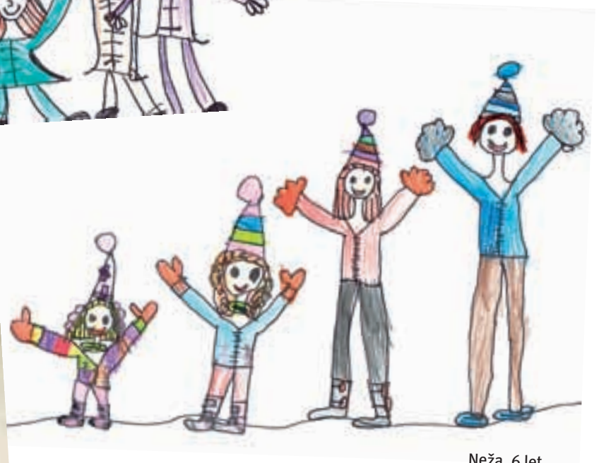
Neža, 6 let