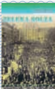
knjiga Zelena solza