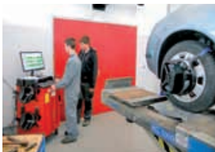
AVTOREMONTNE DEJAVNOSTI avtoserviser, avtokaroserist, avtoservisni tehnik (pti)