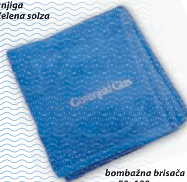
bombažna brisača 50x100 cm

Popust in darilo veljata le za fizične osebe. Daril ne pošiljamo po pošti. Količina daril je omejena.