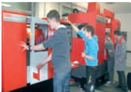
STROJNIŠTVA oblikovalec kovin-orođjar, inštalater strojnih inštalacij, pomočnik v tehnoloških procesih, strojni tehnik in strojni tehnik (pti)

Starši so danes zelo obremenjeni, na eni strani z ohranitvijo lastne zaposlitve, na drugi strani pa s prihodnostjo svojih otrok. Vsi si želimo, da bi bili naši otroci uspešni, zadovoljni, da bi dosegli čim višjo stopnjo izobrazbe in bili s tem dobro materialno preskrbljeni. Tisti, ki bolj sledimo tokovom izobraževanja in zaposlovanja, vidimo, da danes to ne drži več, saj je brez zaposlitve vse več akademsko izobraženih mladih ljudi, ki so v študij vložili ogromno časa in truda, po drugi strani pa primanjkuje ljudi s poklicnimi znanji in sposobnostmi, od katerih je odvisno naše vsakodnevno življenje. To so poklici, ki bodo že jutri našim otrokom zagotavljali zaposlitev, dober življenjski standard in spoštovanje. Starši imamo svoje ambicije, ki smo jih uresničili, ali pa ne. Otroci imajo svoje ambicije in starši bi jim morali dovoliti, da jih uresničijo, jih spodbujati pri njihovih poklicnih odločitvah in jim trdno stati ob strani, četudi bodo morda včasih drugačne od njihovih. Dejstvo je, da je vsak posameznik sposoben velikih dosežkov, le odkriti mora, na katerem področju je najmočnejši. Izbira prave srednje šole je torej odločilnega pomena za prihodnost vsakega učenca. V Šolskem centru Škofja Loka edini na Gorenjskem izobražujemo za deficitarne poklice s področij: