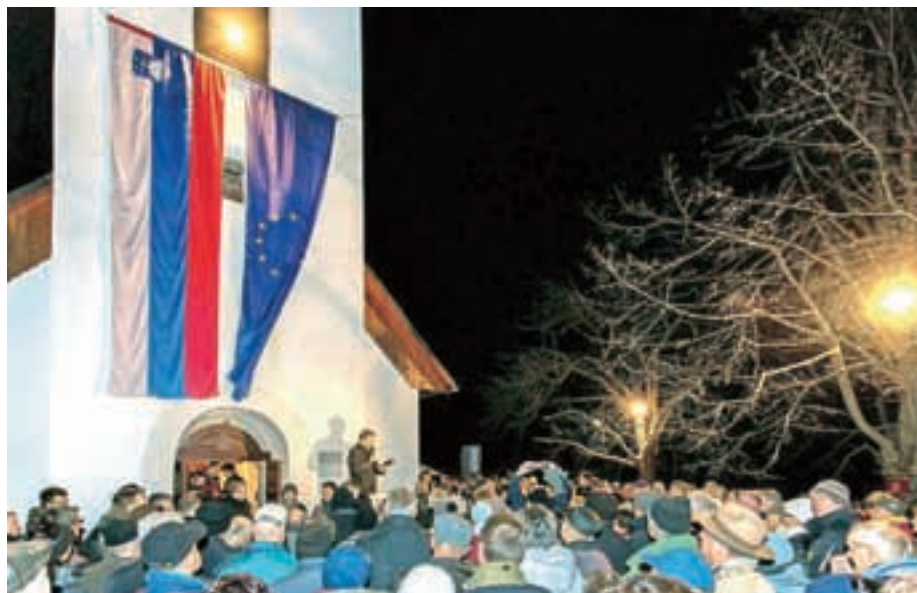
Mnogi so dan samostojnosti in enotnosti praznovali na Sv. Jakobu.

predstavniki javnega, kulturnega, političnega in cerkvenega življenja. "Takrat smo bili v nekem velikem pričakovanju, verjetno tudi prepričani, da bo vse samo dobro in teklo brez težav. Sedaj gledamo morda malce bolj racionalno. Tudi petindvajset let smo starejši. Še vedno pa gledamo na to z enakim ponosom in veseljem, da smo se takrat odločili, kot smo se. Tudi danes se tukaj čuti ta ponos, srčnost, veselje do naše domovine. Ta dan je vedno lepo biti tukaj, ne gle-