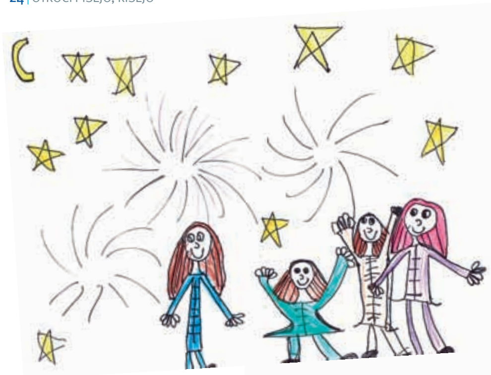
Dora, 6 let