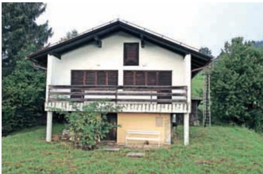
Objekt na Topolu, ki bi ga preuredili v Hišo Blagajana.