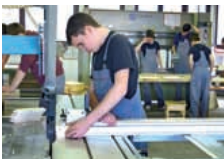
LESARSTVA mizar, tapetnik, lesarski tehnik, lesarski tehnik (pti), obdelovalec lesa