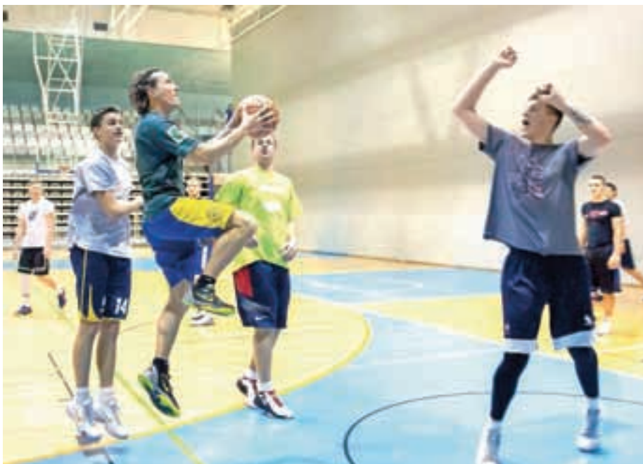
Članska ekipa KK Medvode se pripravlja na zadnje tekme prvega dela tekmovanja.

Medvoški košarkarji so na lestvici po desetih krogih v 3. ligi center na drugem mestu. Sedemkrat so zmagali, vknjižili en poraz, dva kroga so bili prosti. Vodilna ekipa Union Olimpija mladi ima devet zmag in je brez poraza. V ligi je sedem ekip. Ker je zadnje uvrščena Metlika izstopila iz lige, imajo zagotovljeno še zmago več. K njim bi morali iti na gostovanje v naslednjem krogu. Pred njimi so tako le še tri tekme prvega dela tekmovanja. 24. januarja bodo doma igrali z Enos Jesenicami, 30. januarja imajo pomembno tekmo pri Olimpiji mladi, v zadnjem krogu pa bodo 3. februarja igrali doma proti Calcit Basketballu. "Ne glede na to, da smo najmanj drugi, pa tekma z Olimpijo mladi ni nepomembna. V nadaljnje tekmovanje za napredovanje v drugo ligo gresta dve ekipi tako iz tretje lige center, vzhod kot zahod. Pomerili se bomo z vsemi, le z Olimpijo ne več. Oni v nadaljevanje že ne-sejo eno zmago, ki so jo dosegli proti nam,