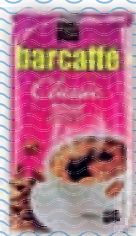
kava Barcaffe 250 g