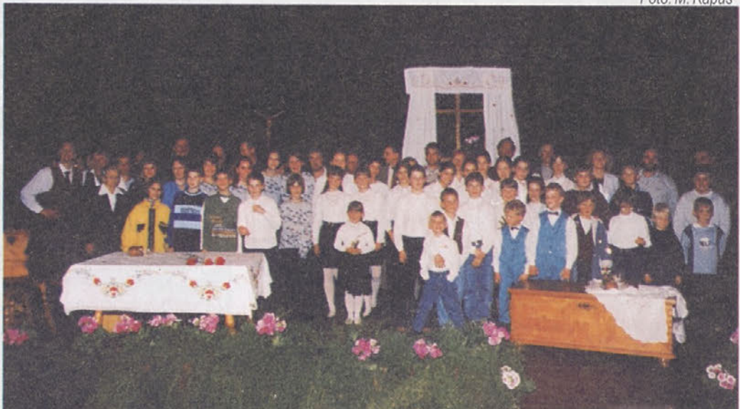
Skupinska slika nastopajočih v nedeljskem delu prireditve