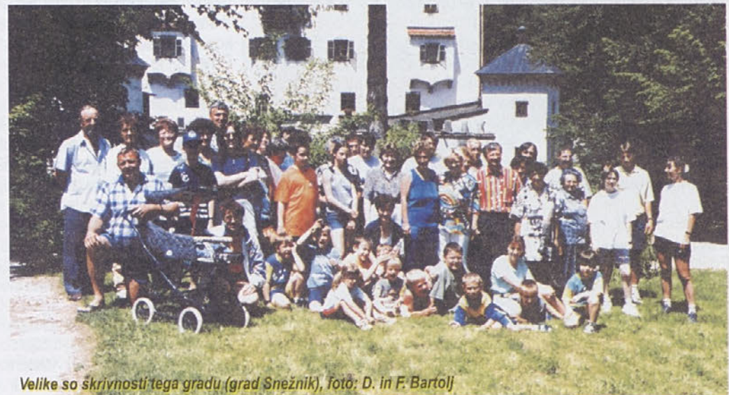
Velike so skrivnosti tega gradu (grad Snežnik)

In že je tu eden najlepših praznikov, velika noč. Na velikonočno nedeljo popoldan se zberemo pri vaški kapelici in tekmovalje v sekanju pirhov se prične. Ker