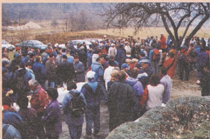
Preko 200 pohodnikov, ki so uživali v lepi naravi in gostoljubnosti vinogradnikov, se je udeležilo Valentinovega pohoda.