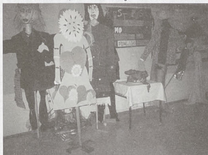
Pust nas je navdušil za izdelavo mask.

Letos smo učenci OŠ izdelovanja plakatov ... do Trebnje počastili slovenski kulturni praznik na učenja starih plesov in še drugih zanimivih delavnic. Iz