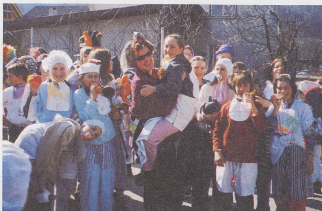
PUSTNE MAŠKARADE sredi Trebnjega, pustna mama in njeni številni otročki.