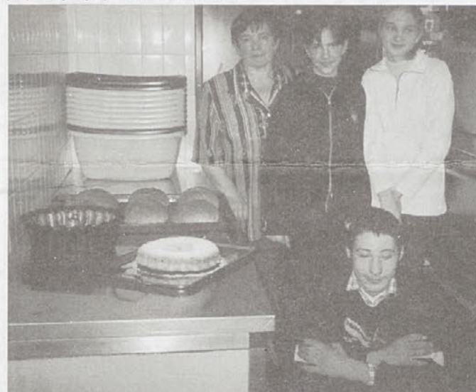
V kuharski delavnici je prijetno dišalo.