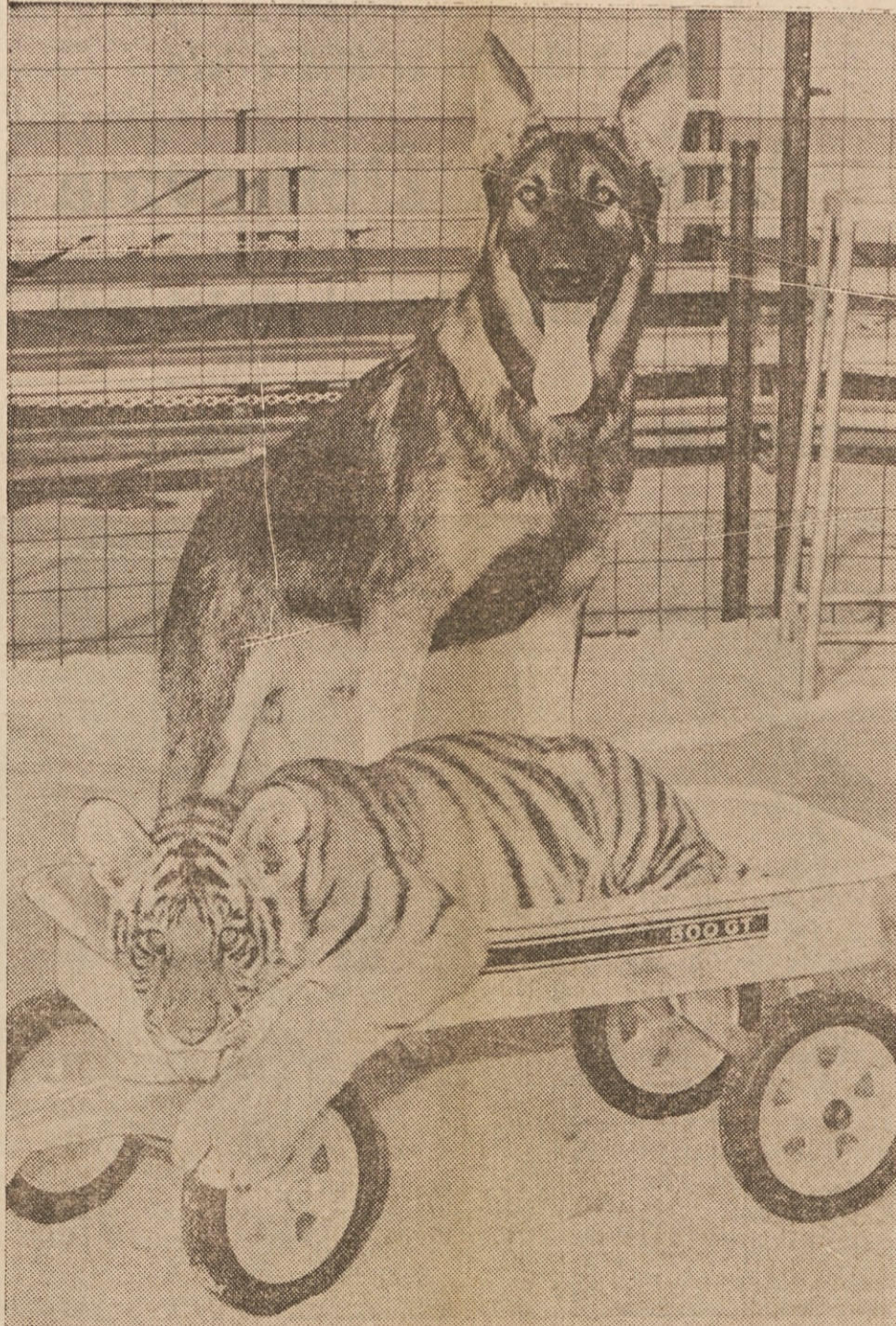
PRIJATELJA — Psi in mačke se ne gledajo radi, vsaj običajno ne, toda tale 5 mesecev star tigrč Bombat se prav dobro razume z nemškim ovčarjem Zekejem, ki stoji za njim na sliki. Zvirita skupaj, odkar je bil Bombat star par tednov. Slika je bila posneta v Japanske Village v Buena Parku v Kaliforniji.

Četrtno za hrano Povprečna ameriška družina porabi okoli eno četrtno celotnega dohodka za nakup hrane.