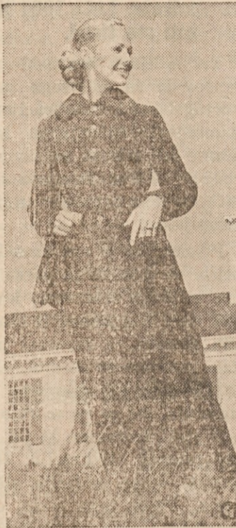
REGAL—Plush cotton corduroy in the widest of wales sweeps into a long coat for the upcoming holiday season. In cranberry red, it's embellished with a long stretch of silvery buttons. By Lanz.

Elect this experienced, trained, qualified man to represent YOU in the 22nd DISTRICT SERVICE... IN THE BOLTON TRADITION GROPP for CONGRESS Committee Honorable Frances P. Bolton, Chairman 325 Mayfield Bldg., Clev., Ohio, O. 44118