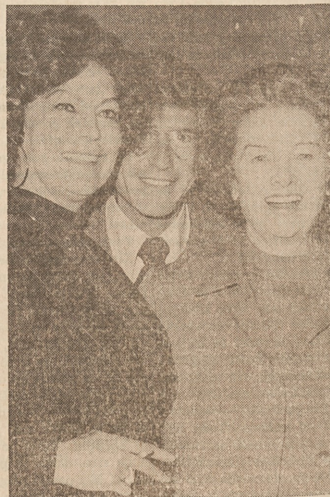
KOT V NEKDANJIH DNEH — Filmska igralka Ava Gardner (na levi) in Myrna Loy z nekdanjo otroško zvezdo Roddy McDowell pri predvajanju filmov v Los Angeles Museum.