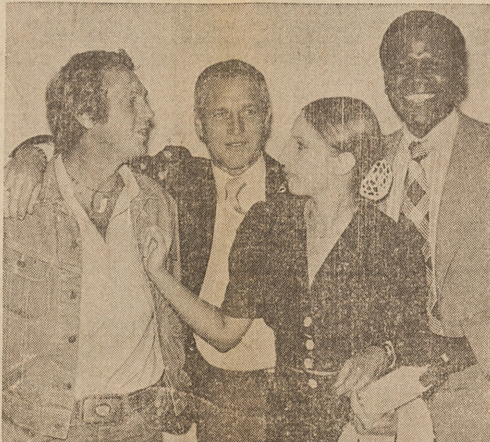
V SVOJEM LASTNIŠTVU — Znani filmski igralci Steve McQueen (na levi), Paul Newman in Sidney Poitier ter pevka-igralka Barbra Streisand so se povezali v First Artists Production, ki je nedavno pustila v predvajanje prve štiri filme, v katerih vsakem nastopa eden od navedenih.