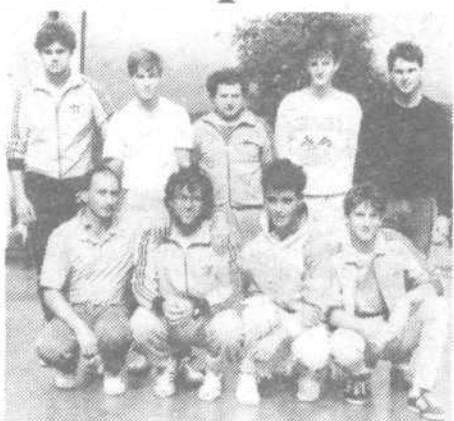
Na turnirju v malem nogometu se je najbolje odrezalo moštvo »Jama Berda« iz Podpeč-Preseje