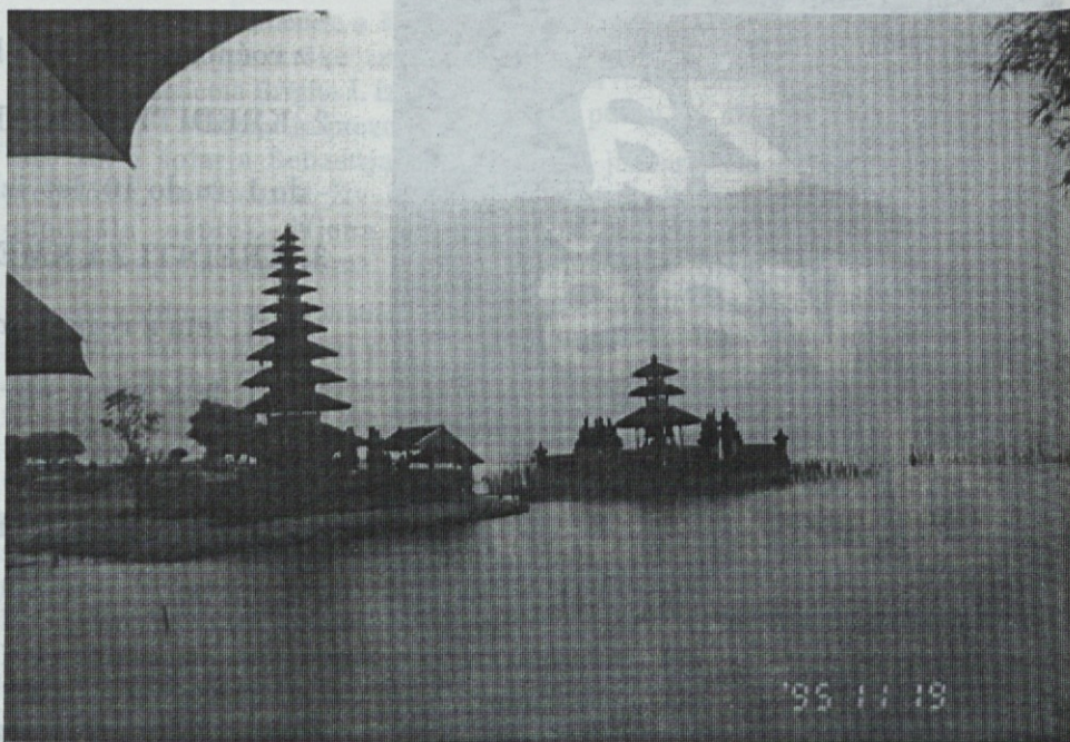
Jezero Batur s templjem

je cvetočega grmičja, ob ograjah pa so speljani vodni kanali do riževih teras, v katerih se ljudje brez sramu goli umivajo. Mnoge ženske hodijo tudi po cesti zgoraj brez. Najprej se ustavimo pri Besakih templju iz 11. stoletja, moramo si nadeti