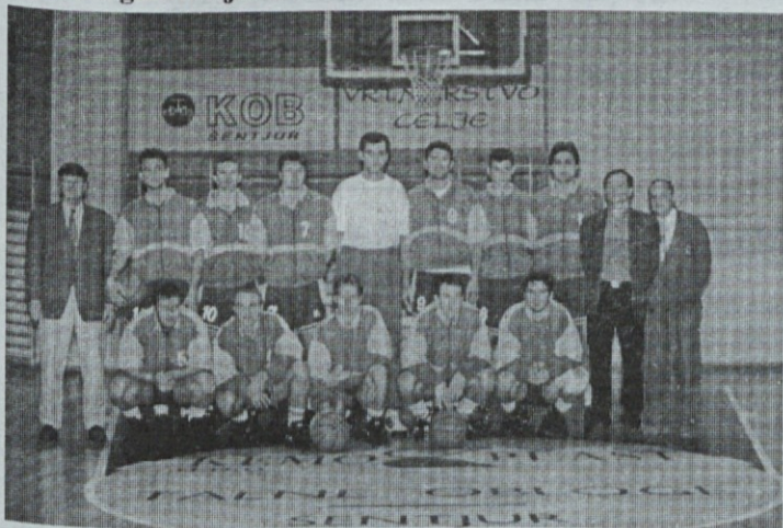
KK Kemoplast Šentjur

Igra in z njo tudi uspehi KK Kemoplast močno temeljijo na "tujih" igralcih. Brez okrepitev bi se težko potegovali za tako visoka mesta v ligi. V nedogled ne bo možno graditi igre na kupljenih igralcih. Zanima me, kako se v vašem klubu dela z mladimi generacijami.