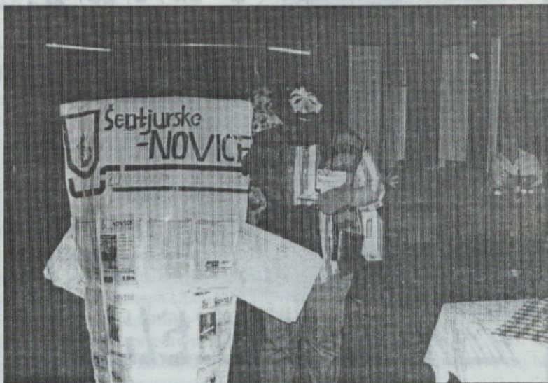
Tudi Šentjurske novice so si prislužile maškaradno pozornost

Pustni torek so vzeli v zakup šolarji. Bučna in dolga pustna povorka šolarjev iz OŠ Franja Malgaja je šla skozi ves trg. Duhovi, malce premladi upokojenci, klovni, indijanci, zelo živahna četica pravih