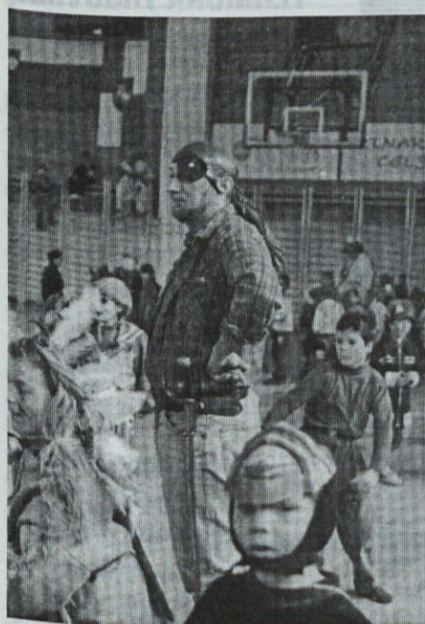
Za red v OŠ Hruševac je bilo poskrbljeno

Kovač, ki ju seveda nisem smel zgrešiti.