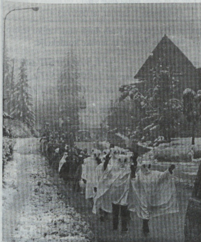
Povorko iz OŠ F.Malgaja so povedli duhovi

se pohvalili, da jih plača šentjurska občina, Resevna je zastonj delila krofe, maske, večino smo jih že videli dopoldne na šolskih maškaradah, pa so prav veselo rajale.