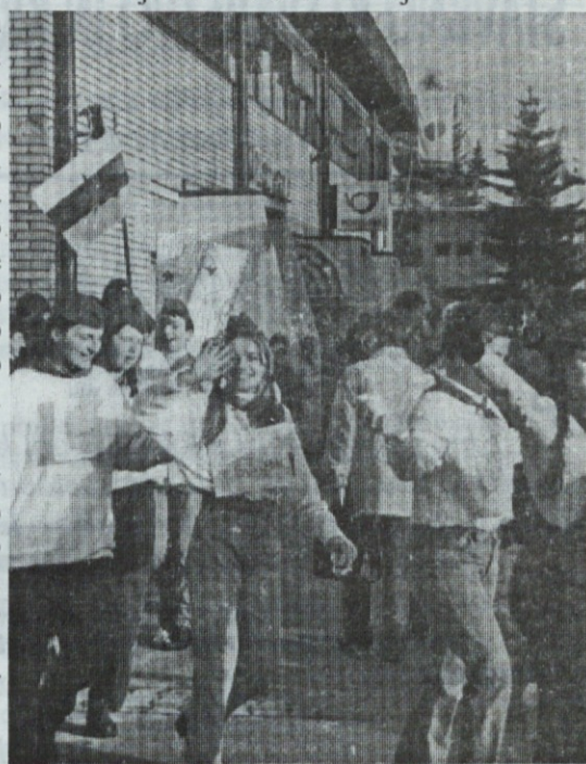
Pionirska četa je bila vzorno aktivna

Popoldne je imelo maškarado Društvo prijateljev mladine. Pred Resevno je za živahnost skrbel ansambel 7. raj, sami so