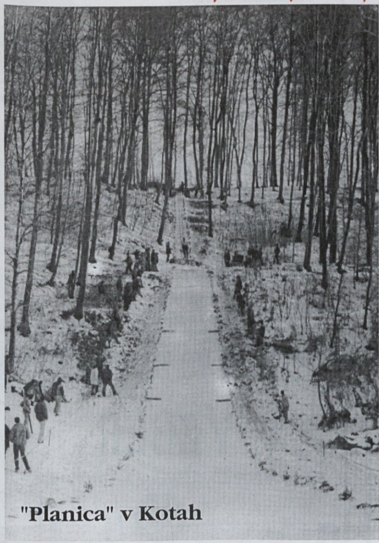
"Planica" v Kotah