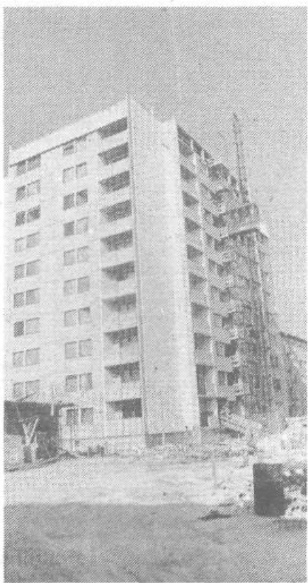
Za cene za kvadratni meter stanovanjske površine vemo, da nezadržno rastejo. Nedavna odločitev oziroma podpora mestne skupnosti za cene predloga za povišanje bazne cene je zagotovilo, da bo kvadratni meter še dražji, kljub temu, da si po drugi strani marsikdo prizadeva, da bi vsoto oklestil vseh neupravičenih »dodatkov«.

Ker preteče od začetka priprave na gradnjo neke stanovanjske soseke kar sedem let, je zelo pomembno, kdaj se priprave začnejo. Poleg tega pa je pomembno tudi, kdaj se začne dejanska gradnja neke soseke. Tako so zdaj v naši občini v pripravi naslednje soseke, oziroma posamezni bloki v sosekah: V VS-3 Žičnica blok B-2 z 68 stanovanji, VS-7 Brdo s 54 stanovanji, VS-236 Ig s 30 stanovanji, VS-6 Stari Vič z 78 stanovanji in VS-103 Jurčkova pot s 93 stanovanji.