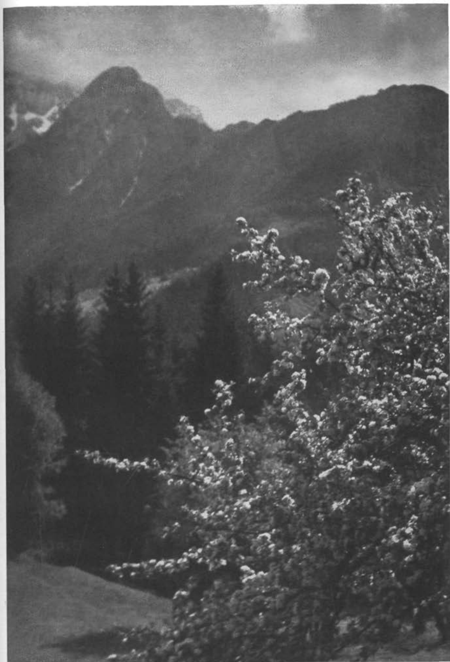
Cvetje v gorah