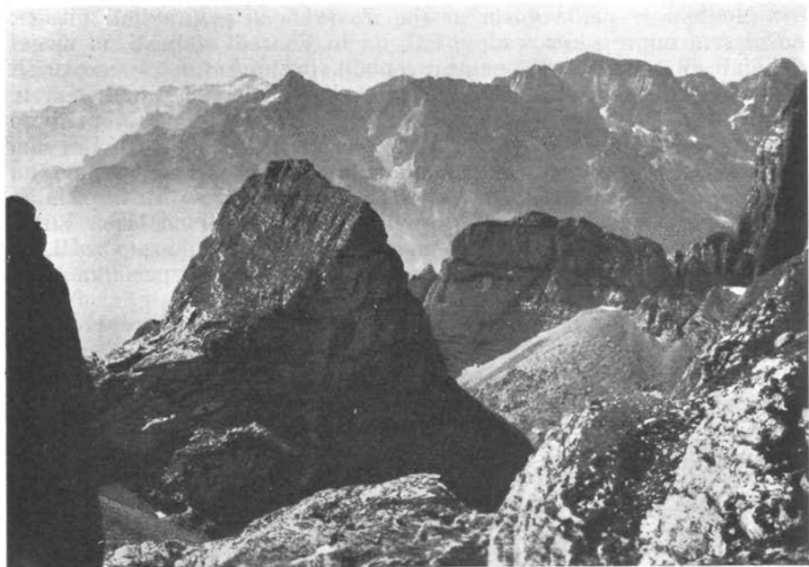
Krajsničke Planine iz Bjeliča. U pozadini njihov najviši vrh: Maja Hekurave