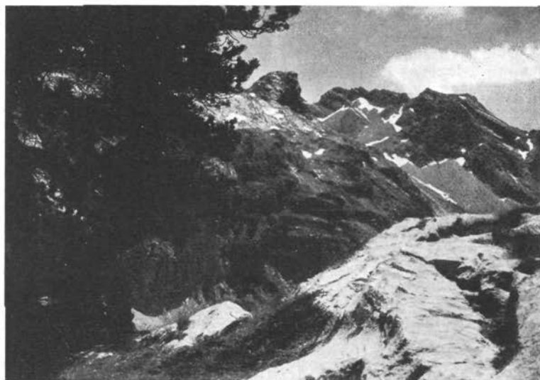
Pogled na Maja Jezerce, najviši vrh Prokletiji

od ostalih susjednih planina na sjeveroistoku. Ta mi sami boravimo eto već nekoliko dana u gorju paleozojske građe, u gorju vanredno blagog reliefa i otvorenih prolaza sa sviju strana. Pitomina (pitoma zemlja) oko nas ne odgovara pojmu proklete planine. Silna brda bijele se nadaleko. Iz daljine odaju značaj grdnoga karsta (Krasa). Da, te su planine građene od krečnjaka, od pretežito trijaskih krečnjaka, onih istih, što izgrađuju planinski bedem (zid) uz istočnu obalu Jadrana. Prokletije su karsne (kraške) planine, dio Dinarske planinske sisteme. S ostalim Dinarskim Planinama na sjeverozapadu Prokletije čine nerazdijeljivu organsku cjelinu, upravo ovi su masivi kulminanta ogromne dinarske stepenice, što se postepeno diže od sjeverozapada prema jugoistoku. Pa kako nam se promatrajući Prokletije nameće nepobitna srodnost ovih planina s ostalim sjeverozapadnijim, ma da nižim i slabije razvedenim planinama Dinarske sisteme,