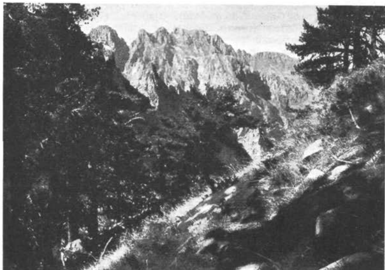
Vezirova Brada u Prokletijama

Konačno dosižemo najgornji cirk (ozebnik) našeg ledenjačkog valova. Pod stijenama smo Maja Koladz, na Čafa Presfopit. Grandiozno gorje razotkriva se pred nama. Silna Maja Koladz nadvisuje nas svojim masivnim stošcem, što je sav iššaran vertikalnim škripima. Na njenom podnožju u duboku amfiteatru leži mnogo snijega. Lijepi vrhunci nižu se oko ovog visokog ledenjačkog cirka. U njihovim golemim moćnim potezima odiše dah alpski snažnoga kraja. Razveden, veoma zanimljiv greben nastavlja se na zapadnoj strani našega prelaza. Njegove glatke stijene dižu se direktno s točila (drča) i svršavaju nizom tubastih bastijona. Koje je biljege svom zavičaju dao čovjek ovih planina? Kako