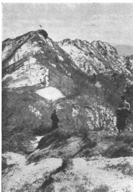
Grmada nad Sv. Katarino

kjer ptice v zboru oznanjajo novi dan. Koliko dobrote bi bilo na svetu, če bi vsi ljudje živeli, kakor jih uči zdrava narava! Saj smo del narave — zakaj se je moral ravno človek tako daleč izgubiti iz prvotnega okvira naravnosti! Zdaj pa hrepenimo nazaj, nazaj k lepoti telesa in duše, k poštenju in veliki resnici.