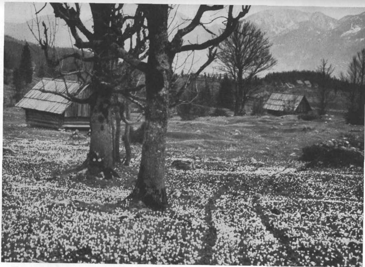
Pomlad na Uskovnici