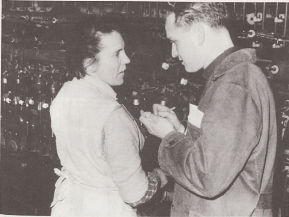
Sodelavci glasila Tovarne Induplati Konoplani so se pogosto z beležko v roki sprehodili po proizvodnji hali in delavke oz. delavce povprašali o njihovem vsakdanjem delu, veselju in problemih v življenju.

vseh človeških fenomenov« (ne obravnavajo se več kot človeški produkti, temveč kot predmeti »per se«). Šokantno je, kako hitro je človek sposoben pozabiti, da je sam ustvaril humani svet. »Popredmetenje implicira ..., da je dialektika med človeškim izdelovalcem in njegovim izdelkom za zavest izgubljena.« (Fliedl 1991, 33) 6