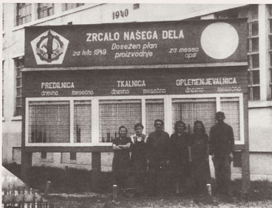
»Grafikon in najboljši delavci aprila leta 1949, Induplati Jarše«-komentar tovarniškega kronista. (Original hrani Tovarna Induplati Jarše).

Po drugi vojni je država iskala temelje gospodarske moči v razvoju težke industrije. Tekstilna industrija ni bila ena izmed privilegiranih panog. Po raziskavi sodeč je bila bolj prepuščena sama sebi. 10 Posledica premajhnih investicij državnega kapitala je bil pomanjkljiv razvoj strojnega parka (predvsem v tkalnicah in predilnicah). Modernizacija je v svetu potekala zelo hitro. V Jugoslaviji smo jim težko sledili. Strojna oprema se je uvažala, večkrat pa le improvizirano popravljala. Uvoz in vzdrževanje opreme sta bila draga. Tovarne so iskale rešitve med drugim tudi v delovni sili. Leta 1950 je tekstilna industrija v Sloveniji zaposlovala 32.000 delavcev, zaposlovanje je bilo zelo ekstenzivno, proizvodnja se je večinoma povečevala z zaposlovanjem. Pred osamosvojitvijo leta 1991 je zaposlovala več kot 53.000 ljudi. Pred drugo svetovno vojno je bila ta panoga na prvem mestu po številu zaposlenih in po splošnem gospodarskem pomenu (25 odstotkov vrednosti celotne industrijske proizvodnje), leta 1975 pa je imela le še 13 odstotkov vrednosti celotne industrijske