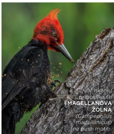
V iskanju priboljška se MAGELLANOVA ŽOLNA ( Campephilus magellanicus ) ne pusti motiti.