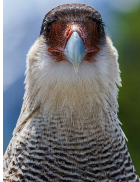
KARAKARA ( Caracara plancus ) sodi med večje ujede v Andih.