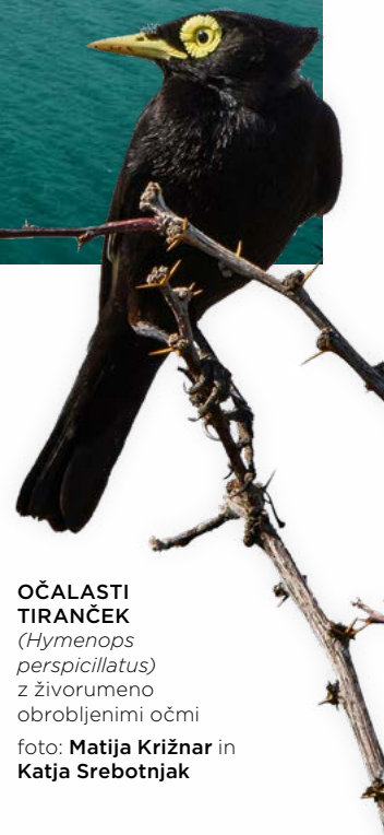
OČALASTI TIRANČEK ( Hymenops perspicillatus ) z živorumeno obrobjenimi očmi

Pokrajina, ujeta med Ande in Patagonsko stepo, skriva še mnogo izjemnih naravnih bogastev, ki obi- skovalca ne pustijo ravnodušnega. Tukajšnja narava ne skopari s pestrostjo barv, oblik in zvokov, toda za to je potrebno vsaj za trenutek ustaviti korak, umiriti misli in opazovati.