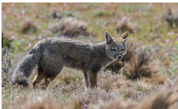
ARGENTINSKA LISICA ( Lycalopex griseus ) je vedno na preži za plenom.