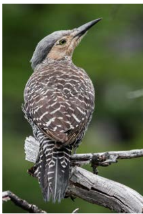
ČILSKA ŽOLNA ( Colaptes pitius ) je ena najpogostejših ptic pod Fitz Royem.