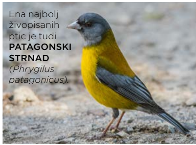
Ena najbolj živopisnih ptic je tudi PATAGONSKI STRNAD ( Phrygilus patagonicus ).