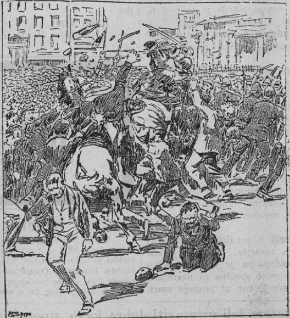
Der Strassenkampf in Liverpool.

Poročali smo že, da so se vršili deloma še nedokončani štrajki na Angleškem, ki so bili še bolj revoluciji kakor navadnemu štrajku podobni. V mestu Liverpoolu zgodili so se pravi, krvavi boji. Delavci so bili oboroženi in se vojaštvu niso umaknili. Več kot 100 000 delavcev napravilo je na cestah barikade in se je borilo s kamenji ter revolverji proti vojaštvu. Vse hiše so bile zabarikadirane. Iz tlaka se je izrgalo kamenje, — eno besedo, bilo je kakor v revoluciji. Dva policista sta bila ubita, več kot 100 oseb pa je bilo težko ranjenih. Generalni štrajki so imeli sveda žalostne gospodarske posledice. Vsak dan je bilo za več milijonov škode. Najhujše je učinkoval štrajk železničarjev in mornarjev, ki je ves angleški promet vstavil. Naše dve sliki kažeta posamezne prizore iz teh bojev. Na prvi sliki vidimo prizor iz cestnih bojev v Liverpoolu, kjer je bilo ravno najhujše. Delavci so policijske jezdece iz konjev metali. Le hladnokrvnosti angleške policije, ki ni streljala, se je zahvaliti, da ni v veliki gneči boj še žalostnejše posledice imel. Druga naša slika kaže vrsto vozov z življenjskimi sredstvi, ki jih policija na konjih ter vojak strajžijo, ker bi jih drugače delavci takoj razbili. Na vsakem vozu je bilo par policajev ali vojakov. Štrajki na Angleškem so dokaz neverjetnega nasilja tistih delavskih krogov, ki niti svojih lastnih voditeljev ne poslušajo. S takim nasiljem si delavstvo ne more boljše bodočnosti doseči!