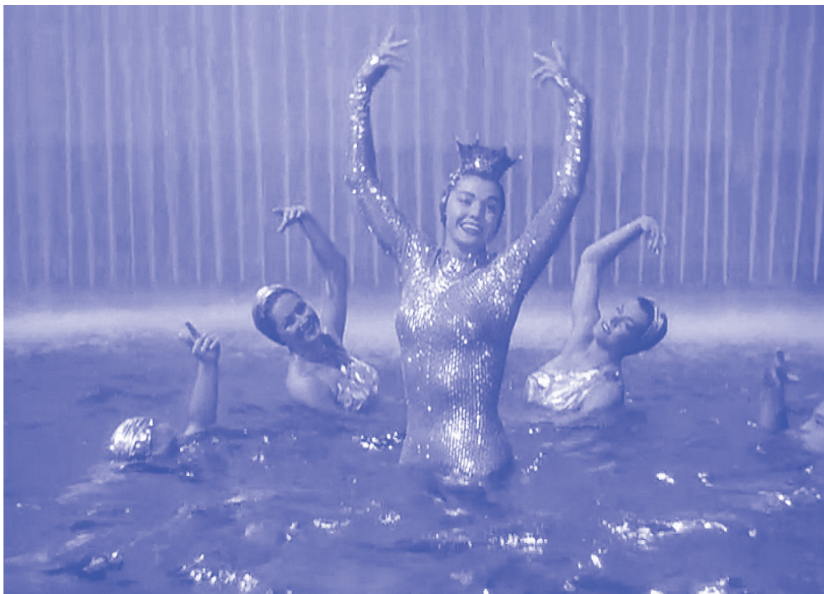
MILLION DOLLAR MERMAID (1952)