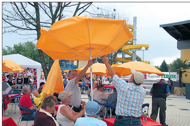
Na čase je zapihal močan veter, tako da je obračalo tudi dežnike ...