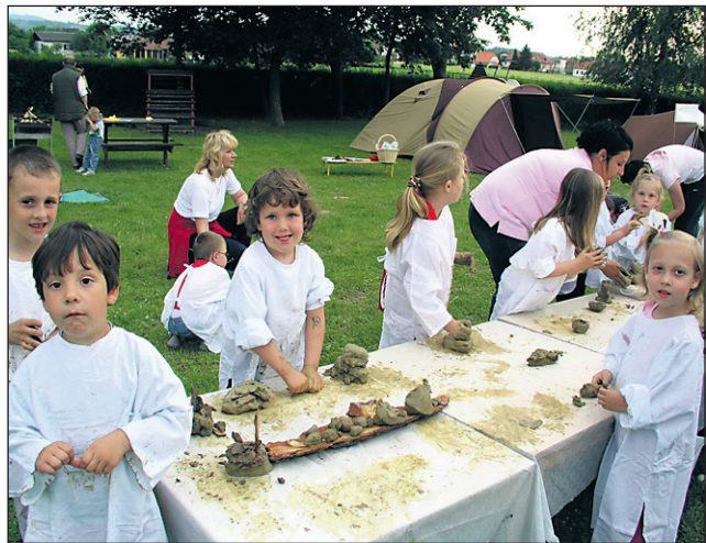
Utrinek s 5. vrtca v naravi