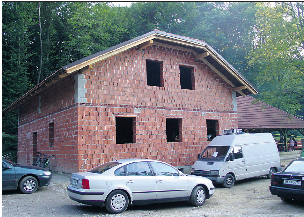
Novi lovski dom v Vitomarcih