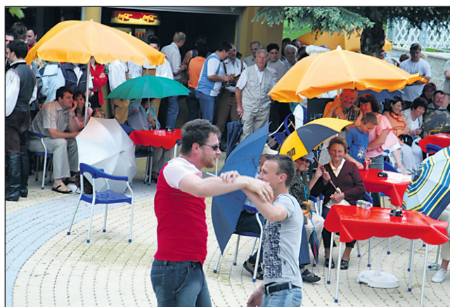
Ženskemu svetu v posmeh sta za dobro voljo z odličnim plesom poskrbela mlada veseljaka.