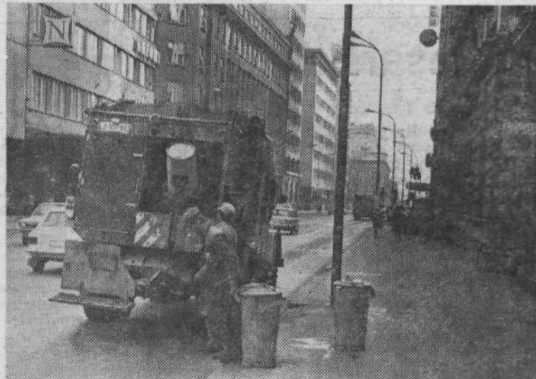
CISTOČA — »Komunalci« se morajo navsezgodaj potruditi, da počistijo mestne ulice in s tem ovirali promet. Vsak dan mesto olajšajo za več sto ton smeti in druge nesnage, ki se nabere v smetnjakih.