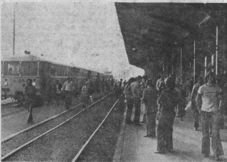
ZELEZNISKA POSTAJA — V jutranjih urah ljubljanska železniška postaja postane pravo »mravljišče«. Iz bližnje in daljnje okolice vozijo vlaki, polni ljudi, ki so v mestu v službi, šoli ali pa imajo druge opravke.