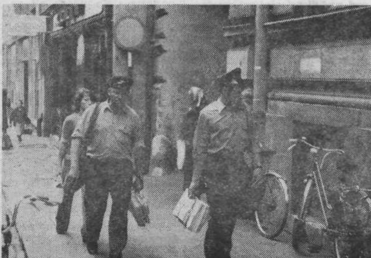
POSTA — Zjutraj so poštni torbe najtežje, še posebno takrat ko se raznašajo časopisi. »Hitro pot pod noge in od stanovanja do stanovanja«, saj vsi željno pričakujejo poštarja.