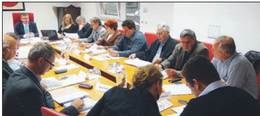
Svetniki so menili, da bi bilo prav, če bi jim kandidat za državni svet iz Šaleške doline pred volitvami predstavili svoja stališča.

dno tožbo proti podjetju Fori glede Tomažka. NLB pa je na začetku aprila uresničila svojo napoved in zaprla poslovalnico, ali oziroma katera banka jo bo nadomestila, pa za zdaj še ni znano. Kar nekaj