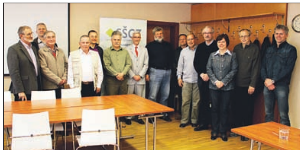
Del članstva DVI Velenje in gostje po skupščini

Varnostni inženirji so na svoji skupščini konec aprila ugotavljali, da kljub krizi varnosti pri delu in kakovosti sobivanja ne bodo dovoljevali opuščanja nujnih varnostnih ukrepov na delovnih mestih, sami pa bodo poiskali različne, sicer skromne možnosti za samozaveževanje in izvajanje povezovalne dejavnosti. Po sprejetih poročilih o