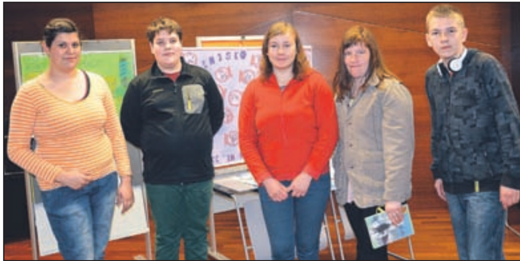
Zmagovalna ekipa iz CVIU pred plakatom, ki ga je strokovna komisija najbolje ocenila. Med 20 plakatov je bilo veliko izbirnih idej, kaj bi se lahko naredili ob Velenjskem jezeru.