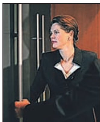
Premierka Alenka Bratušek je napovedala svoj odstop.

Dopoldne se je zgodil sestanek Alenke Bratušek s predsedniki treh koalicijskih strank. Po njem je premierka dejala: »Odločili smo se, da je za Slovenijo najbolje, da gremo čim prej na volitve, zato bom v ponedeljek podala svoj odstop.« Odzivov seveda ni manjkalo. Lukšič, ki je predsednik Evropske komisije, je v poročilu so zapisali, da se je Slovenija izklopala iz recesije in bo imela letos 0,8-odstotno, prihodnje leto pa 1,4-odstotno gospodarsko rast.