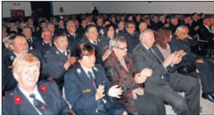
Dvorano so napolnili ljudje, ki jih odlikuje zvrhana mera prostovoljstva, predanost in velik čut za pomoč sočloveku ob raznih nesrečah

nih intervencij ... »Vaše poslanstvo pomagati ljudem v stiski, pripravljenost priskočiti na pomoč tudi ob vseh vrstah nesreč tam, kjer je ogroženo človeško življenje ter premoženje, dokazuje, da je naše humano poslanstvo neprecenljive vrednosti.« Izrazil je zadovoljstvo, ker tudi širša družba vse bolj ceni njihovo delo. Pozval je