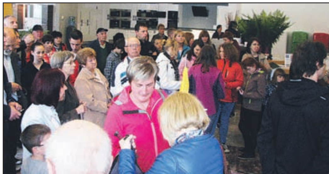
V Studiu so si ogledali celovito ponudbo izdelkov blagovne znamke Gorenje.