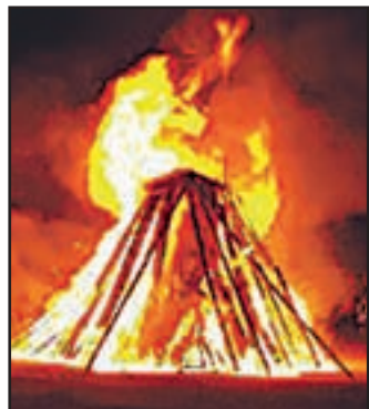
Po vsej državi so goreli kresovi.

Po vsej državi so pred praznikom dela zagoreli kresovi. Osrednje tradicionalno je bilo na ljubljanskem Rožniku. Na predvečer praznika pa se ni le praznovalo – gibanje za dostojno delo in socialno družbo je opozarjalo na vse slabši položaj delavcev v nestalnih oblikah zaposlitve.