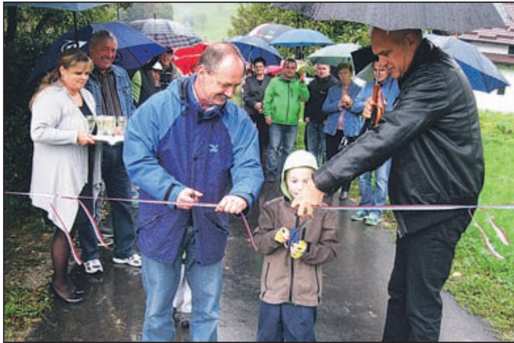
Takole so lani septembra predali namenu obnovljeno cesto, ki vodi mimo gasilskega doma.

Trenutno zbiramo delež, ki ga bodo prispevali krajanji, ostalo bosta dodala MO Velenje in Komunalno podjetje Velenje. Računamo, da bo denar zbran do konca leta, ko naj bi bil izdelan tudi projekt, izgradnja pa naj bi začeli tudi ob koncu letošnjega leta ali na začetku leta 2015. Izgradnja kanalizacije bi radi končali v letu 2016.«