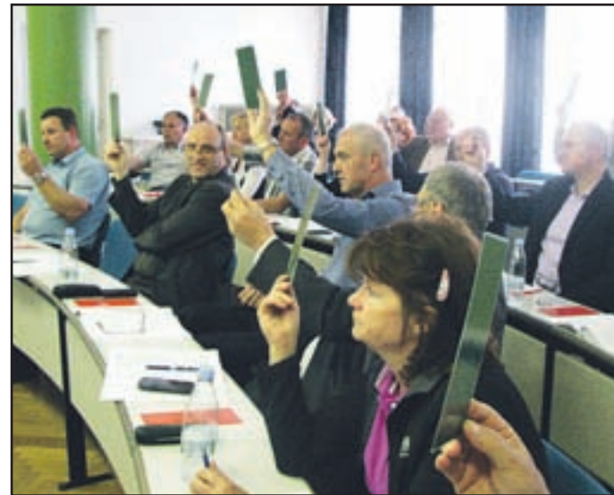
Javno je (skoraj) vedno soglasno.

številnih podzakonskih predpisov, ki urejajo področje odvajanja in čiščenja odpadnih voda. Spremembe zakonodaje se nanašajo predvsem za izenačitev meril varovanja okolja na območjih z urejenim javnim kanalizacijskim sistemom z območji, kjer javne kanalizacije še ni ali pa njena izgradnja ni predvidena. Za zdaj odlok za uporabnike ne bo imel dodatnih finančnih obremenitev pri plačevanju storitve. V prihodnosti pa posledice gotovo bodo. Čutili jih bodo tako uporabniki kot izvajalec gospodarske javne službe, in to zaradi dviga standardov, ki jih predpisuje država. Kot že rečeno,