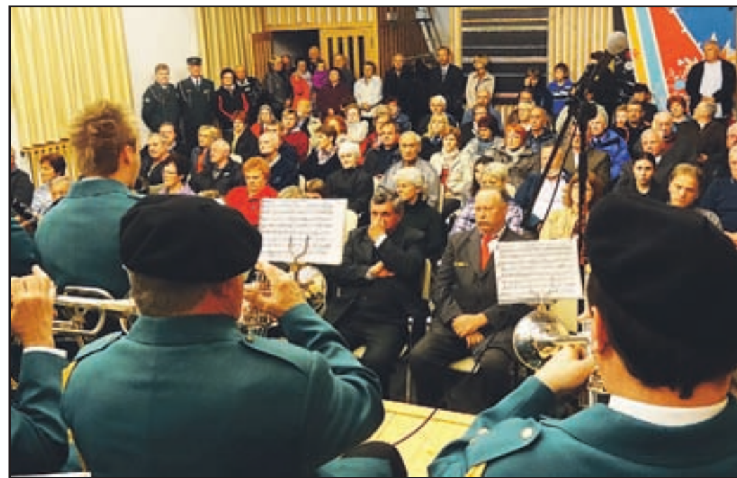
Dvorana Marof je bila polna.

slogan »Za pošteno delo pošteno plačilo« v praksi vse bolj izgublja svojo veljavo. »Na spomeniku žrtvam 2. svetovne vojne na našem pokopališču je vklesana pomenljiva misel: Vse, kar veliko je, vzkali iz žrtev in ti, ki živ si, mrtvim si dolžnik! Svoj dolg do vseh, ki so bili žrtvovani za nas, da danes živimo v samostojni in svobodni državi, bomo na najboljši možen način poravnali s tem, da bomo ohranjali spoštljiv spomin