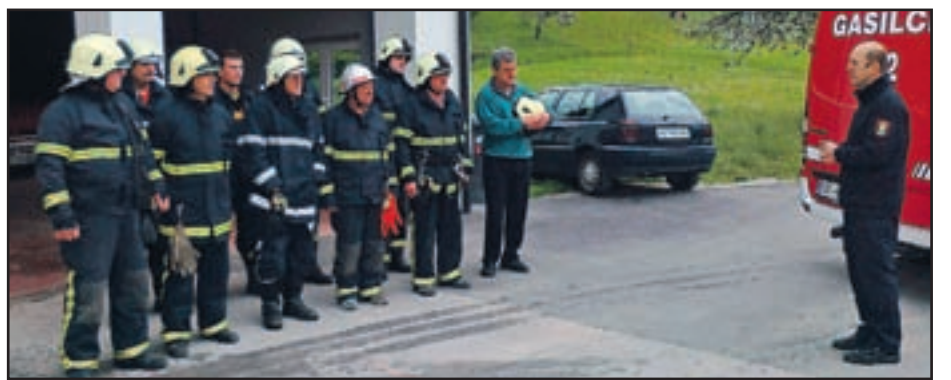
Ob nenapovedanih gasilskih vajah so v vseh sedmih velenjskih prostovoljnih gasilskih društvih preizkusili tudi sistem alarmiranja.

Velenje, 24. in 25. aprila - Zadnji aprilski četrtek in petek sta na območju mestne občine Velenje po nalogu župana Bojana Kontiča potekali vsakoletni nenapovedani poskusni vaji velenjskih prostovoljnih gasilskih društev. Namen vaje je bil preveriti izvozni čas intervencijskih ekip iz gasilskih domov in oceniti pravilnost postopkov ob alarmiranju. Akcija, ki jo je vodil štab Civilne zaščite MO Velenje, je potekala z javnim alarmiranjem s sirenami