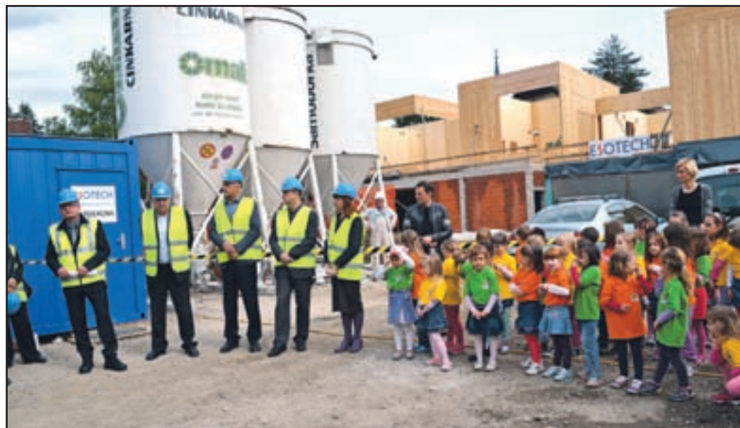
Številni občani so si z zanimanjem ogledali gradbišče novega vrtca.

Na portalu javnih naročil je bilo v torek, 22. aprila, objavljeno javno naročilo za dobavo in montažo opreme vrtca, kar bodo v celoti financirali iz občinskega proračuna. ■