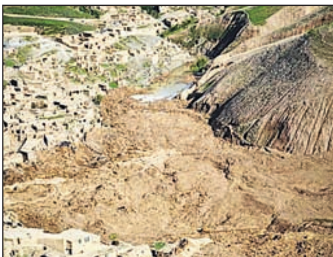
Ogromen plaz v Afganistanu je zasul vas in z njo 2700 ljudi.

Afganistanska vlada je razglasila dvodnevno žalovanje zaradi smrti najmanj 2700 ljudi, ki jih je pod seboj pokopal zemeljski plaz.