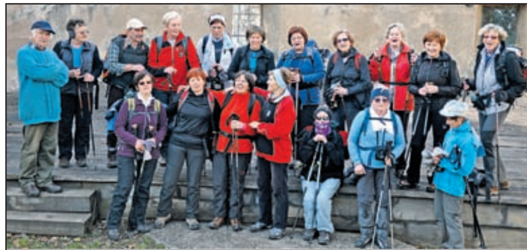
V objemu gradu Vurberk smo zapeli našo himno, Avsenikovo Čez zelene trate .

ki nas je vseskozi spremljalo, smo se odpočili, se okrepčali in se odločili za eno od možnih variant dolžine pohoda. V nadaljevanju poti skozi Juršince smo prešli v naselje Trnovski Vrh, kjer smo že slutili bližnjo Trnovsko vas. Izbrali smo si jo za konec našega dela poti. Po svoje »mogočna« podoba vasi nas