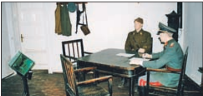
Spominska soba, posvečena kapitulaciji v Topolšici

Rdeči dvorani premagale prvotilski ekipi Podravke iz Koprivnice in se uvrstila v polfinale jugoslovanskega rokometnega pokalnega tekmovanja; - 13. maja 1917 se je na Dunaju rodila avstrijska cesarica Marija Terezija, ki je v času svojega vladanja pustila močan pečat tudi v naših krajih; - na državnem prvenstvu v šahu za slepe, ki je bilo 13. in 14. maja 1989 v Sarajevu, je državni prvak postal Viki Vertačnik iz Topolšice; Vertačnik je nekaj mesecev