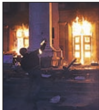
Razmere v Ukrajini so postale vojne.

V Ukrajini je vznikala vojna. Po ofenzivi ukrajinskih vladnih sil v Slavjansku so o tragediji poročali iz Odese. V Domu sindikatov, kjer so ogenj zanetili skrajni prokijevski protestniki, se je zadušilo 38 proruskih aktivistov.