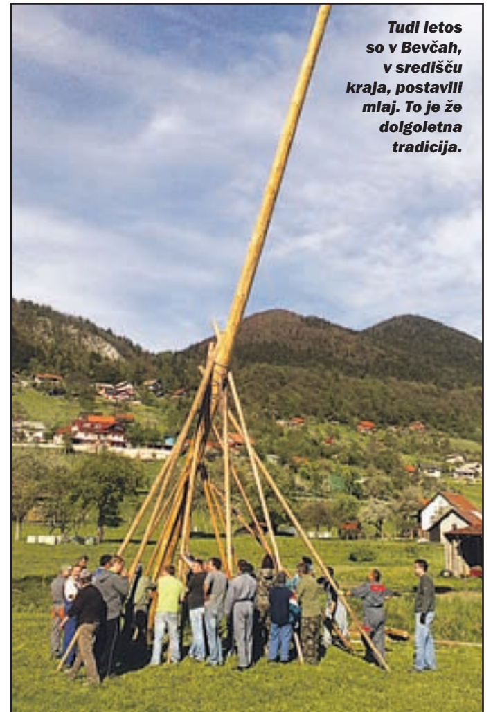
Tudi letos so v Bevčah, v središču kraja, postavili mlaj. To je že dolgoletna tradicija.

Zagotovo pa bo velik dogodek, ko bodo začeli graditi prepotrebno kanalizacijo, ki jo kraj doslej ni imel. »Letos smo se s krajanji dogovorili, da poskušamo v prvi fazi kanalizacijo zgraditi za osrednji del kraja, kjer naj bi bilo zajetih 30 hiš.