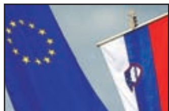
Obeležili smo (tudi) 10 let od pridružitve Evropski uniji.

Nekateri so se spomnili, da smo se na ta dan pred 10 leti pridružili EU.