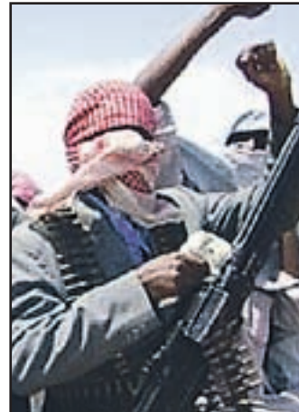
V Nigeriji so ugrabili osem deklc.