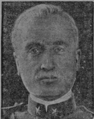
Maršal Badoglio, bivši šef italijanskega generalnega štaba, ki je pred kratkim odstopil

Ali si upate pridobiti »Slovenskemu gospodarju« vsaj enega novega naročnika?