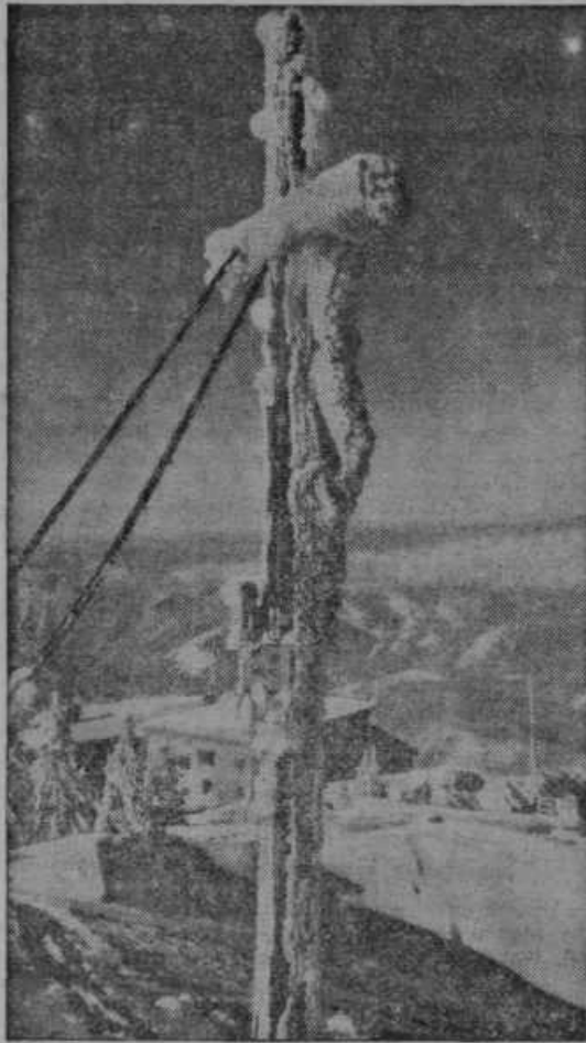
Zasneženi in otagnjeni križ v visokih gorah