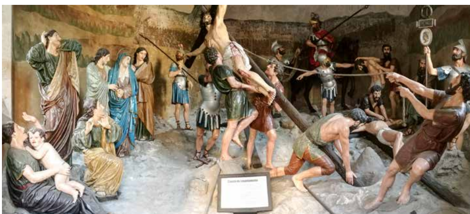
Kapela dviganja križa / Capela do Levantamento / A Capela do Levantamento