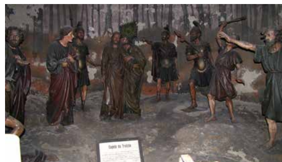
Kapela Judeževega poljuba ali Jezus primejo / Capela da Prisão + kapela