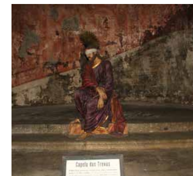
Kapela teme ali Jezus v ječi / Capela das Trevas