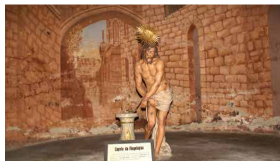
Kapela bičanja / Capela da Flagelação