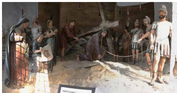
Kapela poti na Kalvarijo (Veronika poda Jezusu potni prt, Jezus sreča jeruzalemske žene, Jezus trikrat pade pod križem) / Capela da Subida para o Calvário