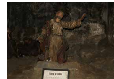
Kapela Kristusovega trpljenja v vrtu Getsemani / Capela da Agonia ou do Horto