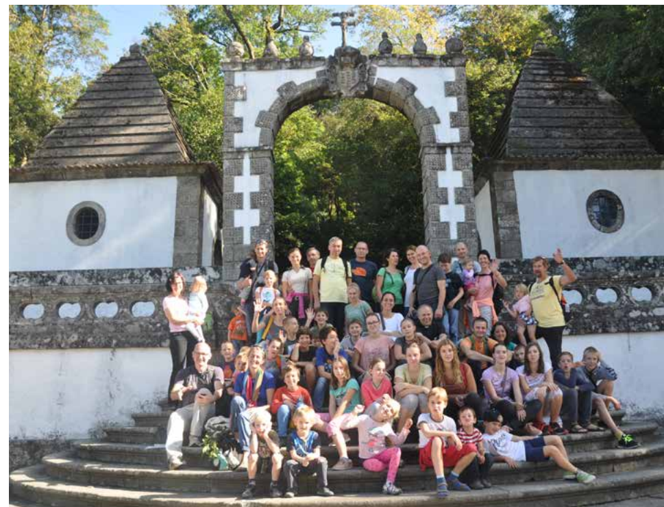
Portal ob vstopu na stopnišče, ki vodi do svetišča Bom Jesus

Na severu Portugalske, v bližini mesta Braga, stoji na vrhu hribčka cerkev, posvečena Dobremu Jezusu (Bom Jesus do Monte), do nje pa vodi mogočno baročno stopnišče, ob katerem so postavljene kapele s prizori Kristusovega pasijona (Via Crucis). Po tem križevem potu smo se družine iz Slovenije na romanju v Fatimo povzpele v soboto, 28. oktobra 2017.