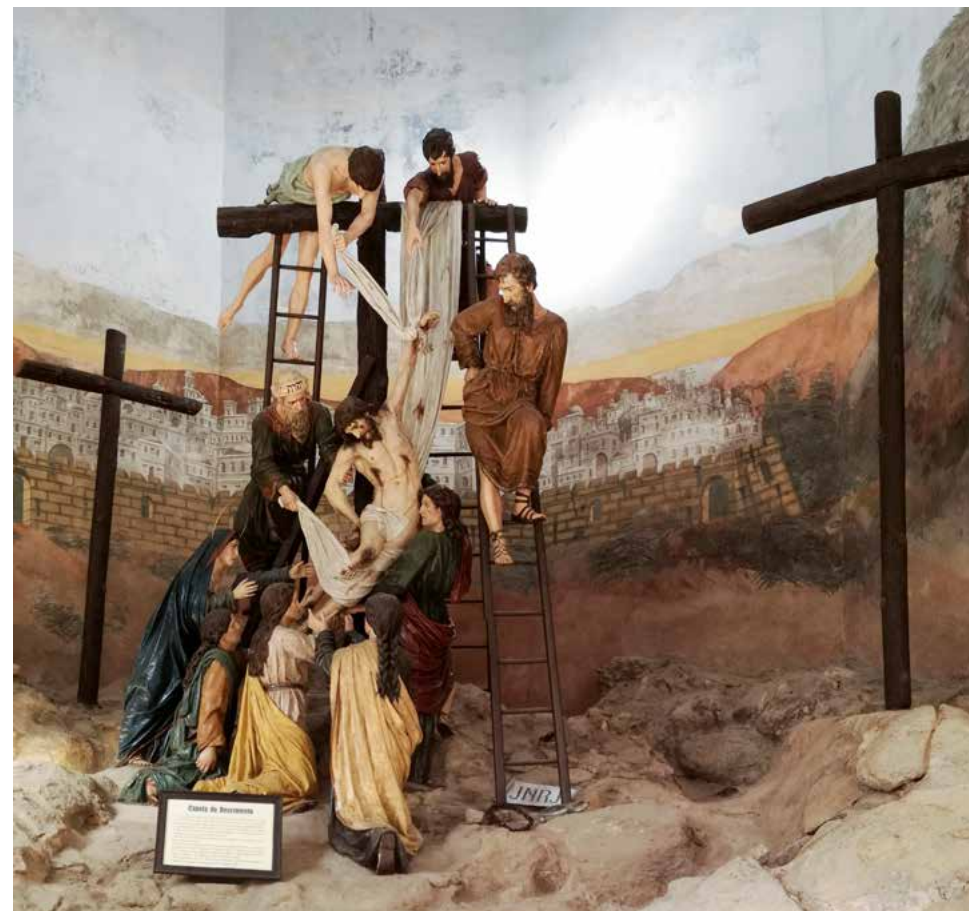
Kapela snemanja s križa / Capela da Descida da Cruz

V treh oktagonalnih kapelah za cerkvijo, ki so jih zgradili leta 1760, so prizori dogodkov, ki so sledili križanju (npr. srečanje Jezusa z Marijo Magdaleno).