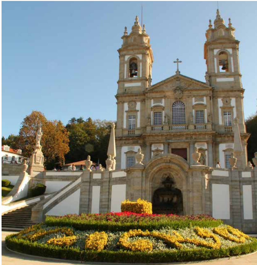
Cerkev, posvečena Dobremu Jezusu (Bom Jesus do Monte)

V 19. stoletju so okolico cerkve in stopnišče razlastili in ju spremenili v park. Leta 1882 so postavili vzpenjačo na vodni pogon (water balance Bom Jesus funicular), da bi povezali mesto Braga s svetiščem. To je bila prva vzpenjača na Iberskem polotoku in je še vedno v uporabi.