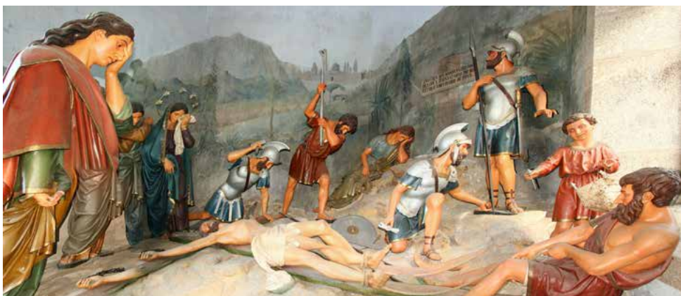
Kapela križanja ali Jezusa pribijejo na križ / Capela da Crucifixaõ