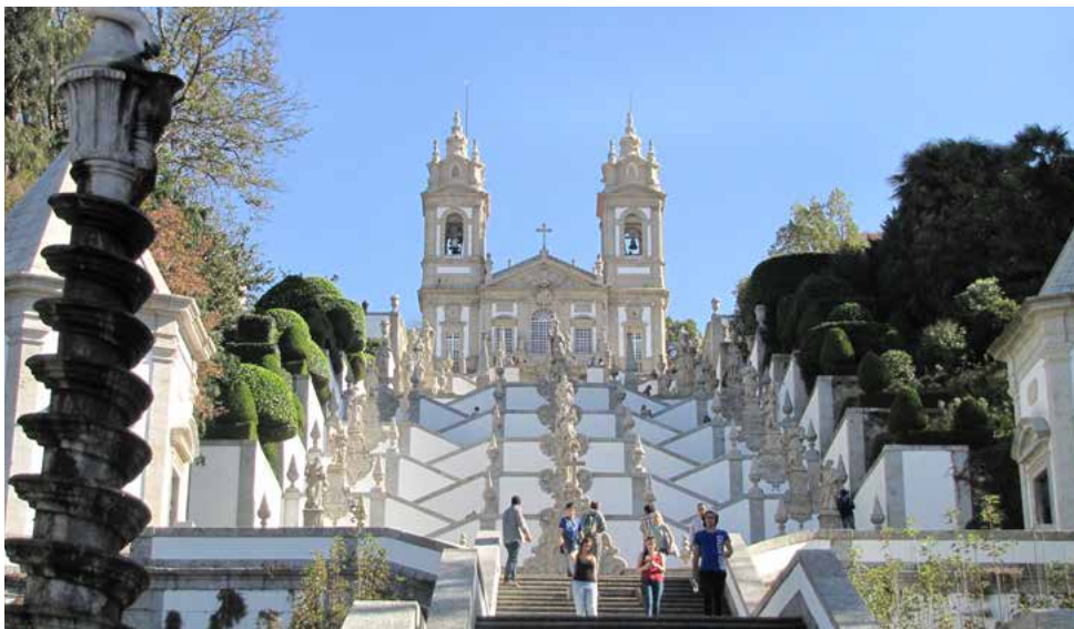
Zaključek prvega (najstarejšega) dela stopnišča in vstop v drugi in tretji del stopnišča v cikcak obliki

Okoli leta 1781 so začeli dograjevati še tretji del stopnišča, tudi v cikcak obliki, s tremi vodnjaki, ki simbolizirajo tri teološke kreposti oz. čednosti: vero, upanje in dobroto (ljubezen). Na mestu stare cerkve so leta 1784 začeli graditi novo v neoklasicističnem slogu. Notranjost so opremili v začetku 19. stoletja, posvečena pa je bila leta 1834. Glavni oltar prikazuje križanje. Na ploščadi pred cerkvijo stoji osem kipov ljudi: štirje ponazarjajo osebe, ki so Jezusa obsodile (Ana, Kajfa, Herod, Pilat), štirje kipi pa predstavljajo osebe, ki so poskrbele za Jezusov pokop (Jožef iz Arimateje, Nikodem, rimski stotnik in Pilat, ker je dovolil, da Jezusa snamejo in položijo v grob).