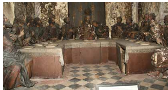
Kapela zadnje večerje / Capela da Última Ceia

Vse do vrha stopnišča je postavljenih štirinajst kapel s podobami Kristusovega trpljenja, ki nam približajo prizore posameznih postaj križevega pota (slike spodaj). Nekateri prizori so prikazani tudi v samem svetišču na vrhu hriba in na ploščadi ob cerkvi.