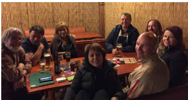
Druženje čeških in loških pasijoncev v zavetju »Tilia Europassionis«, vse foto Aleksander Igljčar

Večerna uprizoritve pasijona je bila zelo nagovarjajoča. Na začetku je prizorišče osvetljevala dnevna svetloba, ki je v času predstave pojemale, zaključek smo dočakali v prijetni temini sveže poletne noči. Mileni je šlo zelo dobro in notranje je bila zelo hvaležna, da se je pustila pregovoriti. Od blizu je začutila češko pasijonsko energijo in navdušenje igralcev, ki jih iz leta v leto nagovarja, da sodelujejo. Morda pa bo kdo izmed njih leta 2021 sodeloval tudi pri uprizoritvah Škofjeloškega pasijona . Kdo ve, prepustimo se pasijonskemu vetru, ki duhovno povezuje vse pasijonce. Medsebojne vezi smo dolgo v noč utrjevali ob češkem pivu v lokalu ob gledališču, nad katerim lepo uspeva lipa pasijonskega prijateljstva »Tilia Europassionis«, ki smo jo zasadili ob prvem obisku avgusta 2014.