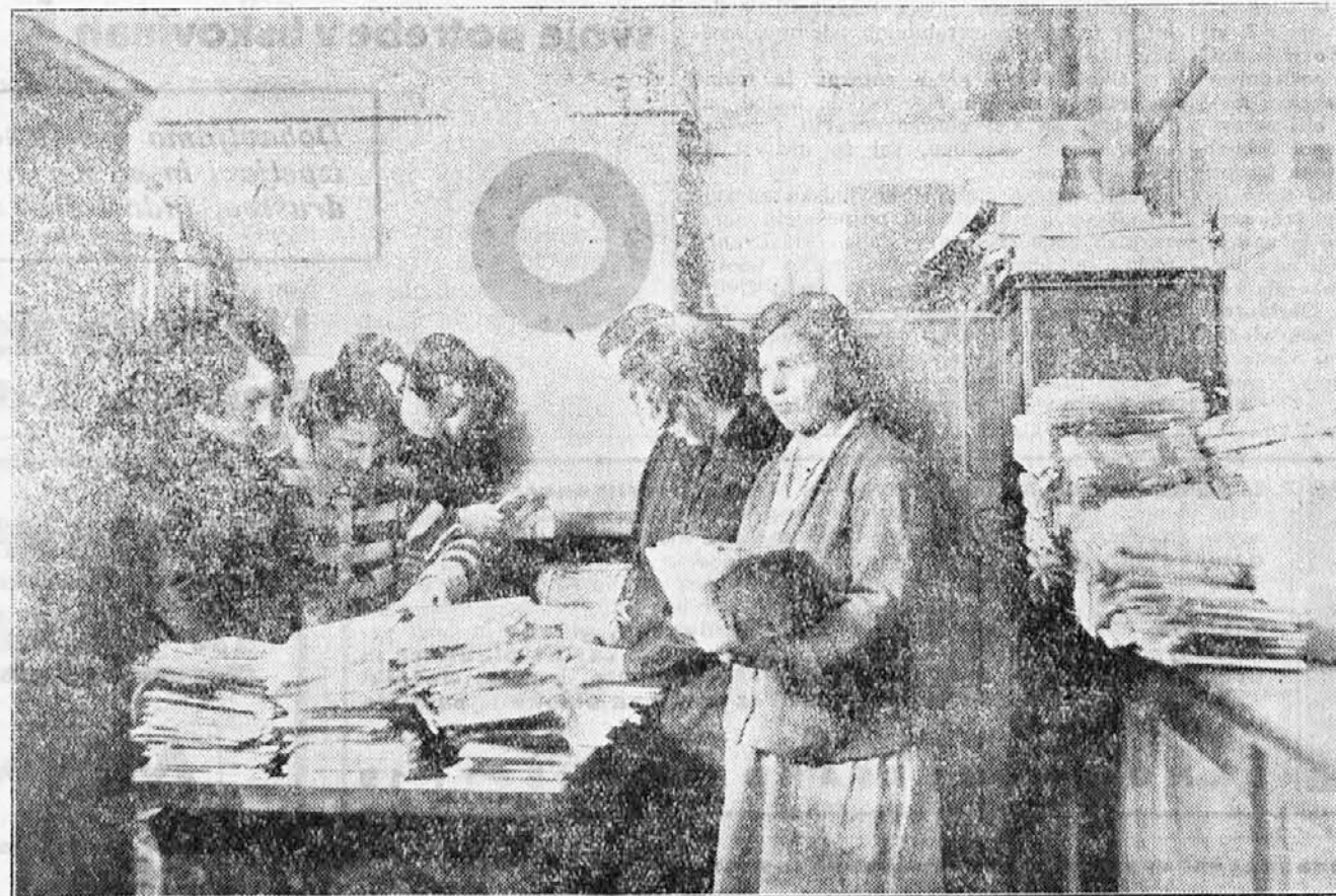
„Delavska Politika“ se razpošilja na pošto.

In tako vam ob velikem hrumu leze »Delavska Politika« izvod iz izvodom iz stroja. Odtod jo znosijo ženske k zgibalnemu stroju, ki jo zloži tako, kakor jo vidite pred seboj.