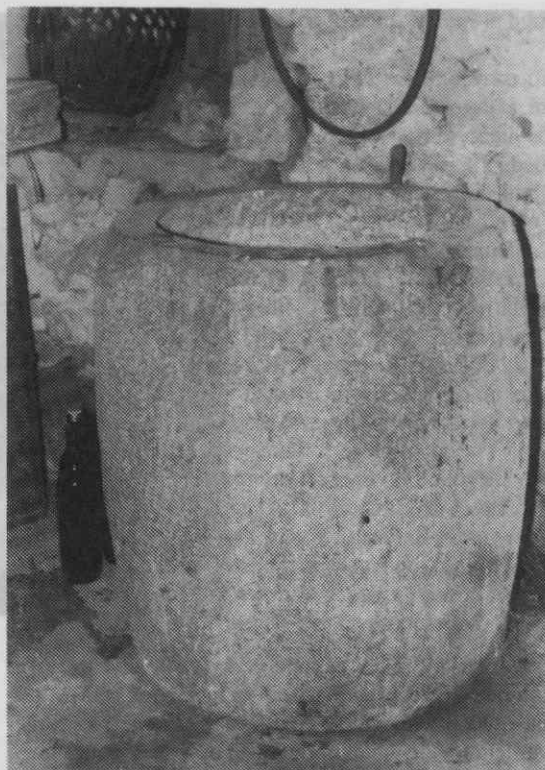
Bezoviški komunski kamen za olje

Za lastne potrebe in delno tudi za potrebe sosednjih vasi je vas imela torklo. Upravitelj torkle je bil župan, on je imel tudi njene ključe. Olje so stiskali za to opravilo posebej priučeni ljudje — torklarji . Delo je potekalo v izmenah, dan in noč, tri do štiri mesece na leto. S stiskanjem so začeli po Sv. Katarini (25. november), po tem datumu se je namreč smelo začeti z obiranjem oliv. V vsaki izmeni je delalo po šest torklarjev. Dva sta mlela olive, dva sta polnila športe — posebne, iz močne žakljevine spletene vreče, v katere so dali zmlete olive, jih zložili pod stisk in prelivali z vrelo vodo ter stiskali. Pomagala sta še dva vodarja , ki sta prinašala in kuhala vodo. Tu je bil še človek, ki je vodil prevzem oliv in izdajo olja.