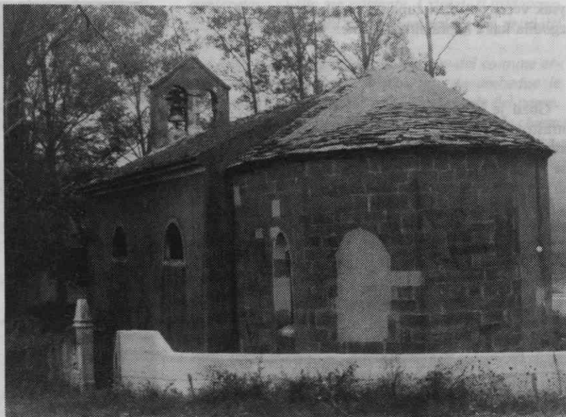
Cerkev Device Marije na Zvročku ob izviru Rižane

obeh cerkev in za nakupe cerkvenega inventarja in opreme. Posebej so plačevali tudi čiščenje cerkev, ponavadi z oljem. Veliko stroškov je vas imela z vzdrževanjem torkle in nakupovanjem opreme zanjo. Nekaj denarja je šlo tudi za dnevnice. S komunskim vinom so si gasili žejo na rabutih (delovnih akcijah komuna). Običaj je bil, da so ob takih priložnostih nakupili tudi nekaj slabih rib. Komun so sklicali le za večja opravila. Za manjše stvari so najeli posameznike in jim delo tudi plačali, z denarjem ali v naturalijah.