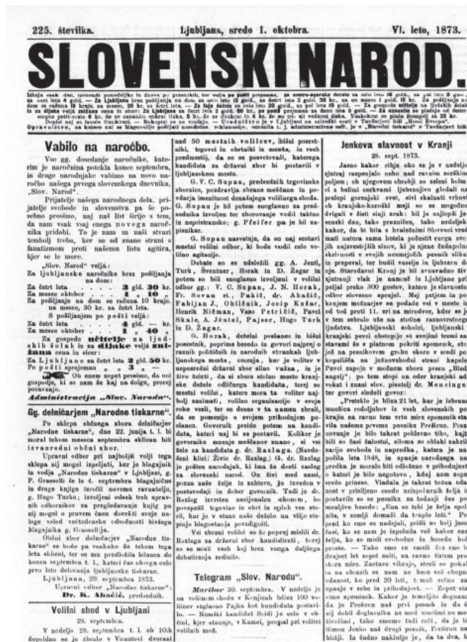
Slika 1: SLOVENSKI NAROD, 1. 10. 1873: 1

Razlog, da smo iz letnikov 1913 in 1933 zajeli le po 5 številki, je ta, da so bile posamezne številke v teh dveh letih precej bolj obsežne kot v obeh predhodnih (upoštevajoč število strani, črkovno vrsto, velikost črk in število stolpcev, prim. Slika 1 in 2). Čeprav smo skušali zajeti primerljiv obseg, pa naš vzorec po letnikih še vseeno ni uravnotežen (če bi želeli takega, bi morali imeti podatke v številu znakov), zato smo se v nadaljevanju odločili, da oceno trenda rabe medstave po obdobjih vključimo zgolj na kratko in samo v povzemalnem delu analize.