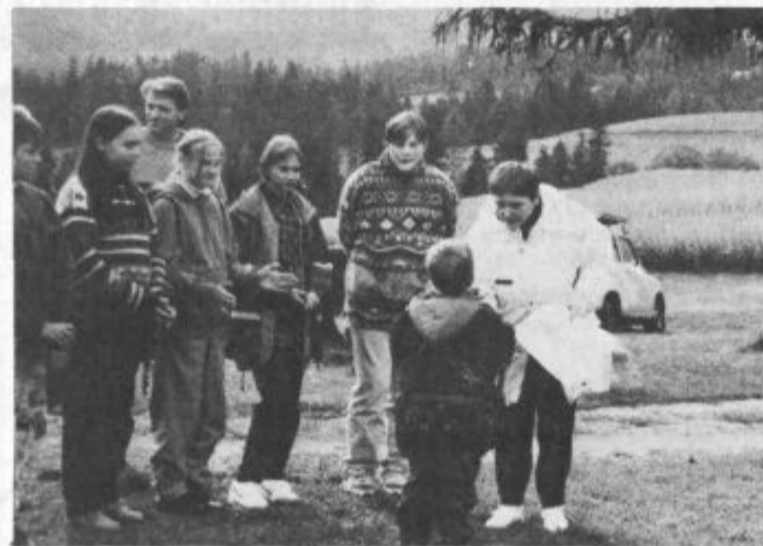
Priznanja so si zaslužili vsi udeleženci