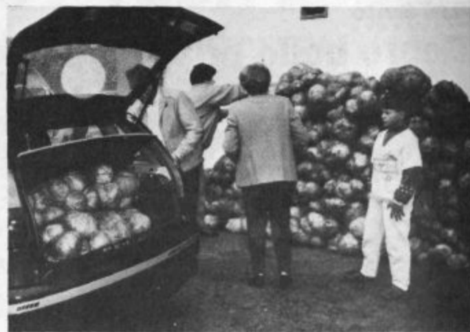
Vreče zelja in krompirja bodo zagotovo pripomogle k družinskemu proračunu.

najbolje zagotovo sami. Prav vsi po vrsti so bili veseli vreč krompirja