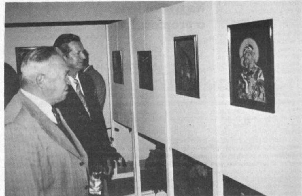
V avli kulturnega doma so na ogled postavili dela domači ustvarjalci.

■ Milena Krstič - Planinc ■ foto: Stane Vovk