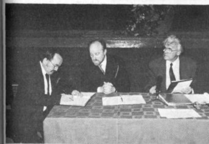
Svetniki so podpisali svečane izjave.

Menih pa je ob tej priložnosti v varstvo in uporabo prejel svečano protokolarno župansko