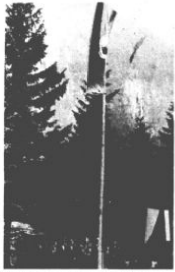
Zastava jugoslovanskih PTT planincev je tokrat vihrala v Logarski dolini

Zbor planincev PTT Jugoslavije s tem seveda ni bil zaključen. Popoldne so se zvrstila številna športna tekmovanja, pripravili pa so tudi