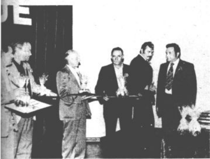
V petek je bil v kulturnem domu sprejem za jubilarne rudarskega šolskega centra. Zbralo se je okoli štiriniso delavcev te delovne organizacije, ki so v združenem delu zaposleni že deset, dvajset ali trideset let. Posebne nagrade in priznanja pa so prejeli delavci, ki so zaposleni v delovni organizaciji rudarski šolski center deset ali dvajset let.