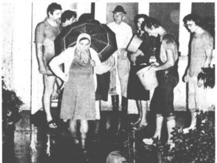
Ob Jenkovi so se stanovalci kar sami spopadli z vodo, ki je grozila, da bo vdrla v stanovanje