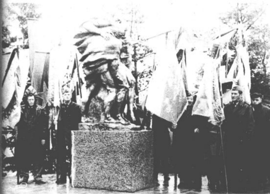
Močan dež, veter, „juriši“ pripadnikov enot teritorialne obrambe občine Velenje in nekdanjim borcem ter ostalim udeležencem proslave so misli segle za trenutek nazaj v tiste hude trenutke, ko je „Štirinajsta“ jurišala skozi sovražnikovo obrobo na Graški gori — gori jurišev