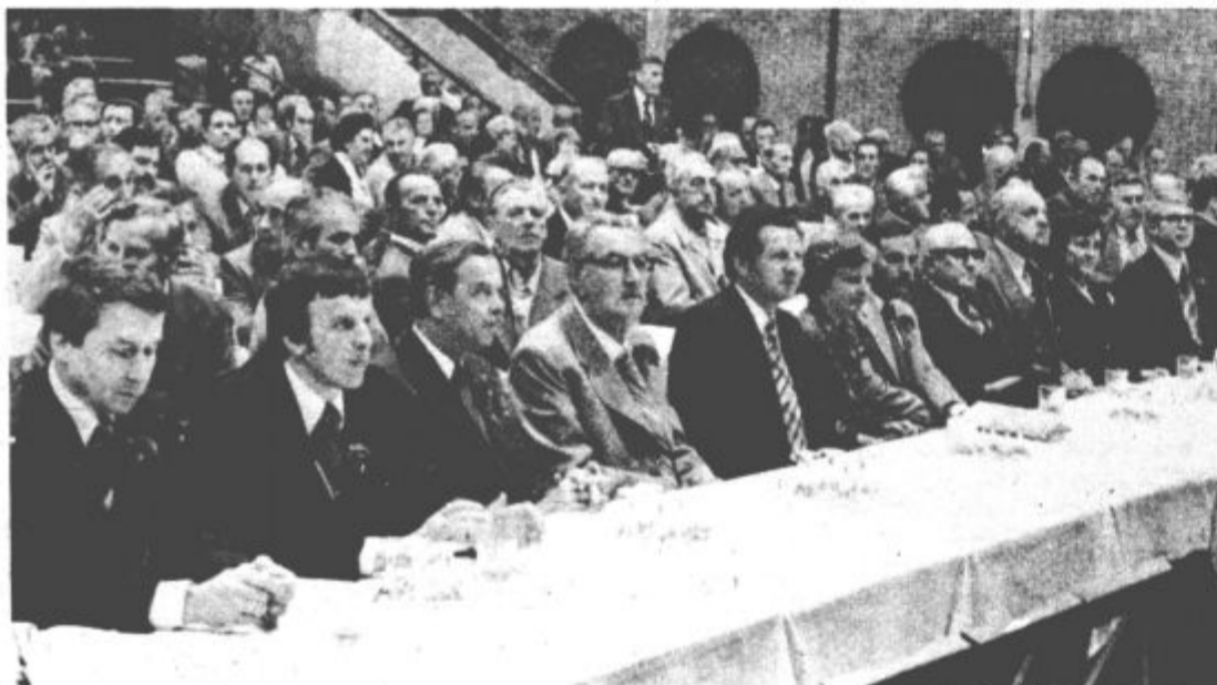
Gostje in drugi udeleženci med tradicionalno proslavo ob skoku čez kožo

Po končani svečani seji so gostje, jubilarji in delegati zbrani še pred kulturnim domom, kjer so jim njihovi godbeni zaigrali nekaj koračnic.