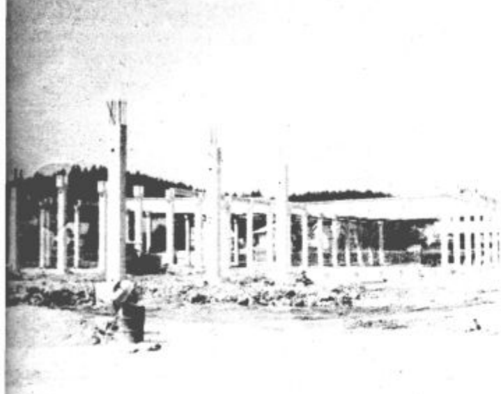
Novo proizvodna dvorana raste iz dneva v dan