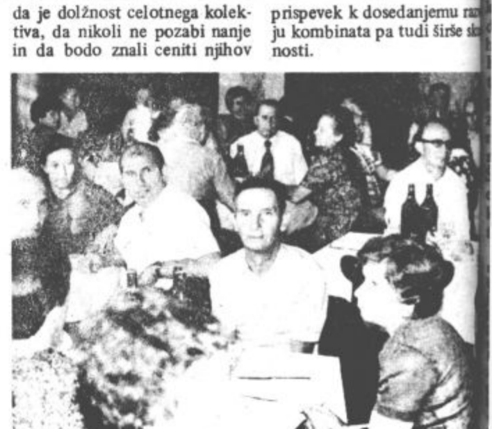
Med srečanjem v delavskem klubu