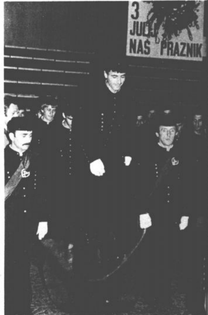
Skok v rudarski stan

Med priložnostnim kulturnim programom, v katerem so sodelovali skupina KUD Braševič iz Vrnjačke Banje, moški pevski zbor Kajuh, Šaleška folklorna skupina, recitator Karel Seme in Rudarska godba, so na svečan način, s skokom čez kožo sprejeli v rudarski stan 72 učencev rudarskih šol velenjskega rudarskega šolskega centra.