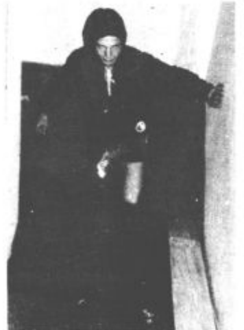
Tudi v kletnih prostorih stanovanjskih blokov ob Šlandrovi in Vojkovi cesti je bilo vode do kolen

Takšno poletje, kot letošnje, že dolgo ne pomnimo. Nebo se v trenutku stemni in iznenada začne liti