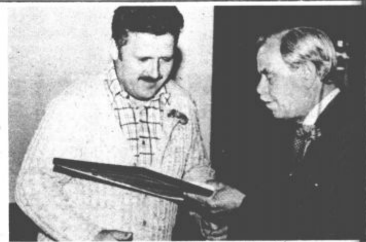
Letos kar 129 „dvajsetletnikov“