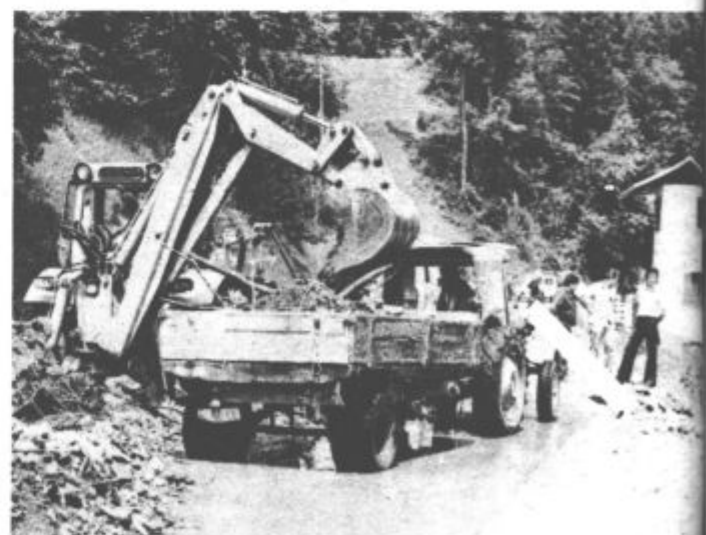
S ceste Šošanj — Šmartno ob Paki v Skornem je bilo potrebno odstraniti kar lepo število traktorskih prikolic kamenja in blata