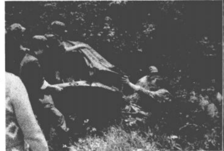
Ena od desetih avtomobilskih školjk