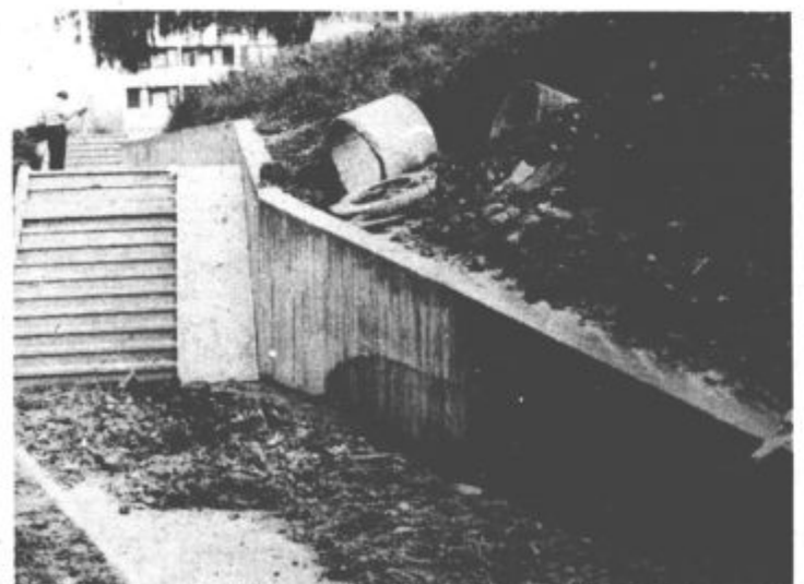
Med blokoma, ki stojita ob Koroški cesti in na Šercerjevi, je voda pokazala svoje zobe. Ali pa je bila slabo narejena kanalizacija?

Kritiko pa zaslužijo tudi nekatere krajanje. Vemo, da je zelo hudo, če kleti vdira voda, vendar so tem najmanj krivi gasilci, ki so bili soboto z vsem razpoložljivim orodjem vseh povsod po Velenju. Z vodo stihijo so se spopadali praktično od 15. ure popoldne, v toplo popoldne pa so se zadnji vrtili šele ob uri zjutraj. Seveda so domov prišli premraženi in premočeni do kolen. Naši gasilci so prostovoljci in izmenno veliko požrtvovalnost kot zadnji soboto, so doslej že ničkolikor izkazali. Zato si gotovo niso zaslužili zmerjanj po telefonu, ker pa se enkrat niso mogli biti na desetih in dvajsetih krajih. Sicer pa je bil v botni naliv tudi priložnost, da marsikateri soseski preizkusijo del svojih enot civilne zaščite.