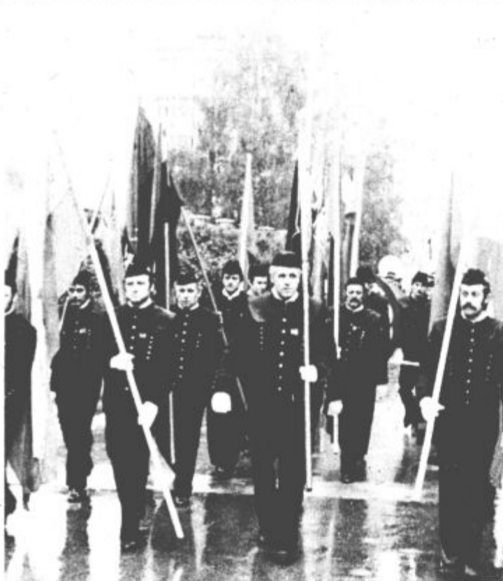
Kljub dežju so rudarji tudi letos pripravili tradicionalno paradu

S tem, da sem prej omenil le proizvodnjo premoga in električne ter toplotne energije, sem to storil zaradi osnovnih programskih obveznosti, ki jih imamo v prihodnosti še večje. Z enako mero odgovornosti in skrbi dajemo vso podporo delovni organizaciji Elektrostrojna oprema, ki proizvaja del potrebne rudniške opreme, delno pa se že uspešno uveljavlja na širšem tržišču. Ta kolektiv je že lani izdelal 5.200 ton strojne opreme za industrijo in rudarstvo. Ob vsem se z novimi pro-