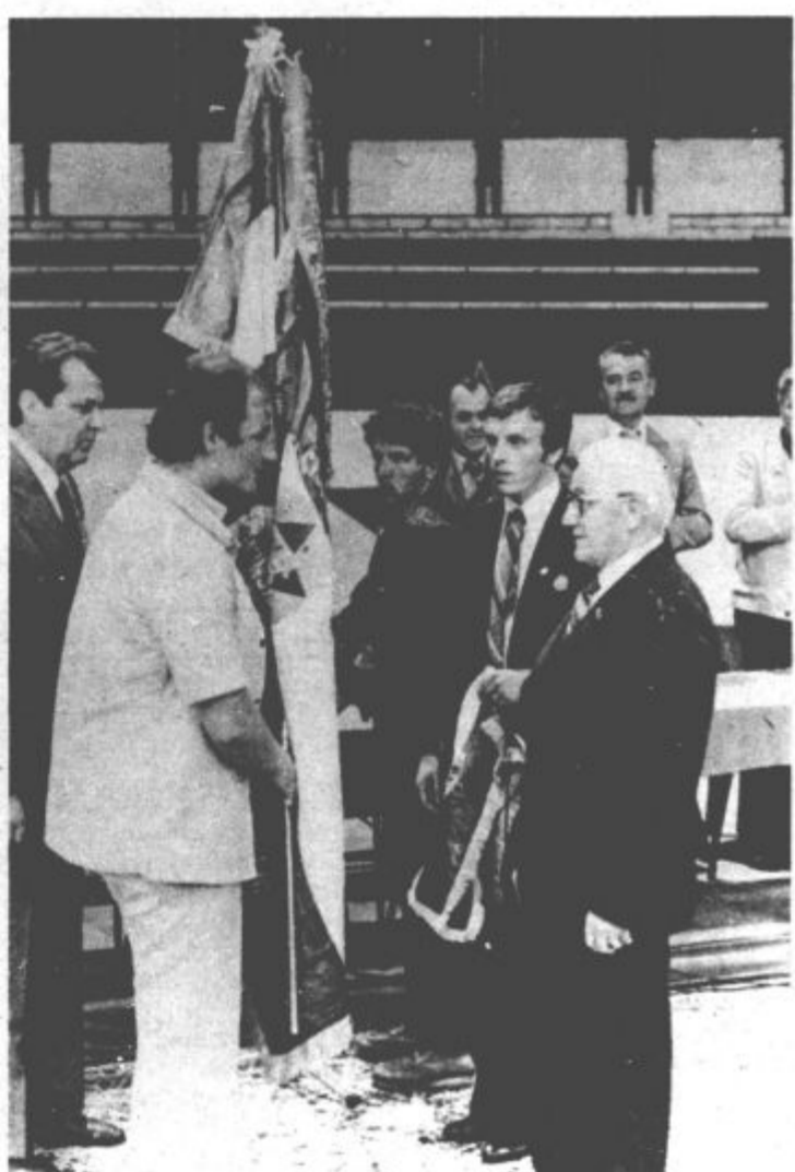
Izmenjava zastave med predstavniki Mostarja — lanskimi organizatorji srečanja in Velenja

V sredo, 4. julija so se gostje odpeljali na Duh na Ostrem vrhu pri Mariboru, kjer so se udeležili osrednje slovenske proslave ob dnevu borca — 4. julija. Včeraj zjutraj pa smo se poslovili od udeležencev letošnjega srečanja borcev in mladine petindvajsetih občin Jugoslavije.