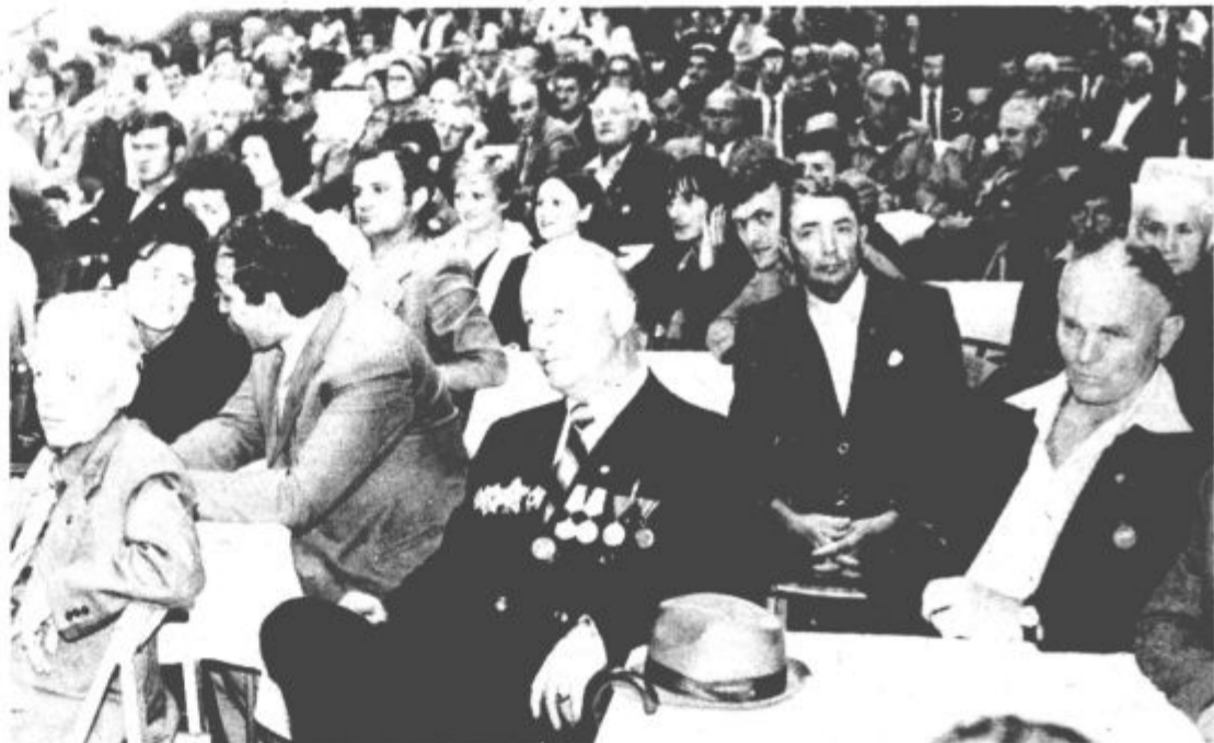
Udeleženci slavnostne seje XIII. srečanja borcev NOV in mladine Jugoslavije v Rdeči dvorani

Na koncu, tovariši borci, rudarji, mladina in občani mi dovolite, da vam čestitam k dnevu rudarja in 4. juliju, dnevu borca.