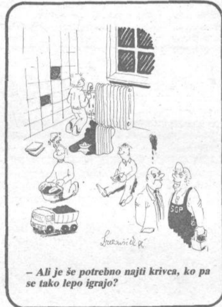
– Ali je še potrebno najti krivca, ko pa se tako lepo igrajo?

Pred časom je občinski izvršni svet obravnaval poročilo o stanju objektov zgrajenih iz sredstev vseh treh ljubljanskih samoprispevkov. Ob tem je sprejel vrsto pripomb, ki so zadevale »neodpravo« napak in pomanjkljivosti, ki se ob uporabi omenjenih objektov – vrtec in šol – dnevno pojavljajo. Skupaj z zahtevo, da se enkrat za vselej ugotovijo krivci odnosno povzročitelji teh nedopustnih napak, jih je posredoval LIZ Inženiring kot organizaciji, ki je opravljala investitorski inženiring za objekte. Le-ta je posredovala odgovor, ki je po mnenju občinskega operativnega štaba odbora Samoprispevka III. nezadovoljiv.