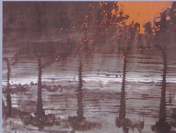
Urška Ota: "Bila je noč" (2. nagrada na likovnem natečaju SKK-MOSP 2003)

Bush si pravzaprav res želi miru, ampak posebnega miru, t.i. pax americana. Slednja se uresničuje v stabilnosti geopolitičnega prizorišča kot temelja nemotenega razvoja ameriške globalizacije. Za Clintonovo osemletno obdobje je bil značilen cvetoč ekonomski razvoj (srednja rast BDP-ja je bila med Clintonovim predsednikovanjem 3,7% letno): leto 2000 so ZDA zaključile celo brez javnega primanjkljaja, zabeležili so surplus v vrednosti 1,7% BDP-ja. Clintonu je pri tem izrazito pomagal umetno napihnjeni balon internetne nove tehnologije, ki je ameriško ekonomijo dvignil v nerealno vrtooglave višine. Ko je balon zaradi prenapihnjnosti počil, je ameriška ekonomija padla na realna tla. Nastopilo je obdobje recesije. (dalje)