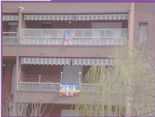
Pax in "pax americana"

riško odločitvijo, ki vidi edino rešitev le v vojni. Potreben bi bil kompromis, a današnjemu človeku je ta beseda še vedno zelo daleč.